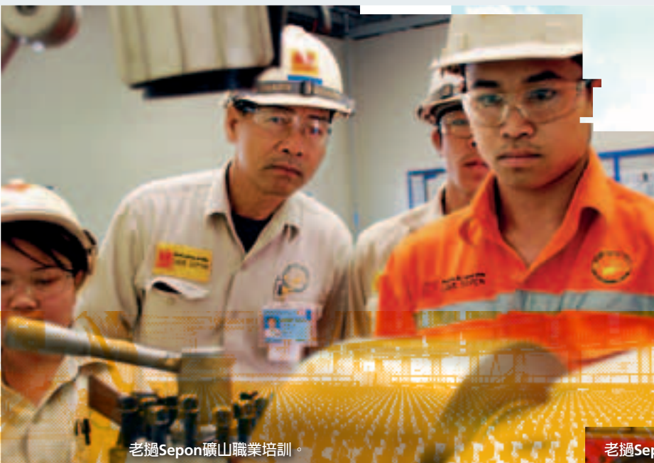
老邁Sepon礦山職業培訓。