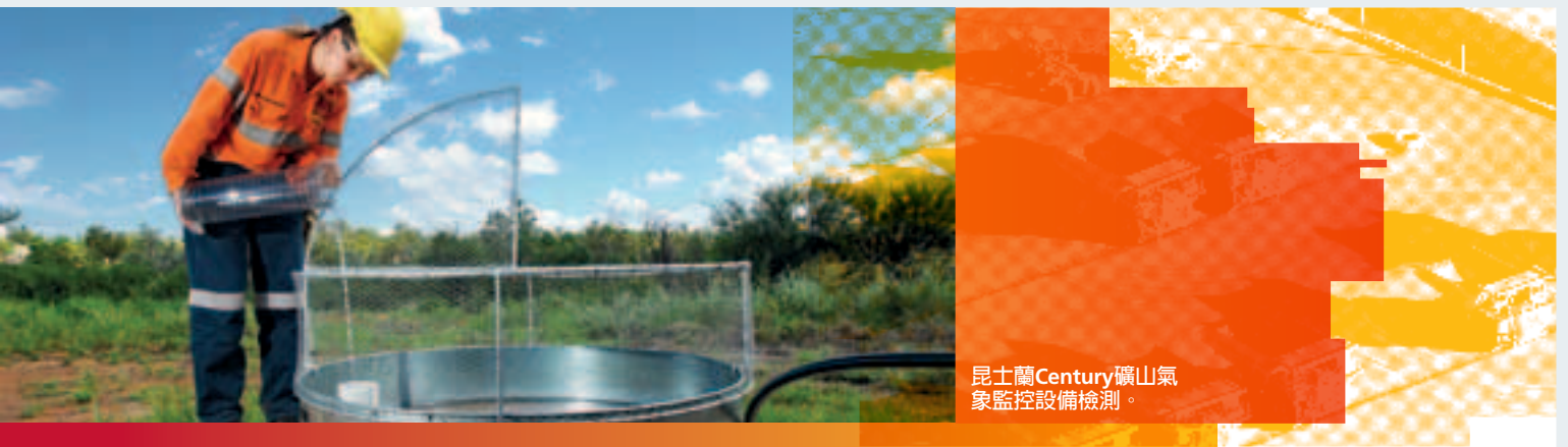
昆士蘭Century礦山氣象監控設備檢測。

二零一零年七月MMG向Rosebery鎮區提出最終建議並指出無證據表明Rosebery存在的重金屬會對人體健康造成危害。塔斯馬尼亞衛生及人類服務處(Tasmanian Department of Health and Human Services)認可MMG的結論並出席相關社區會議。