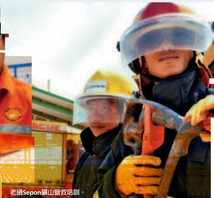
老邁Sepon礦山營救培訓。