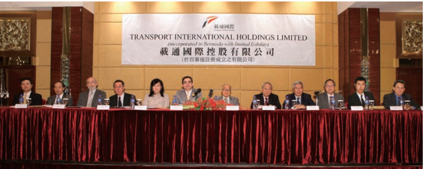
眾董事於2010年股東週年大會上會晤載通國際股東