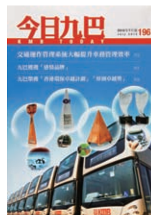
集團出版一系列刊物，讓公眾掌握集團最新的發展概況