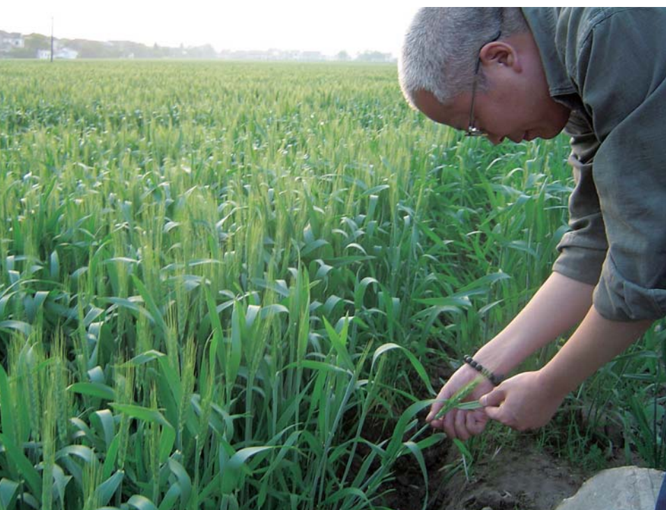
○ 專家深入田間進行指導