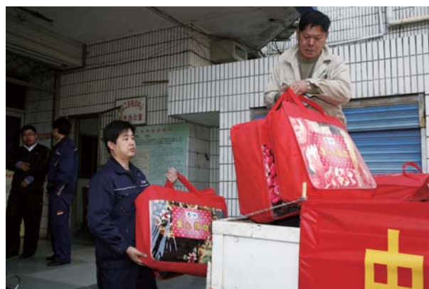
生化能源事業部開展「送溫暖獻愛心」活動