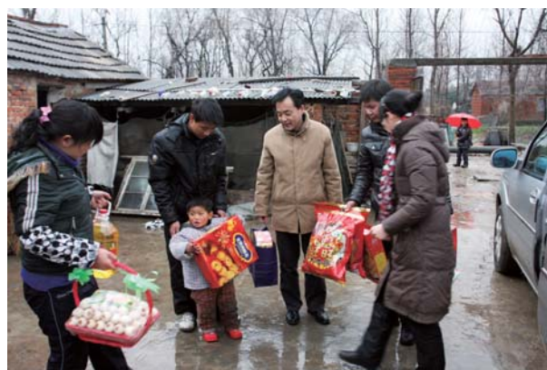
2010年春節，看望唇顎裂兒童

在江蘇，我們向南京市白下區洪武街道30戶困難居民送去愛心，為每戶送去「五湖」東北大米和「福臨門」調和油。