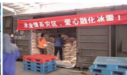
○ 組織員工為災區人民募捐