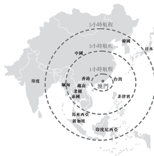
澳門往毗鄰主要人口集中地的飛機航程