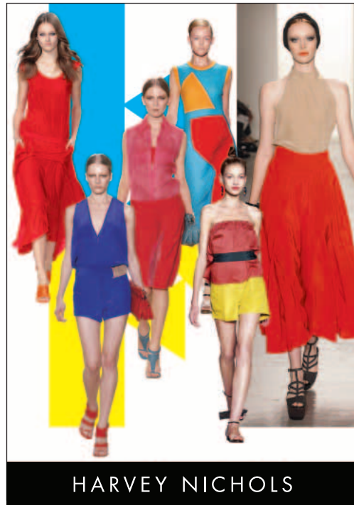
Ladies fashion at Harvey Nichols. 於「Harvey Nichols」的女士時裝。

本集團對其新項目所具強大潛力感到雀躍。位於香港太古廣場佔地八萬三千平方呎之全新「Harvey Nichols」旗艦店將齊集國際頂尖品牌，於其六項主要產品類別，包括美容及化妝品、鐘錶及珠寶、男士及女士服裝及配飾、兒童服裝及生活用品，因而使該店成為香港及國際消費者必到之處。為確保該店秉承「Harvey Nichols」之風格，本集團將與「Harvey Nichols」之英國團隊緊密合作，以監察該店之籌備開設流程及其貨品。「Harvey Nichols」之太古廣場店，連同其置地廣場店，將鞏固「Harvey Nichols」於香港零售名貴商品市場之領導地位。