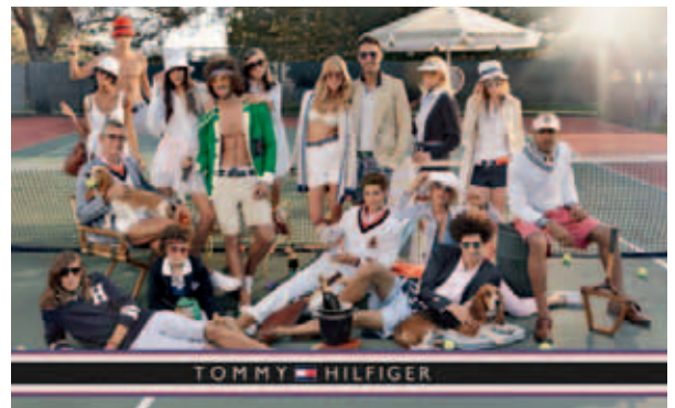
Fashionwear by Tommy Hilfiger. 「Tommy Hilfiger」時裝。