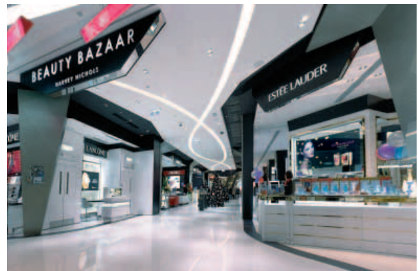
Beauty Bazaar by Harvey Nichols at THE ONE, Tsimshatsui, Hong Kong. 位於香港尖沙咀「THE ONE」的「Harvey Nichols」之「Beauty Bazaar」店。