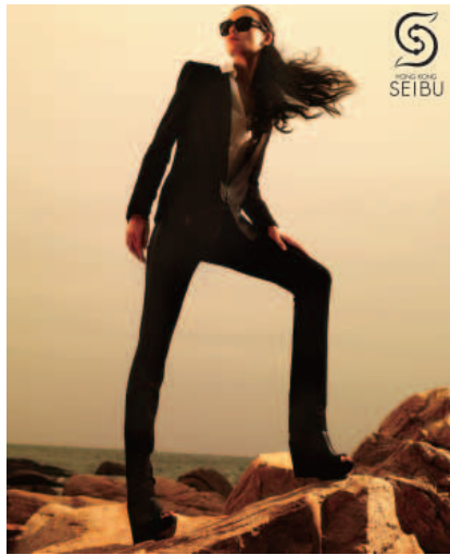
Spring / Summer 2011 fashion at Hong Kong Seibu. 於「香港西武」的二零一一年春/夏季時裝。