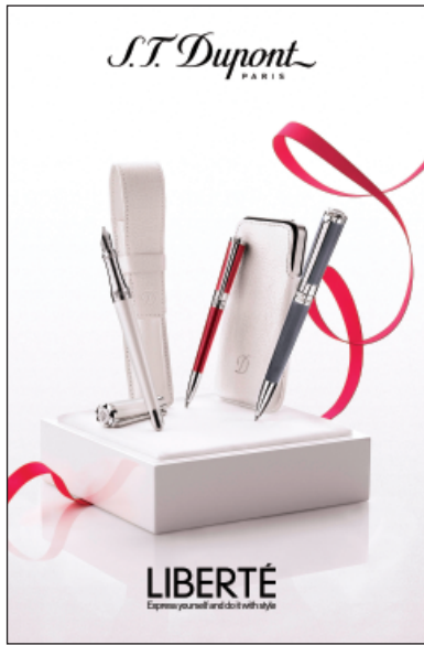
S.T. Dupont 'LIBERTÉ' feminine writing instruments. 「都彭」的「LIBERTÉ」女士書寫文具。