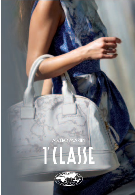
1ª Classe Alviero Martini handbag. 「1ª Classe Alviero Martini」手袋。