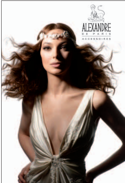
Luxury hair accessories by Alexandre de Paris. 「Alexandre de Paris」名貴髮飾。

「Harvey Nichols」之「Beauty Bazaar」之成功推出顯示了此概念之重大潛力。本集團將於中國市場推出「Harvey Nichols」之「Beauty Bazaar」，同時亦在其他東南亞市場探索發展機會。憑藉「American Eagle Outfitters」在香港市場之成功推出，並計劃於香港及中國多開設六間店鋪，均清楚展示了本集團對此品牌之潛力充滿信心。本集團有信心所有此等新業務將成為本集團於未來數年之重要增長動力。