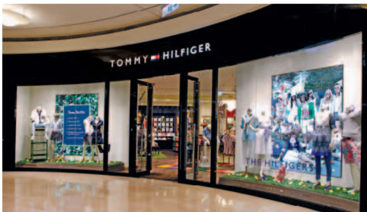
Tommy Hilfiger boutique at Taipei 101 Mall, Taipei, Taiwan. 位於台灣台北市台北101購物中心的「Tommy Hilfiger」精品店。