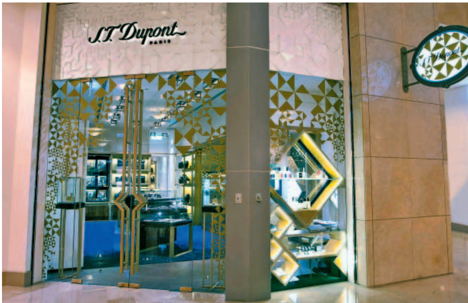
S.T. Dupont boutique at Taipei 101 Mall, Taipei, Taiwan. 位於台灣台北市台北101購物中心的「都彭」精品店。