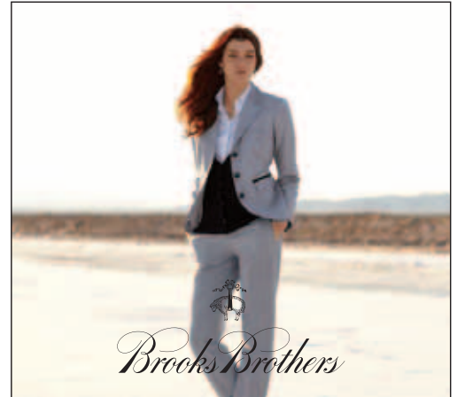
Brooks Brothers ladieswear. 「Brooks Brothers」女士時裝。

於二零一零年十二月，本集團已在香港尖沙咀彌敦道新開業之購物商場「THE ONE」推出其嶄新「Harvey Nichols」之「Beauty Bazaar」美容概念店。該店佔地逾一萬八千平方呎，並在型格與時尚之環境下提供一系列世界最知名及受歡迎品牌之精貴美容產品，以及「Harvey Nichols」獨特之「Beyond Beauty」概念。自該店開業以來，「Beauty Bazaar」即時廣泛流行，其銷售額更高於本集團所預期。本集團將繼續在香港及中國兩地推廣該零售概念。