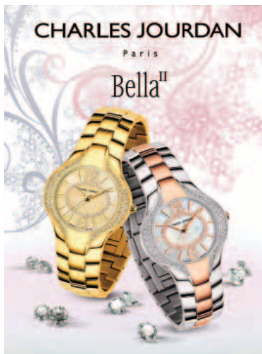
Charles Jourdan 'Bella II' watches. 「卓丹」的「Bella II」腕錶。

於本年度內之一項重大發展為宣佈將於二零一一年十月於香港太古廣場開設一間全新之「Harvey Nichols」旗艦店，於今財政年度之投資額為港幣一億五千萬元。預期該新旗艦店將完全與現時位於置地廣場之「Harvey Nichols」店並駕齊驅，並在東南亞地區及中國市場彰顯「Harvey Nichols」帶領潮流的獨特風采。