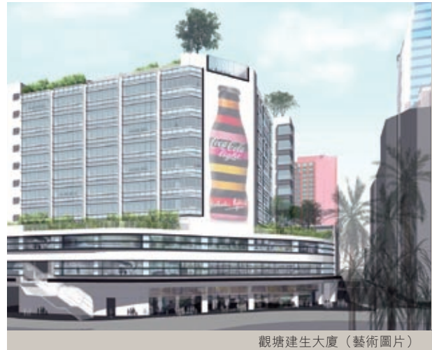
觀塘建生大廈 (藝術圖片)

由重新融資所得之現金分派港幣18,800,000元。作為聯營公司，該項投資為本集團貢獻溢利港幣9,800,000元。