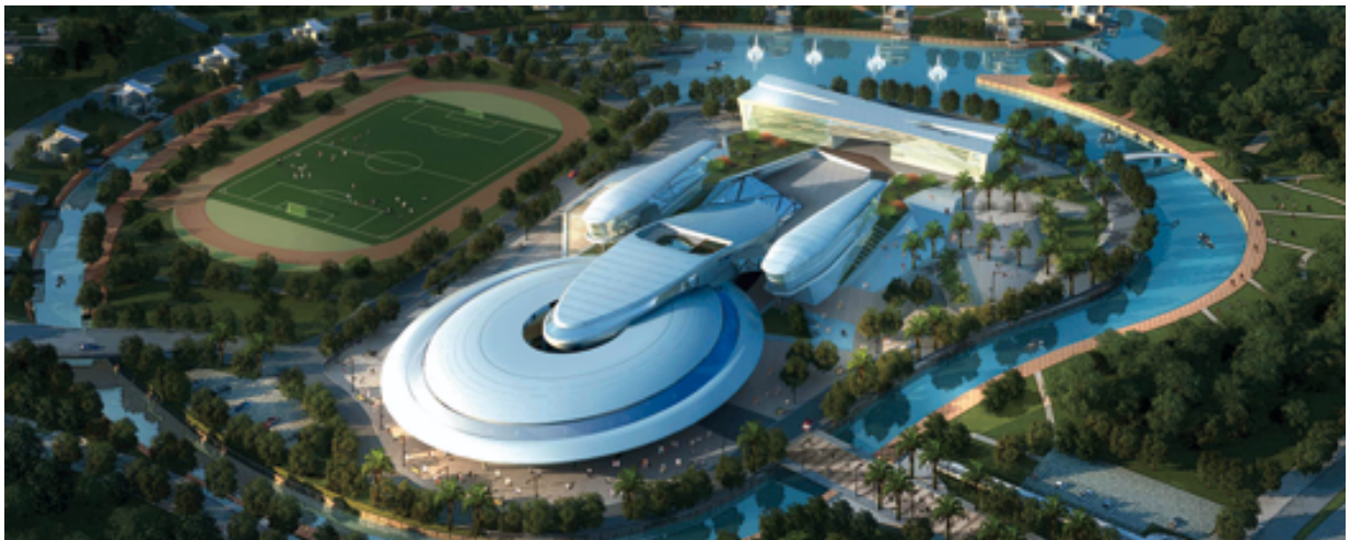
該項目之日景—人工設計圖片 (需再行修改)

本集團於二零一零年收購一幅土地 (「已擁有土地」) 及位於中國福建省長樂市湖南鎮大鶴村的樓宇、土地及沿岸範圍 (「該物業」)。