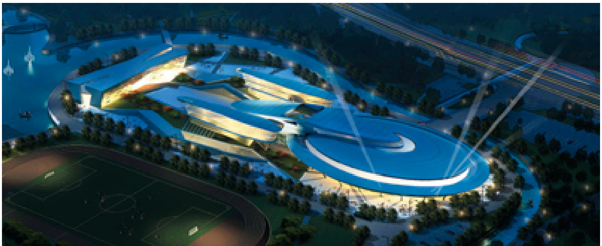
該項目之夜景—人工設計圖片(需再行修改)