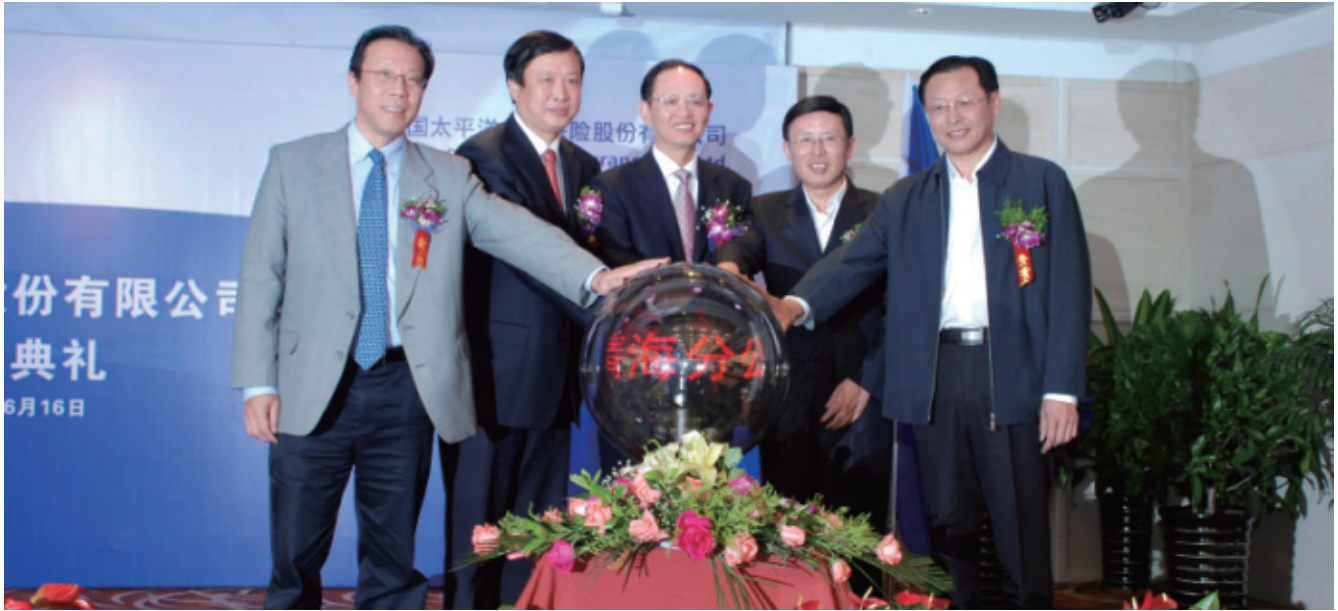
2011年6月16日，太保壽險青海分公司開業，圖為開業典禮現場。