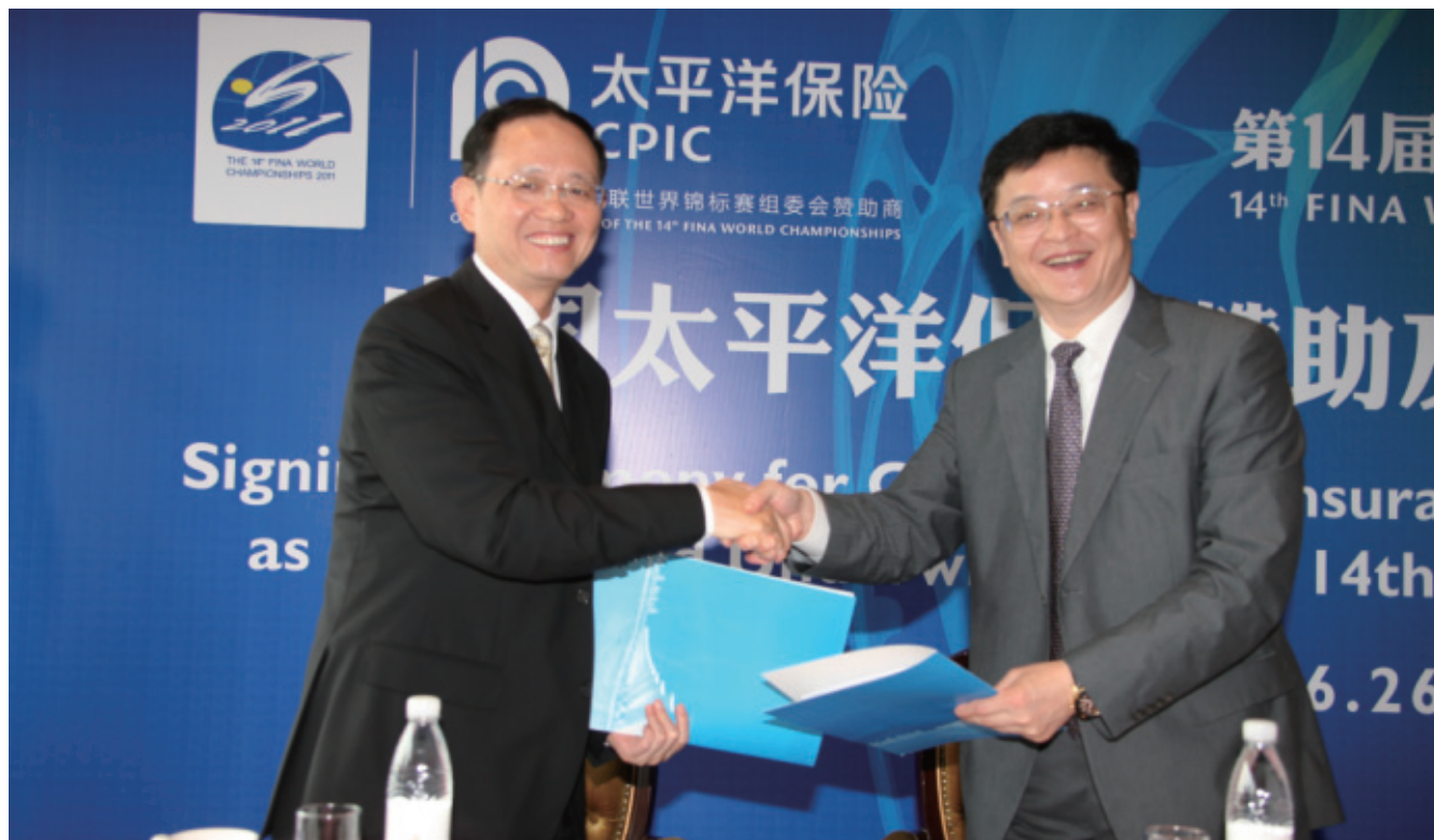
2011年6月26日，中國太保贊助及獨家承保在上海舉行的第十四屆國際泳聯世界錦標賽。

本公司主要通過下屬的太保壽險、太保產險為客戶提供全面的人壽及財產保險產品和服務，並通過下屬的太保資產管理和運用保險資金。此外，本公司控股長江養老從事養老金業務，還通過太保香港、太保投資(香港)在香港市場分別從事財產保險和資產管理業務。