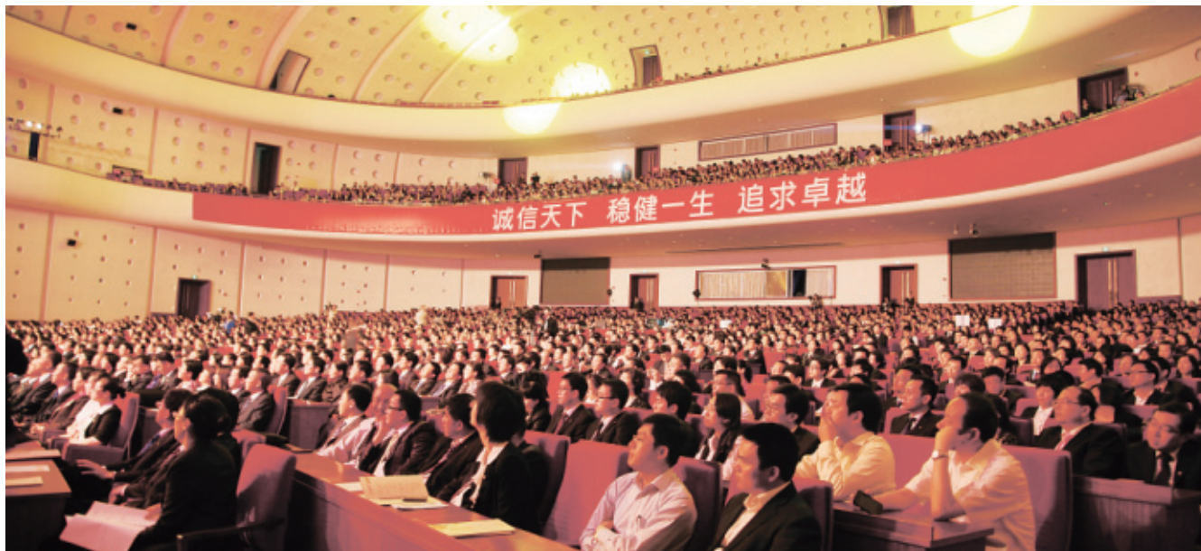
2011年5月13日，中國太保舉行20週年司慶典禮。

今年以來，面對複雜多變的國際國內經濟金融形勢，中國太保堅持專注保險主業、推動並實現可持續價值增長的發展戰略，積極應對市場環境變化，實現整體業務持續健康發展；上半年實現保險業務收入868.75億元，同比增長14.2%。得益於產險承保盈利能力的大幅提升和壽險盈利水平的較快增長，上半年歸屬於母公司股東的淨利潤實現58.16億元，同比增長44.7%。