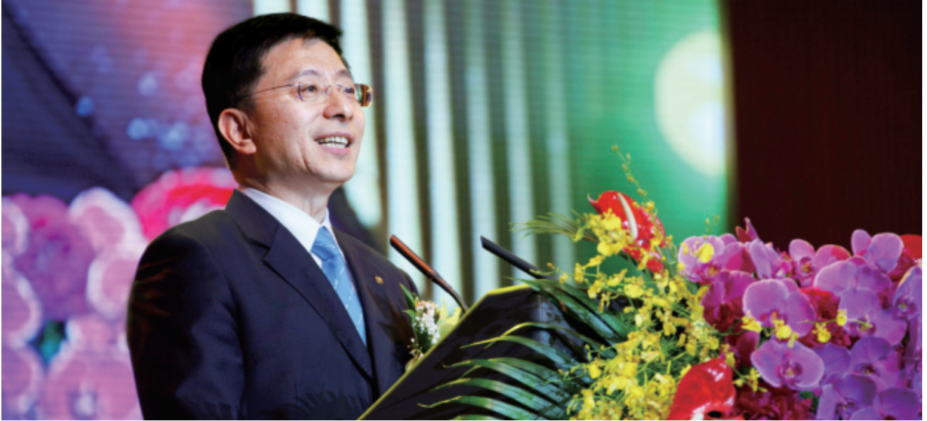
2011年5月13日，中國太保董事長高國富在20週年司慶典禮上致辭。

公司價值持續增長，上半年實現壽險新業務價值38.30億元，同比增長18.3%。產險綜合成本率91.1%，同比下降3.4個百分點；承保盈利能力大幅提升，實現承保利潤19.59億元，同比增長119.8%。