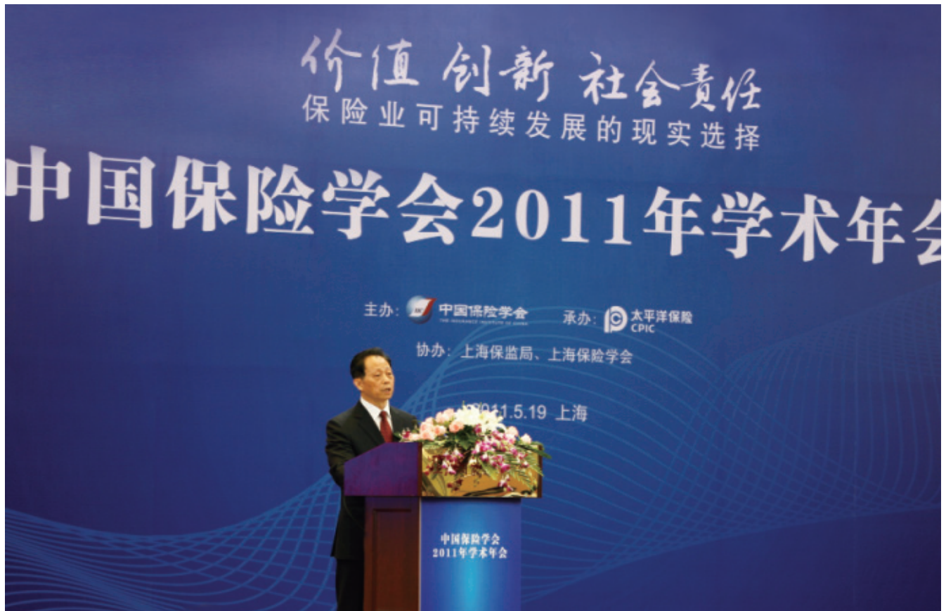
2011年5月19日，中國太保承辦了中國保險學會在上海舉行的2011年學術年會(圖為保監會主席吳定富發表講話)。