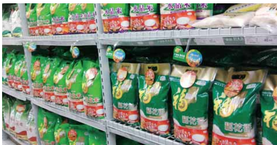
► 超市貨架上的「福臨門」大米

大米小包裝產品已覆蓋大賣場、超市、糧油店、餐飲店等超過 45,000 個銷售終端