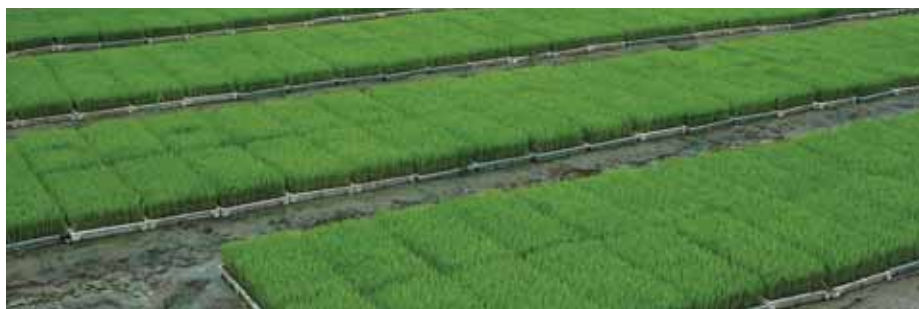
► 中糧東海糧油工業(張家港)有限公司規模化科學育秧

面對國內原糧價格高漲，本公司抓住國際市場行情機遇，適時從泰國、越南等大米出口國以較低成本進口了部分優質大米，滿足了國內市場對大米的多元化需求，並有效紓緩國內原糧價格上漲帶來的壓力。