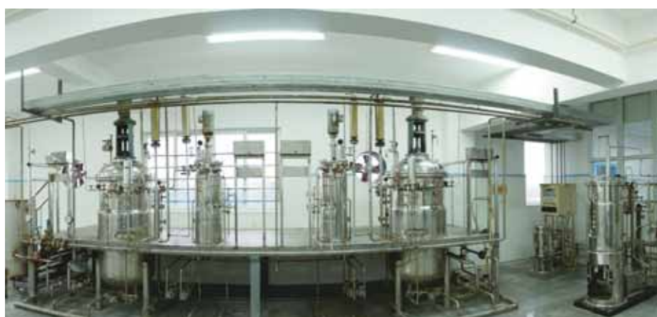
▶ 生物燃料研發中心實驗室