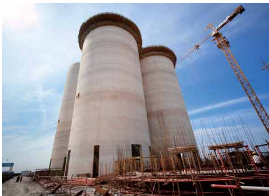
► 擴建中的中糧佳悅(天津)有限公司增加了原料筒倉

面對行業出現較大挑戰，本公司認真研究市場走勢，抓住有利時機，採購遠期所需的原料，有效舒緩成本上升所造成的壓力，並同時審慎地對所購原料和相關產品進行套期保值，這有助管理原料和相關產品價格波動帶來的潛在風險。另外，本公司致力提高管理水平，採取多種有效措施控制生產成本。