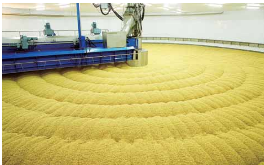
► 中糧麥芽(大連)有限公司的發芽箱

期內，本公司重視新產品的研發，不斷進行產品和工藝創新，適應客戶的個性化需求，當中針對中、高端客戶推出的特製麥芽和精製麥芽均呈現理想的增長。另外，本公司亦致力豐富產品種類，期內積極推廣焦香麥芽，市場反應良好。