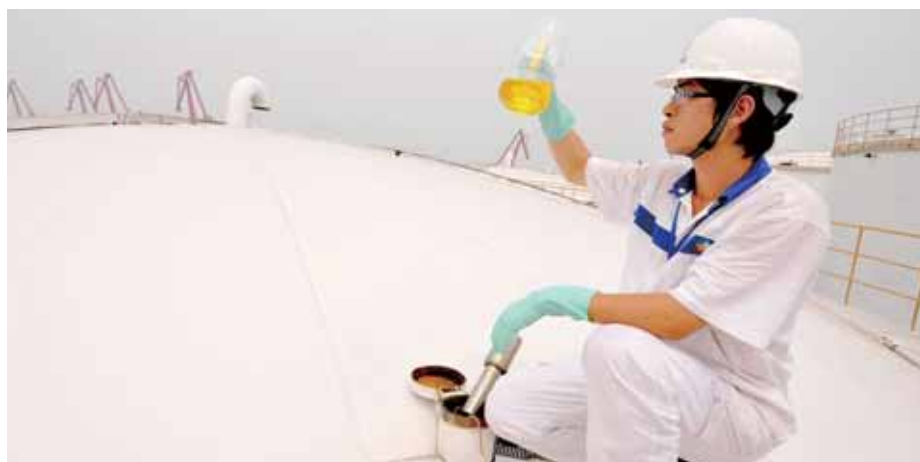
► 中糧東海糧油工業(張家港)有限公司質檢員檢驗樣品油

在客戶服務方面，確保對客戶連續穩定供貨及做好多項售後服務，使食用油銷售保持理想的增長。期內，合計銷售食用油124萬公噸，較去年同期增長33.2%；銷售油籽粕194萬公噸，同比上升29.4%。