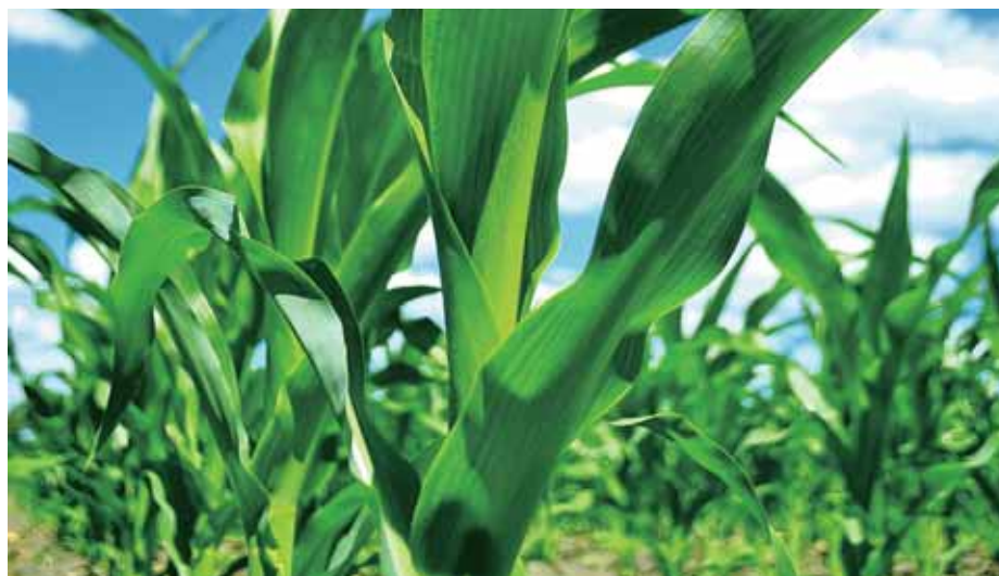
► 黑龍江肇東玉米茂盛的生長狀況

2011年上半年，本公司的生物燃料及生化業務總收入和經營利潤分別為61.679億港元和5.234億港元，較去年同期分別上升23.9%和6.3%。