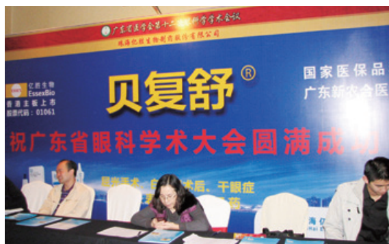
二零一一年十二月十日廣東省第十二屆眼科大會在廣東汕頭舉行