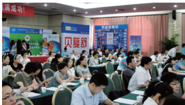
二零一一年六月二十四日在新疆烏魯木齊舉行第十三屆西北五省(區)眼科學術大會