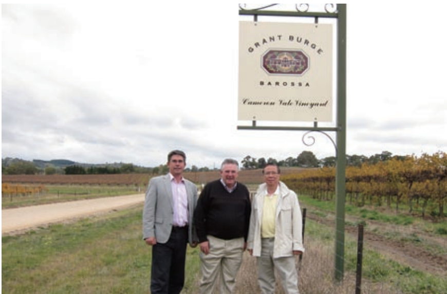
長江生命科技於二零一一年收購Challenger Wine Trust，成為澳紐地區第二大葡萄園主。

Qualco West 葡萄園現時由長期租戶承租，為長江生命科技提供穩定收入及可觀的租金回報。