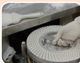
SANTÉ NATURELLE 加拿大 保健產品推售及分銷