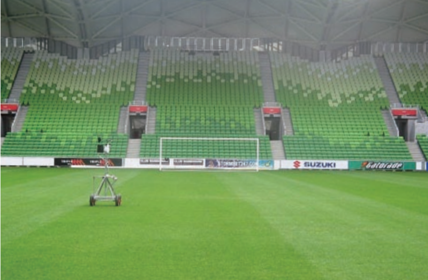
Amgrow的業務範疇包括家居園藝、農業／蔬果及專業草地保育。