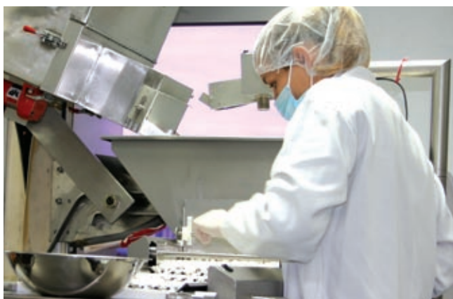
Polynoma 現正研發一種治療黑色素瘤的疫苗。

年內，美國食品及藥物管理局 (「FDA」) 已就 Polynoma 第三階段臨床試驗計劃的特別方案評估 (Special Protocol Assessment 「SPA」) 審批同意書。SPA 乃 FDA 與申請人之間的一項協議，確認建議方案的設計和分析計劃獲 FDA 接納。倘臨床試驗結果正面，SPA 可加快藥物、生物製劑或疫苗日後獲審批的速度。該程序有助產品於日後進行註冊及推出市場。