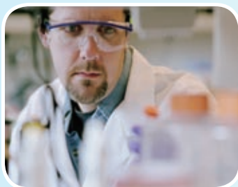
POLYNOMA 美國 黑色素瘤疫苗研究