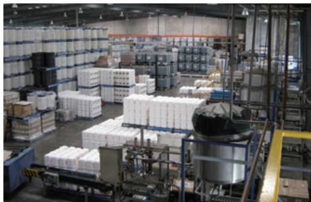
Accensi的服務亦包括配方研發、產品儲存及分銷。

於二零一一年，昆士蘭東部受到破壞性洪水威脅、西部出現長期乾旱，北部地區亦遭強烈氣旋造成嚴重破壞。儘管經營環境充滿挑戰，Accensi 持續穩健增長。