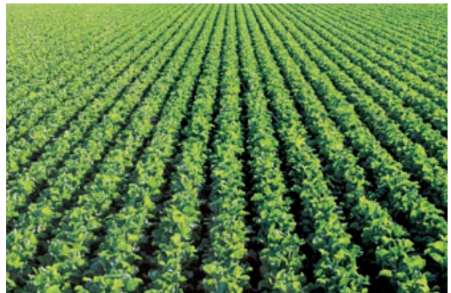
綠先機專門從事研發、生產及銷售農耕用品。

年內，綠先機的業務表現穩健，產品銷量及營業額均錄得增長，其中馬來西亞市場更創銷售新高。