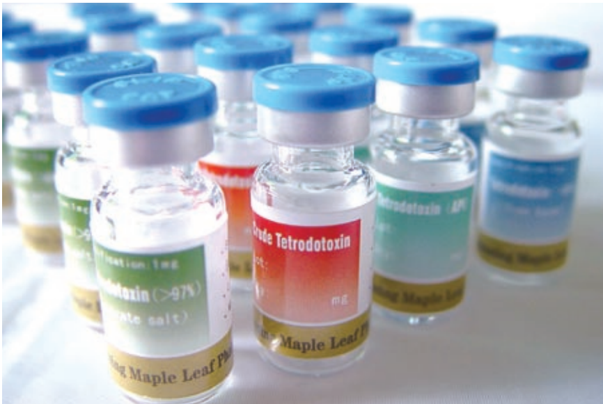
WEX Pharma 研發一項以河豚毒素為基礎的產品，以舒緩各種長期痛楚。

現時，嚴重的癌症痛楚主要靠嗎啡及其他鴉片劑控制。惟此類藥物往往引致不良副作用，並且不經常見效。TTX 具備不帶鴉片特性、不會產生依賴性、迅速見效及效力持久等優點，遂針對受中度至嚴重痛楚影響的癌症病人為目標對象，以補足這類病人在痛楚舒緩方面未解之醫藥需求。