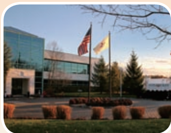
VITAQUEST 美國 保健產品承造