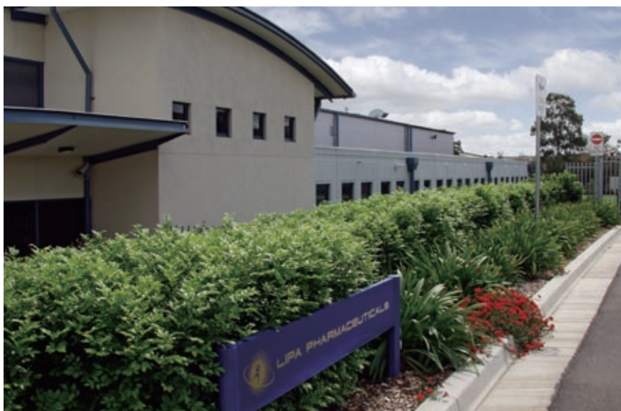
Lipa於澳洲保健產品市場的佔有率逾三成。