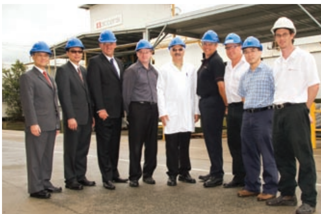
Accensi是澳洲一家具領導地位的植物保護產品獨立承造商。

Accensi Pty Ltd (「Accensi」) 是澳洲一家具領導地位的植物保護產品獨立承造商，於西澳及昆士蘭省設有生產設施，為澳洲本土及國際公司提供產品。Accensi 同時提供配方研發、產品儲存及分銷等服務。