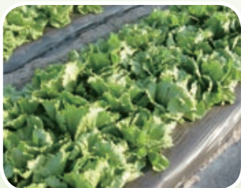
綠先機 中國 肥料業務