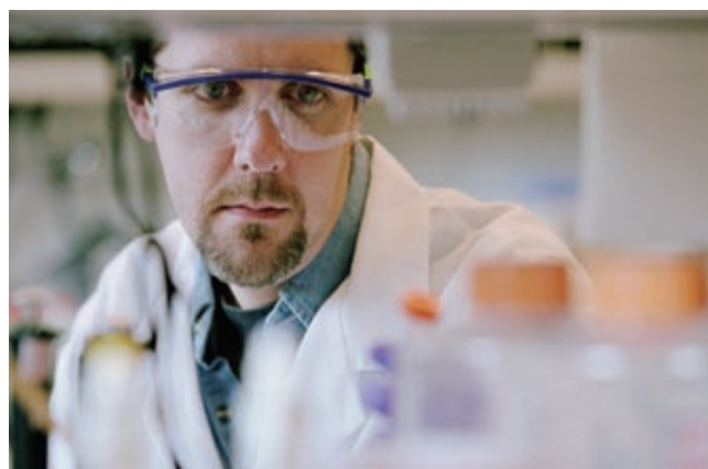
Polynoma 就黑色素瘤疫苗向 FDA 提交之新藥臨床申請獲接納，標誌著長江生命科技成為少數獲得 FDA 核准進行新藥第三階段臨床試驗的亞洲企業之一。

除黑色素瘤治療外，Polynoma 亦已就疫苗對治療肺癌及乳癌等其他癌症之效用展開臨床前測試。