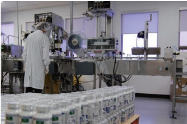
Santé Naturelle 是最先獲頒發加拿大衛生部新訂之 Natural Product Numbers (NPNs) 的品牌之一。

Santé Naturelle A.G. Ltée (「Santé Naturelle」) 是加拿大魁北克省最歷史悠久及最具規模的天然保健產品公司之一。Santé Naturelle 以 Adrien Gagnon 品牌推出之保健產品約有一百五十種，並憑著卓越品質及顯著功效奠定省內業界翹楚之地位。Santé Naturelle 為加拿大衛生部新訂之監管制度下最先獲頒發及持有最多天然產品號碼 (Natural Product Numbers 「NPNs」) 的品牌之一，該制度旨在確保保健產品的效益聲稱及質量具真確性。Santé Naturelle 在心臟保健、改善睡眠質素及舒緩壓力等主要產品均佔有一定的市場份額。