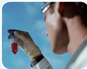
WEX PHARMA 加拿大 痛楚舒緩產品研究