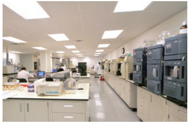
Vitaquest 是美國具領導地位的保健產品承造商。

於二零一一年，Vitaquest 除推出一系列新產品配方外，並更新粉末生產設施，以增加罐裝、袋裝、棒裝及細小瓶裝等包裝形式；同時特別研製專業「冷成型」(cold forming) 吸塑包裝，以迎合主要客戶的需求。此外，Vitaquest 與客戶簽訂添置訂造設備協議，生產含有可幫助維持情緒平衡的 SAM-e 成份之配方。