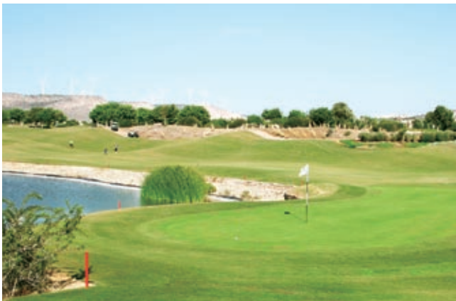
長江生命科技收購澳洲第二大之專業草皮管理和滅蟲管理產品及服務供應商 Peaty 貿易集團。

Peaty 於澳洲農業市場服務逾五十五年，是澳洲第二大專業草皮管理和滅蟲管理產品及服務供應商。