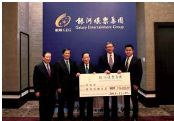
向澳門日報讀者公益基金會頒贈支票