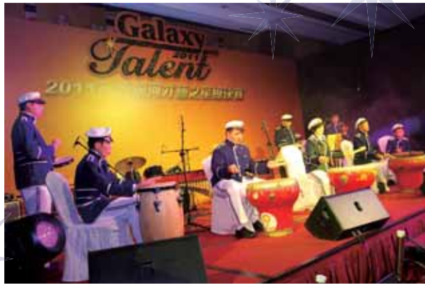
陽光樂隊在「2011銀河才藝之星」總決賽的非凡表演