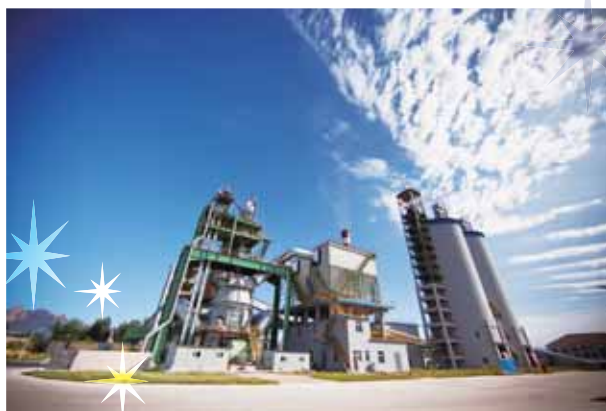
秦皇島首秦嘉華建材有限公司

隨著於河北省遷安之附屬公司於年內開展營運，中國內地礦渣微粉線的溢利貢獻持續增長。集團預期於日後繼續擴充營運。