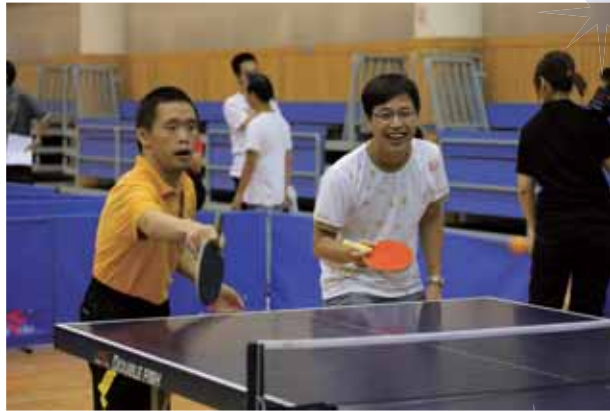
2011銀娛關愛特奧乒乓球賽