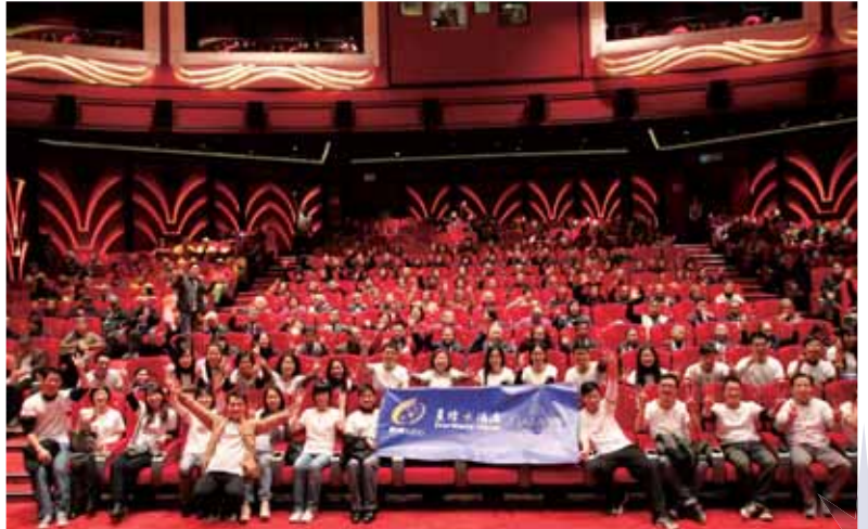
與澳門長者共賞電影