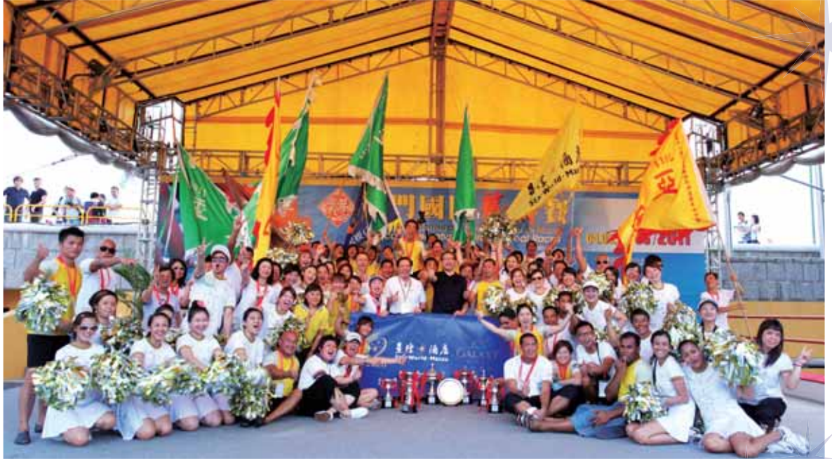
銀娛龍舟隊參加「2011澳門國際龍舟賽」