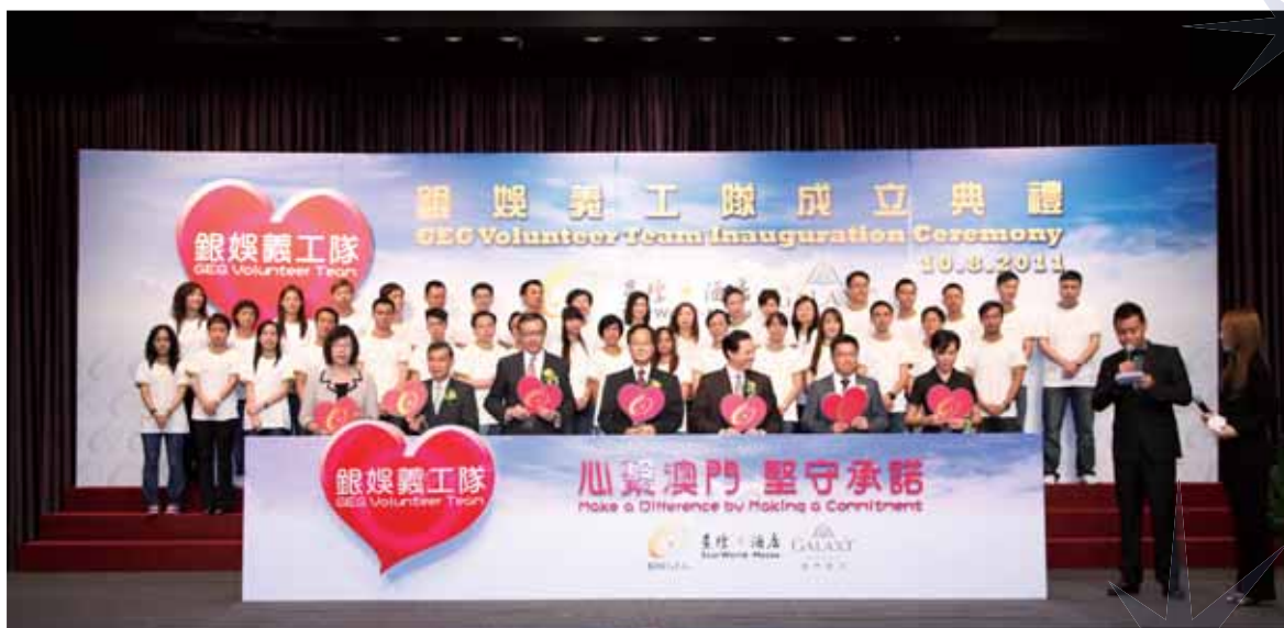
銀娛義工隊成立典禮