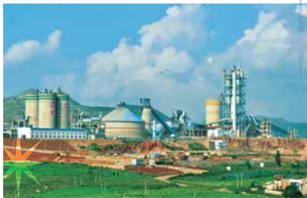
曲靖昆鋼嘉華水泥建材有限公司

由於省內用於建設基建項目的優質水泥需求持續增加，建築材料業務於雲南省安寧、寶山及師宗的水泥合資公司二零一一年的業績表現良好。建築材料業務計劃於二零一二年及其後繼續擴充其水泥生產能力。