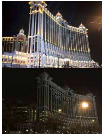
星際酒店及「澳門銀河™」參與「齊熄燈一小時」活動