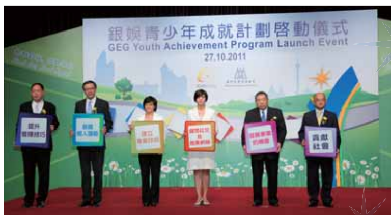
銀娛青少年成就計劃啟動儀式