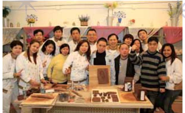
與澳門扶康會一同參加陶藝興趣班