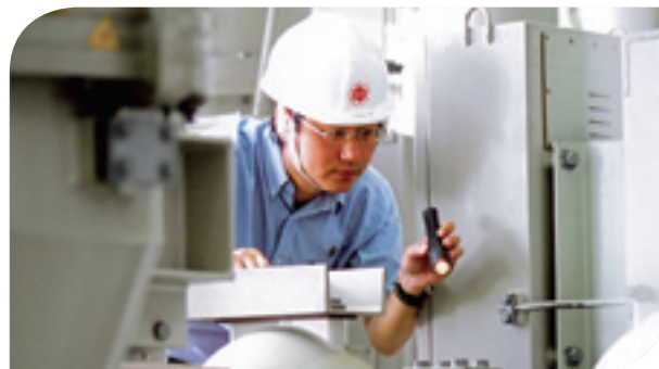
進行定期檢查時一絲不苟，確保工作場所安全。

電能實業十分重視安全營運。香港電燈有限公司（港燈）自二零零六年引入天然氣發電後，燃氣發電機組的營運及維修工作一直保持「零意外」紀錄。我們亦會進行定期檢查，確保工作環境安全及符合安全守則。