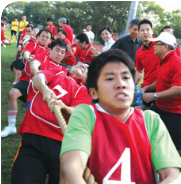
電能續FUN家庭同樂日吸引近一千五百位同事及親友出席。

為保持競爭力，我們每年均會全面檢討薪酬待遇，特別與相關行業和同類型機構相比較。集團制定的「關鍵績效指標」，為個人工作計劃提供方向和指引。在二零一一年，我們繼續採用薪酬與表現掛鈎的政策，評估及獎勵積極主動、勤奮努力和表現出色的僱員。