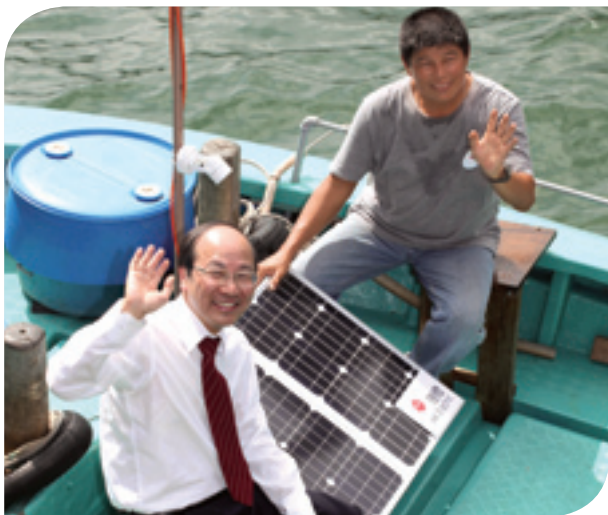
資助本地漁業在漁船及漁排安裝太陽能光伏板，以助降低香港的碳排放量。

電能實業於十月參與香港第六屆國際環保博覽，與包括政府官員、買家、環保專家、教師及學生等海內外持份者約五百人分享低碳生活之道。