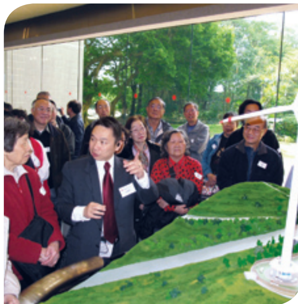
工程師向股東講解南丫風采發電站的運作情況。