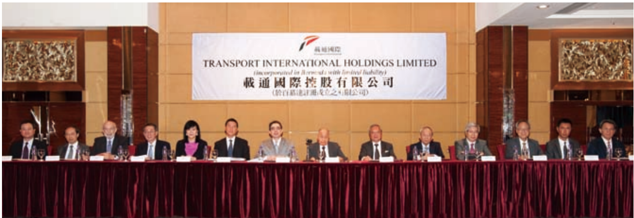
載通國際眾董事於2011年股東週年大會上與股東會晤

司股份過戶登記處確認有關要求有效後，公司秘書將安排召開股東特別大會，並根據公司細則及法定要求，給予所有登記股東足夠的通知期。