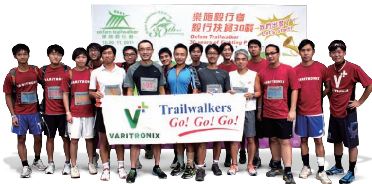
精電於2011年派出4隊毅行者參與樂施毅行盛事。

香港辦事處每年之重點體育項目則有「毅行者」及「渣打馬拉松」。回顧年度內，集團共派出4組隊伍參與樂施毅行者活動，連同支援隊員，共有約30%之香港辦事處職員參與此項遠足盛事。