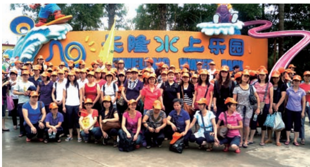
工人於廣州之水上樂園玩樂一天。

我們事前向各部門主管徵詢培訓需要，為職員及工人分別設計年度培訓計劃，基本工作技巧、技術知識、管理技巧、行為規範、以至保密及知識產權等工作操守，都會透過講座，工作坊或課堂教學向職工宣導。