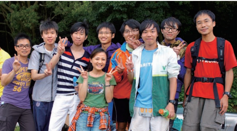
對於毅行者而言，支援隊於100公里山徑中扮演重要角色。

2012年2月，28位精電同事完成馬拉松賽事，28位當中，7位參加全馬拉松，5位參與半馬拉松比賽。精電更設立「精電龍虎榜」，標榜能擦新公司紀錄的跑手。集團為擁有一群熱心、充滿活力、心境年青及愛好運動的僱員而驕傲。