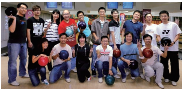
「河源精電盃」之保齡球比賽。

此外，集團亦有為僱員舉行公餘活動如樂隊表演晚會，旅行活動等，而「精電領袖講座」則每兩月舉行一次，邀請特別嘉賓與同事分享他們的人生歷練。