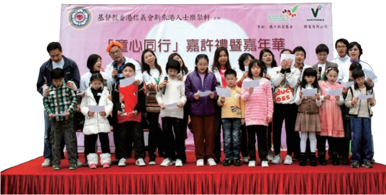
社會服務隊及參與計劃之小朋友齊齊出席嘉許禮。

福利署申請同額撥款推行計劃。整個項目包含學習小組、朋輩活動、興趣班及戶外活動，精電義工更成為參與計劃小朋友的生命導師，建立關愛情誼。