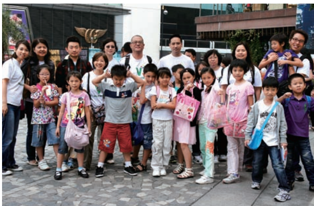
社會服務隊及參與計劃之小朋友於太平山頂一日遊。

為鼓勵僱員積極參與義工服務，精電義工的社會服務時數可換取年假，而參與計劃的小朋友，參與率高及表現佳者則可獲小禮物作為獎勵。