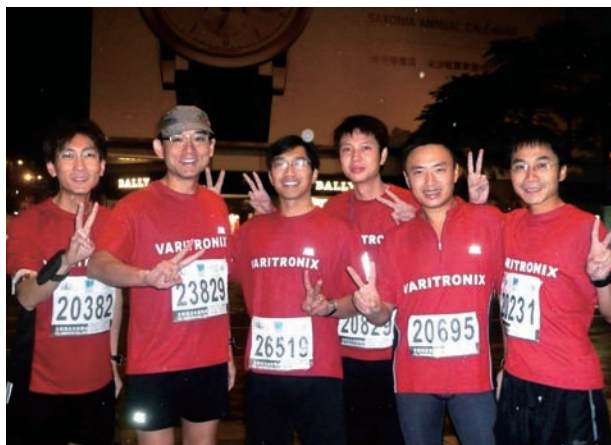
精電之馬拉松(全馬)跑手。