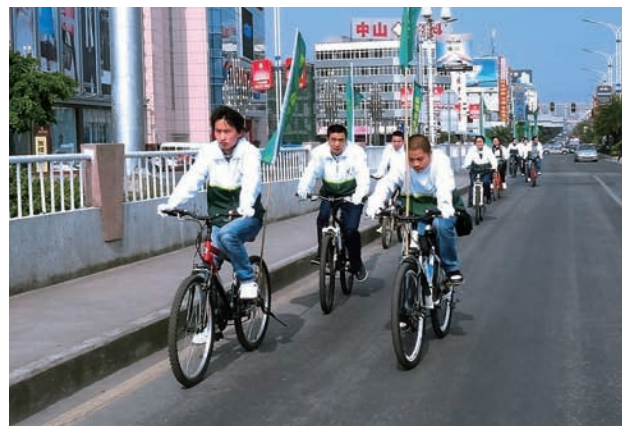
一群生產廠房之同事騎自行車向河源公眾宣揚環保訊息。

在環委會及人力資源部之協作下，我們每年籌辦環保教育活動。2011年，環保教育活動如環保知識問答比賽，環保講座以及植樹活動相繼舉行。我們更