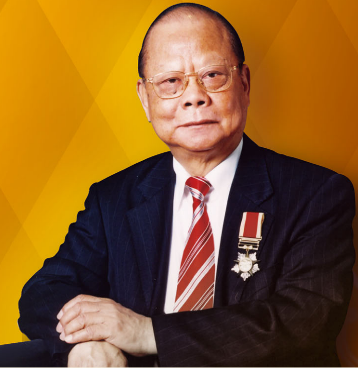
曾憲梓博士 大紫荊勳賢 集團主席