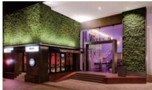
Pullman Bangkok Hotel G –入口