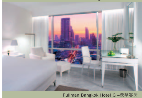
Pullman Bangkok Hotel G –豪華客房

於危機前之水平。為充份利用新收購之曼谷姊妹物業之市場協同效益，Pullman Pattaya Aisawan Resort於今年四月重新塑造為Pullman Pattaya Hotel G。