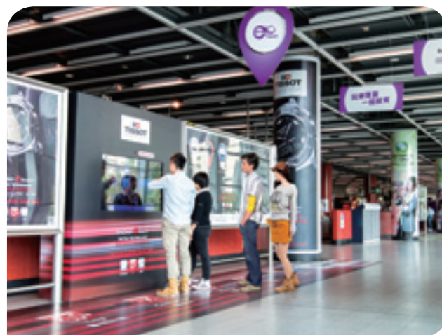
港鐵車站的互動廣告深受乘客歡迎

由於車站商店租金和廣告收入上升，抵銷了電訊服務收入減少的影响，因此香港車站商務於2012年的收入增加7.5%至36.80億港元。香港車站商務的經營成本增加10.9%至3.97億港元，經營利潤上升7.1%至32.83億港元，而經營毛利率則為89.2%。若不包括於2011年及2012年因終止2G電訊服務合約所產生的一次性應收款項，收入上升11.6%，而經營毛利率則為89.1%。