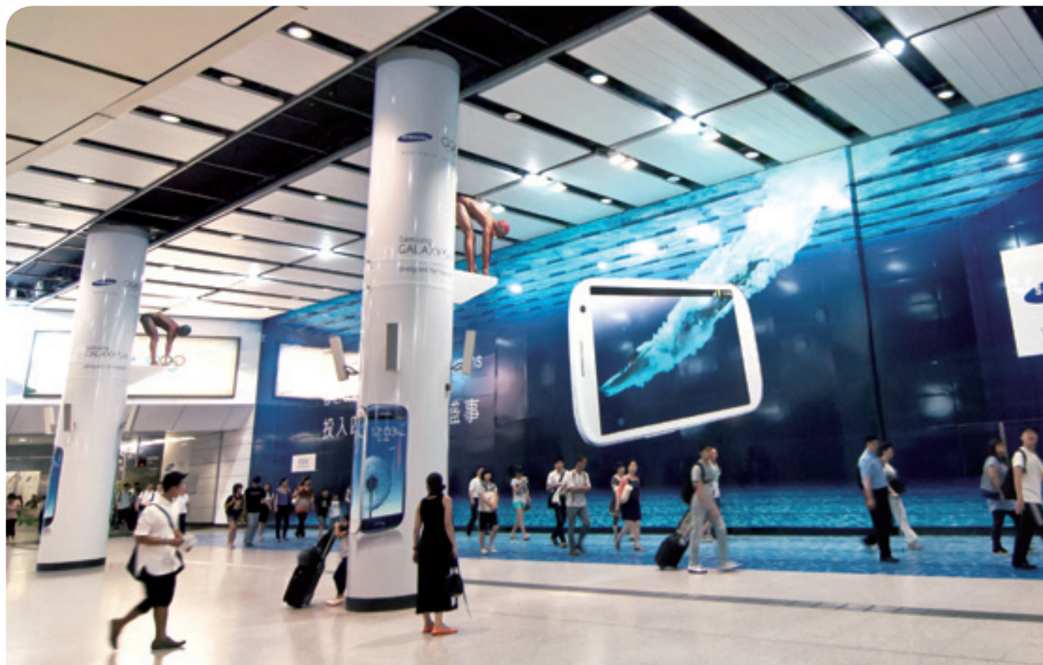
港鐵公司提供全港最具創意的廣告形式

受惠於廣告商戶因香港經濟環境理想而增加開支，我們的廣告收入於2012年增加12.0%至10億港元。而截至2012年年底，我們為廣告商戶合共提供44,651個廣告點，分別有21,081個在車站內和23,570個在列車上。我們繼續推出創新的廣告形式，藉以增加港鐵廣告的吸引力，當中包括在中環站及銅鑼灣站設置數碼屏幕區、在將軍澳站設立「港鐵互動廣告體驗站」，並於2012年12月推出車站內手機購物試驗計劃。港鐵已在沙田站及旺角東站設置等離子電視屏幕圈，將數碼廣告擴展至東鐵綫，並於觀塘綫的列車內引進列車新聞直線服務。此外，我們還推出更多以內地旅客為對象的廣告形式。