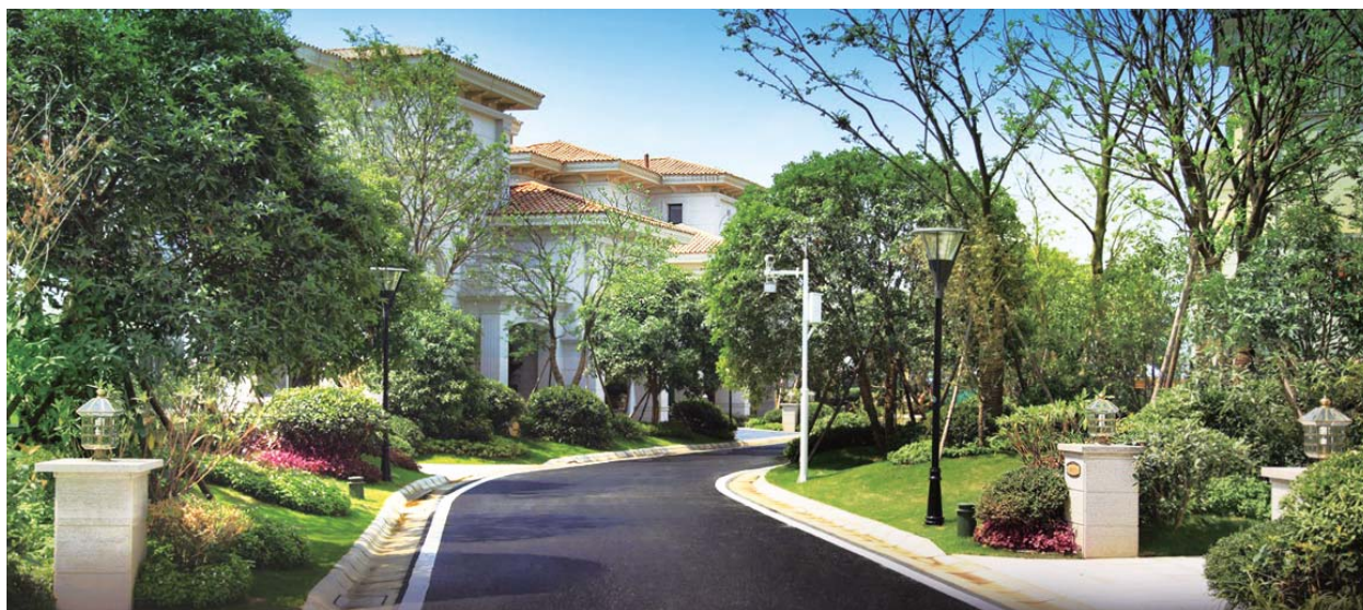
— 碧桂園 • 生態城

於2012年12月31日，本集團擁有約15,337名員工服務於其97家物業管理分公司。本集團銳意繼續向物業買家提供優質的綜合售後物業管理和服務，包括公共安全和公共秩序的協助管理、公共設施保養、公共區域清潔、家居助理、園藝及景觀、區內的穿梭巴士營運和其他客戶服務。本集團以優質的服務在市場上建立了良好的聲譽，例證之一廣東管理公司已獲建設部認定為一級物業管理公司，是中國物業管理公司的最高資質級別。