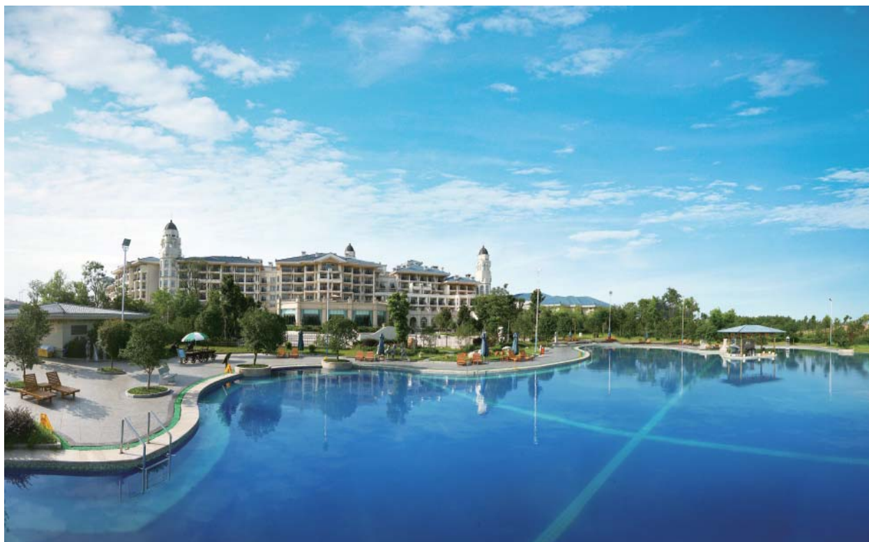
— 安慶碧桂園鳳凰酒店