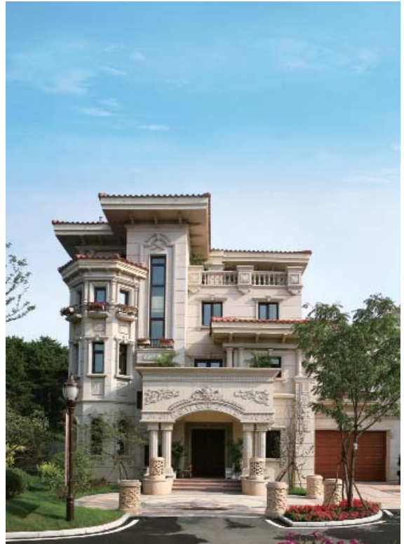
— 碧桂園 • 銀河城

本公司於2012年3月27日委任楊惠妍女士為本公司副主席。楊女士於2005年加入本集團擔任採購部經理，並於2006年12月獲委任為本公司執行董事。楊女士畢業於美國俄亥俄州立大學，獲得市場營銷及物流專業學士學位。楊女士現主要負責參與制定本集團的發展策略。