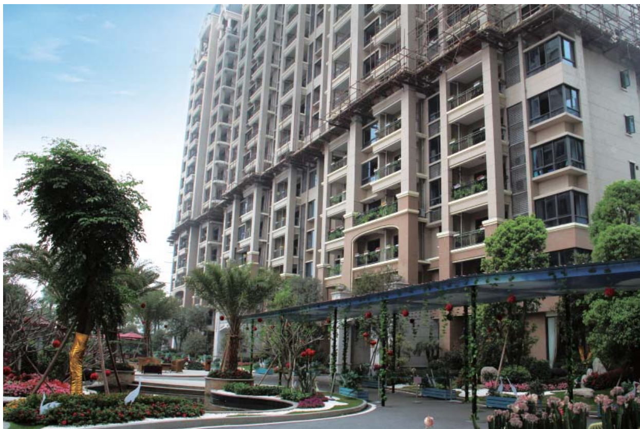
— 碧桂園 • 豪園

僱員的薪酬待遇包括薪金、花紅及其他現金補貼。本公司已訂立每年覆核系統，用以評估僱員的表現，並按此釐定是否增加薪金、花紅及升職。本集團須參與中國地方政府組織的社會保險供款計劃。根據相關國家及地方勞工及社會福利法律及法規，本集團須要代表僱員支付每月社會保險費，以支付養老金保險、醫療保險、失業保險及住房儲備基金。本集團相信僱員所取得的薪金及福利，與市場水準比較具競爭力。僱員並非通過任何工會或集體議價協議來磋商僱用條款。本集團相信其與僱員維持良好的關係。於本公佈刊發日期，並無發生重大勞工糾紛以致對集團經營造成不利影響或有可能造成不利影響。