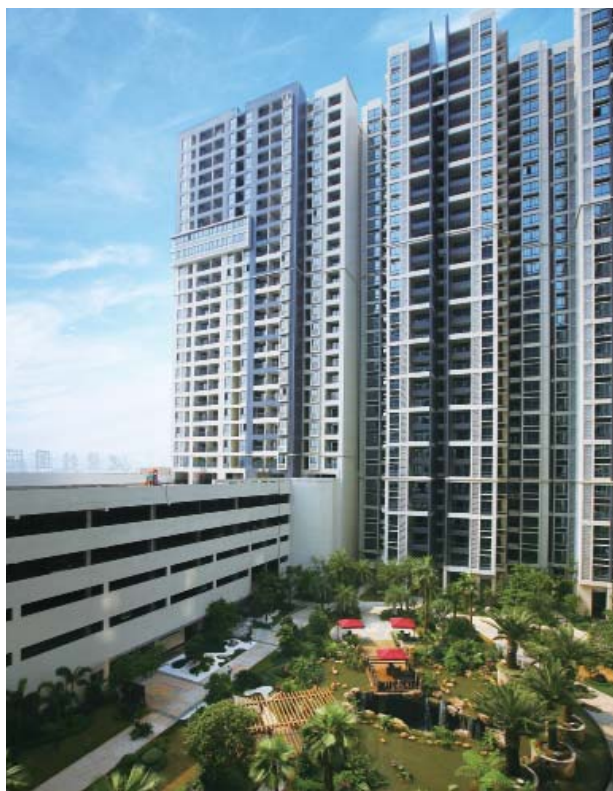
一 碧桂園城市花園

展望未來，碧桂園將繼續專注於一線城市的近郊及經濟發展潛力高的二、三線城市發展配套完善的高質素物業項目。憑藉獨特的競爭優勢，配合國家發展政策，策略性挑選房地產項目位置，以快速開發和卓越的項目執行力，以及貼近市場需求的新穎產品，加快資產週轉率，將本集團成功的商業模式複製至新的經濟高增長地區，成為具有領先地位及品牌知名度高的大型房地產開發商。