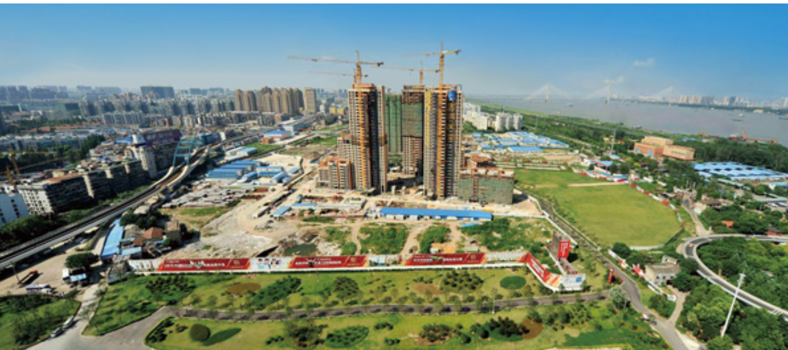
武漢天地施工現場