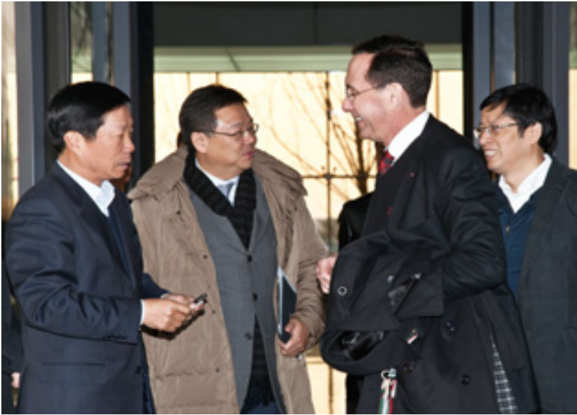
瑞安房地產董事會成員參觀虹橋天地，了解項目進展

政策及財務事宜。董事會已將公司日常營運及行政事務委派予管理層處理。董事會及本公司管理層各自的職能已刊載於本公司網站(請訪問 www.shuionland.com )。董事會將每年對上述職能作出檢討。此外，董事會轄下已設立有關董事委員會，並向該等委員會委以彼等職權範圍載列的不同職責。