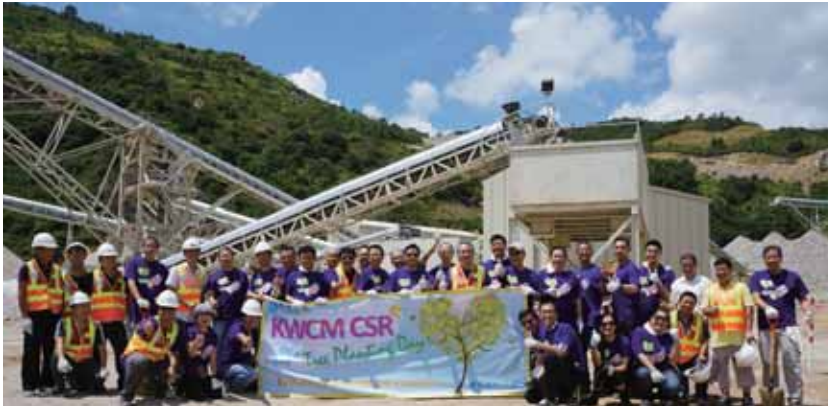
二零一二年惠東礦場植樹日

企業社會責任是建築材料業務可持續發展價值不可或缺的一部分，建築材料業務致力履行作為有愛心及負責任的企業公民，繼續恪守「取諸社會，用諸社會」的企業理念，關懷員工、社區及環境。