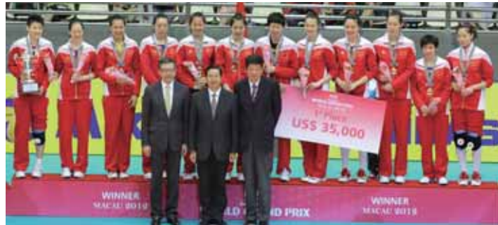
銀娛副主席呂耀東先生、澳門特區政府社會文化司司長張裕先生及國際排球聯合會監督委員會主席祝嘉銘先生頒贈價值35,000美元的支票及冠軍獎盃予中國女排國家隊