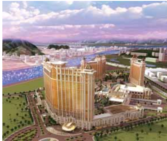
「澳門銀河™」第二期定於2015年中落成

第三及第四期發展規劃已接近完成。銀娛意欲於本年度向政府遞交規劃圖則，並目標於二零一三年底／二零一四年