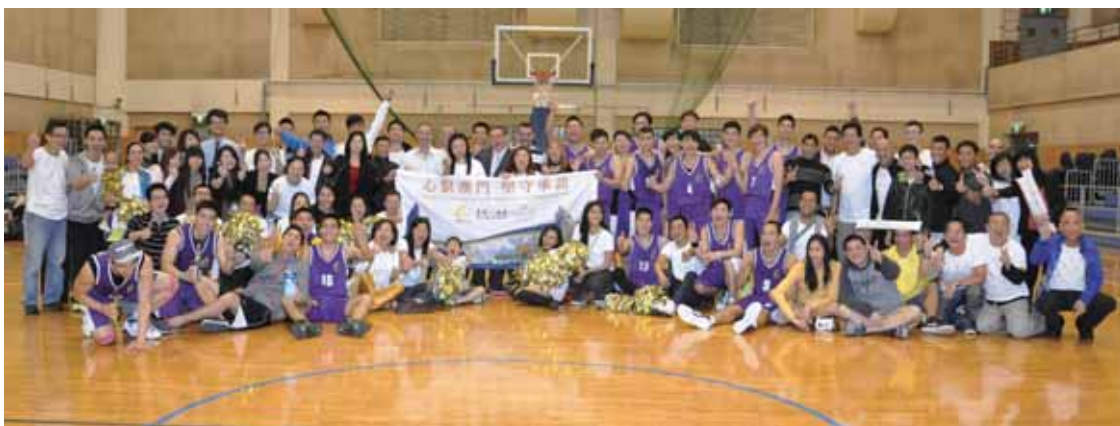
在「第六屆澳門幸運博彩業職工總會博總盃籃球賽」，銀娛籃球隊第二次奪得冠軍