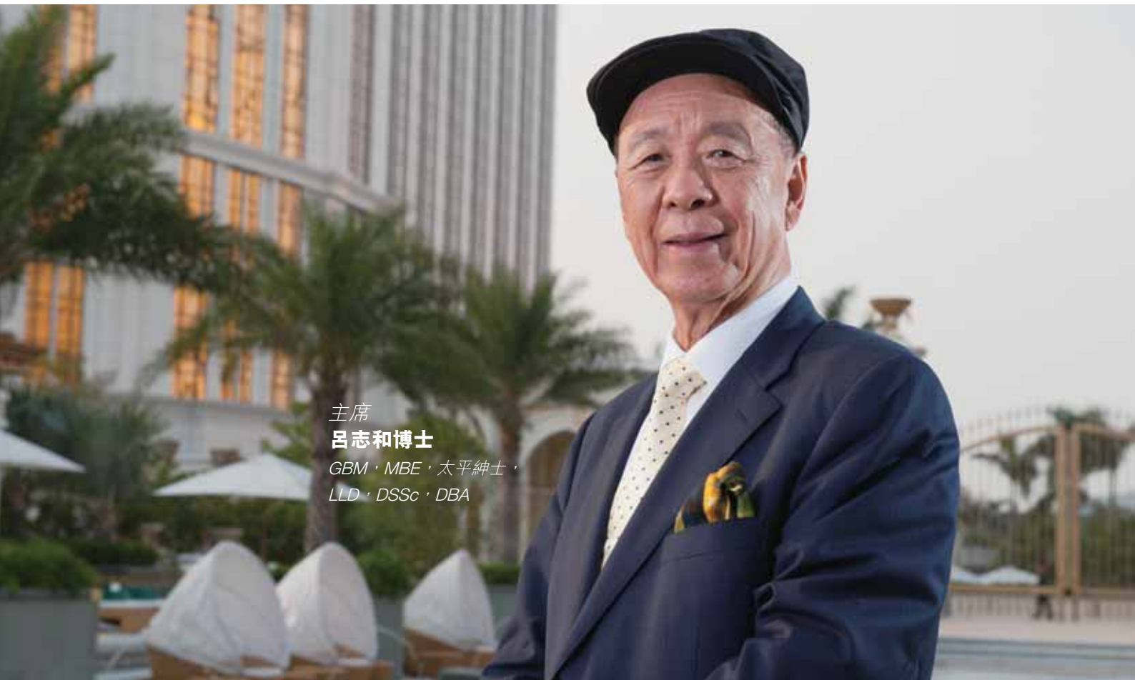
主席 呂志和博士 GBM · MBE · 太平紳士 · LLD · DSSc · DBA