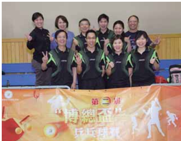
銀娛乒乓球隊在「第二屆澳門幸運博彩業職工總會博總盃乒乓球賽」奪得冠軍