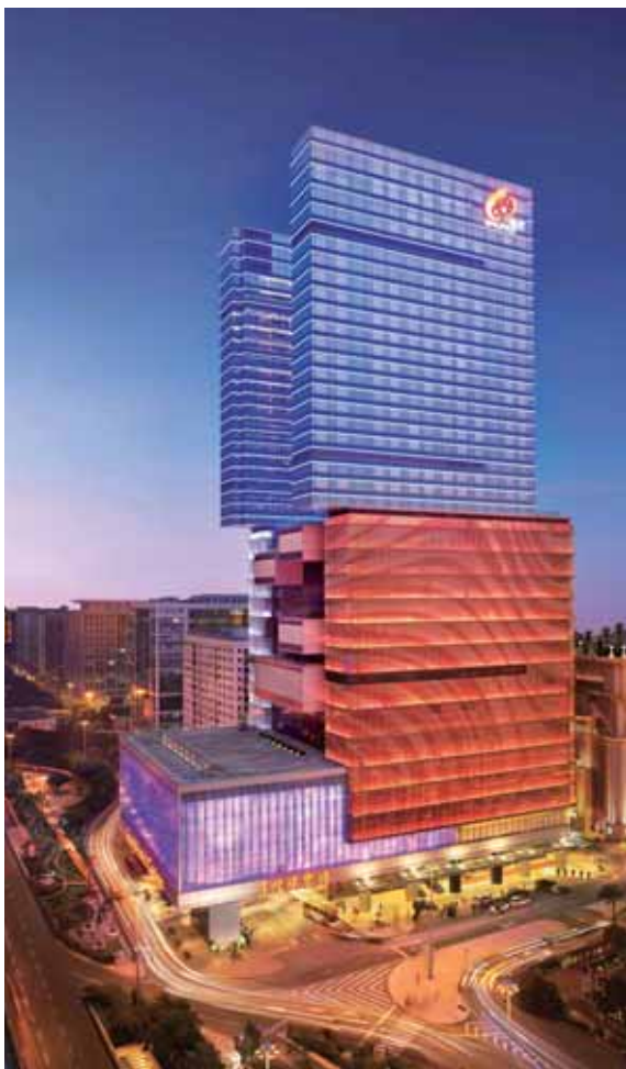
星際酒店及娛樂場

星際酒店屢獲殊榮，自二零零六年開幕以來，已獲得由業界頒授共三十多項獎項。其服務水平一直是行業的典範，加上別樹一格的產品，令物業於二零一二年再次囊括多個獎項，包括「亞洲酒店大獎」的「亞洲最受歡迎優質服務酒店」、「中華傳媒CMN聯合體及港澳自由行組委會」的「最受遊客歡迎一港澳卓越品牌星光獎」及「亞洲酒店業金橄欖獎」的「亞洲十大最具影響力酒店」及「中國最佳賓客體驗酒店」。