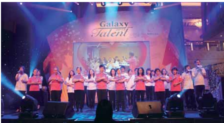
澳門聾人協會會員與銀娛義工隊一同表演手語歌唱項目