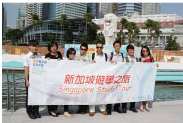
「銀娛青少年成就計劃」的最終得獎者藉此機會踏上新加坡遊學旅程