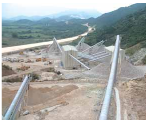
廣東省惠東新礦場

於二零一二年，香港市場對建築材料的需求繼續上升，令建築材料業務的石料、預拌混凝土及瀝青業務的銷量有所增加，對建築材料業務的全年溢利帶來重要貢獻。