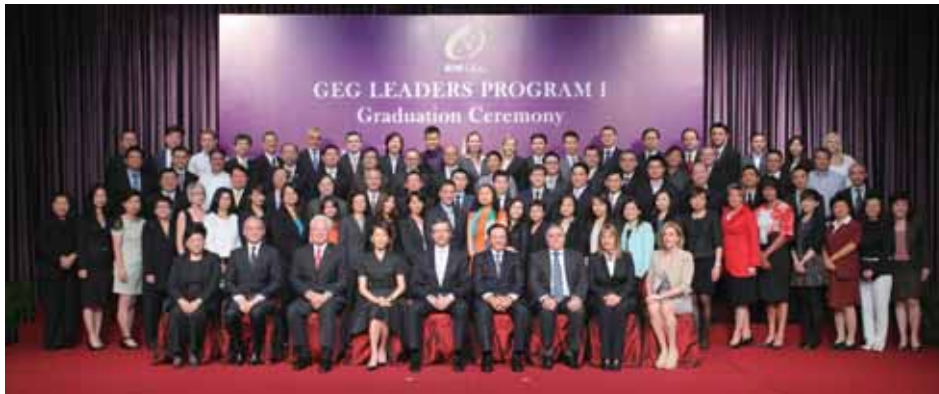
「銀娛領袖培訓計劃」畢業儀式