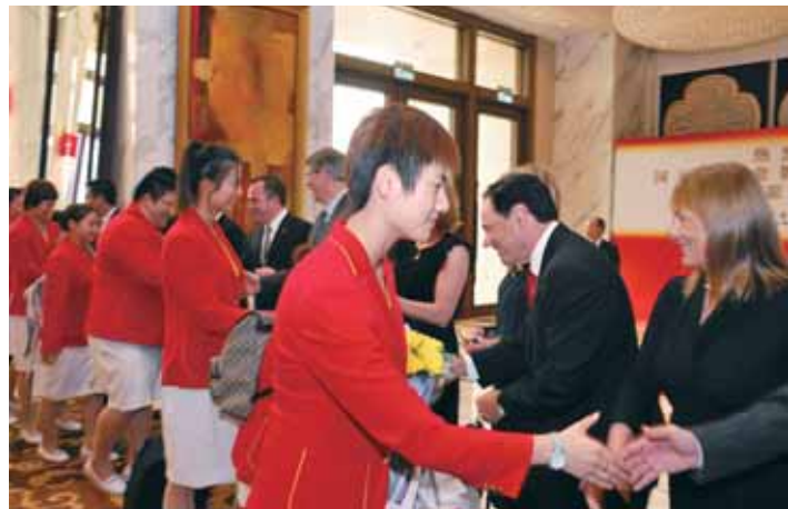
繼二零零八年北京奧運後，銀娛有幸再次款接中國體育健將，在中國出戰倫敦奧運摘金而回的健將訪澳期間提供住宿