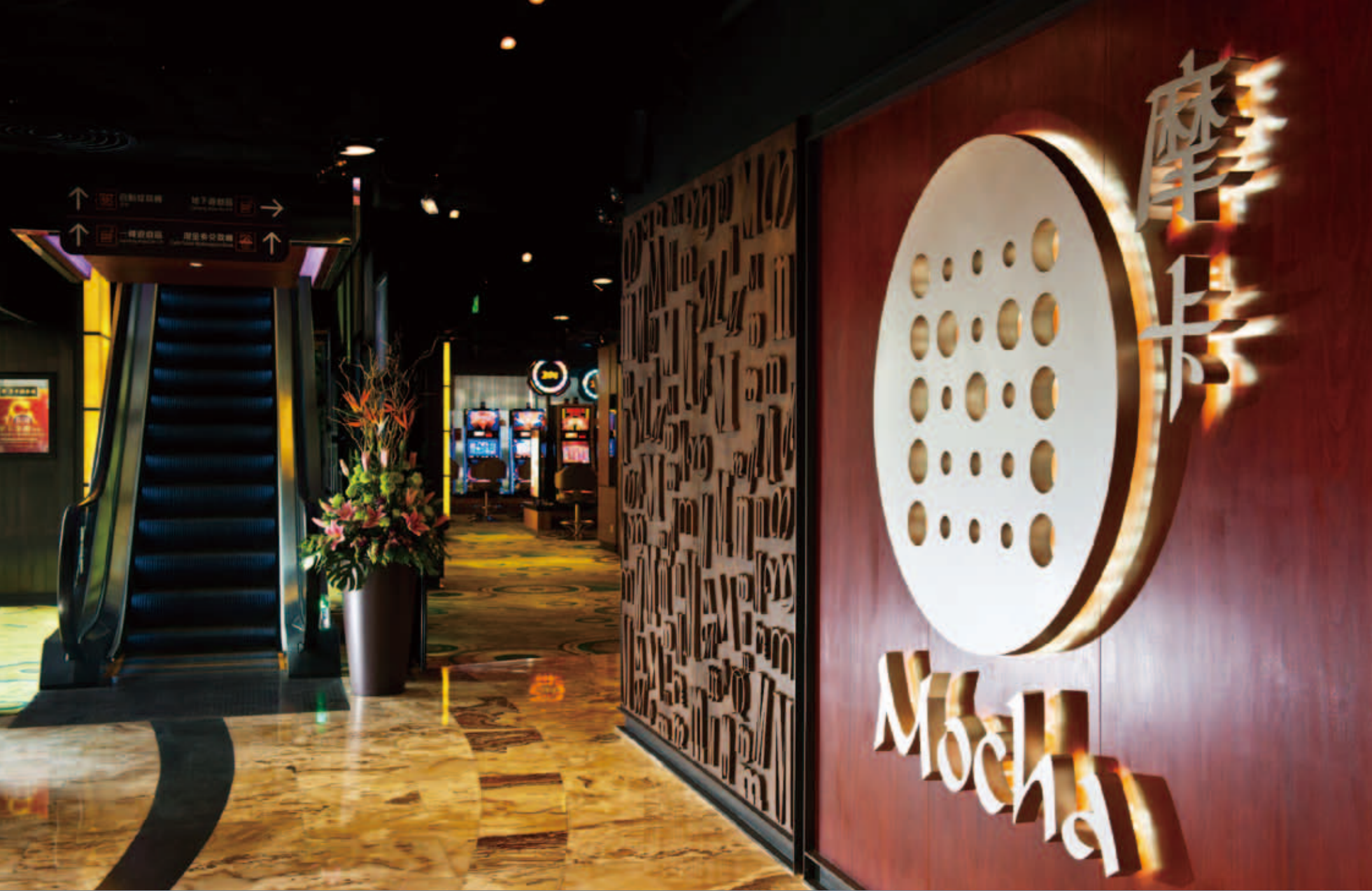
澳門最大型非娛樂場電子博彩機營運商