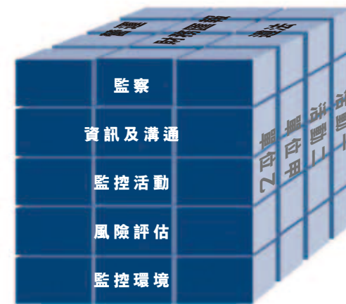
摘錄自《內部監控－綜合架構》，COSO