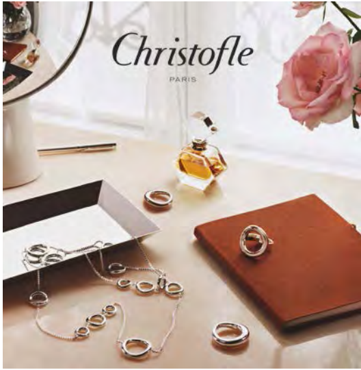
Christofle accessories. 「Christofle」配飾。

本集團正積極尋找新商機，以多方面拓展及擴闊其盈利基礎。憑藉本集團擁有港幣十億零二千一百一十萬元之現金淨額及其強健之經常性收入，本集團有信心定能藉此優勢下充份把握任何合適之投資機會。