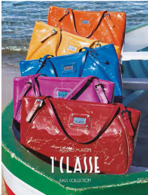
Alviero Martini 1ª Classe handbags. 「Alviero Martini 1ª Classe」手袋。

在中國，於本年度開設了三十五間新店，使零售網絡增加至一百四十五間店鋪。本集團深信於中國之發展潛質，並繼續重點專注其於中國之業務擴展。