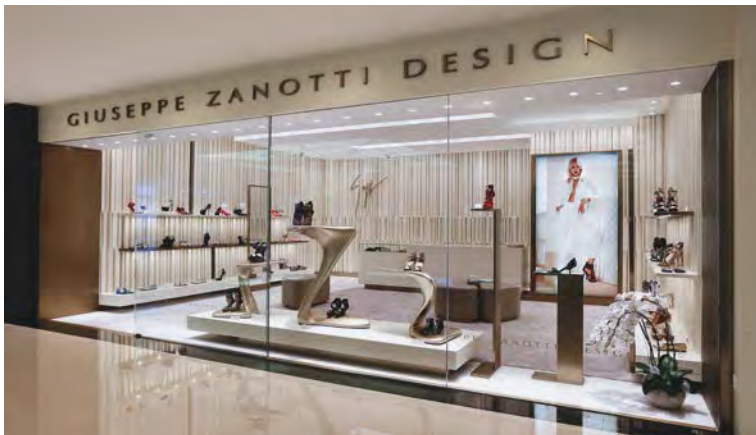
Giuseppe Zanotti Design boutique at Xi'an Zhongda International, Xi'an, China. 位於中國西安市西安中大國際的 「Giuseppe Zanotti Design」精品店。