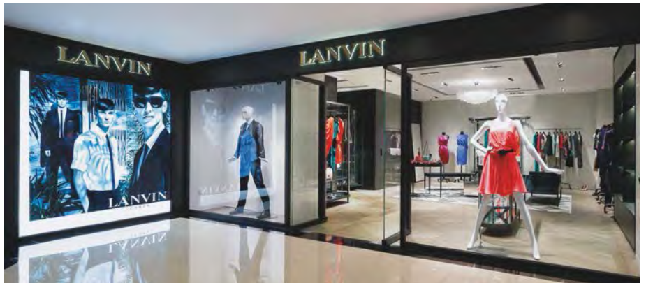
Lanvin boutique at Xi'an Zhongda International, Xi'an, China. 位於中國西安市西安中大國際的「Lanvin」精品店。