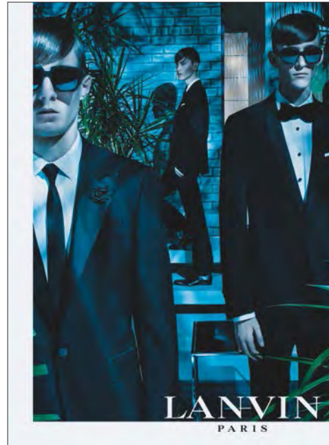
Menswear by Lanvin. 「Lanvin」男士服裝。

本集團於新財政年度之四月份於香港新城市廣場開設了第一間全新之「Brooks Brothers Flatiron」概念店，並已計劃於今財政年度末前多開設十五間新店，包括於香港國際機場開設佔地四千九百平方呎全亞洲最大之「勞力士」(Rolex)店。