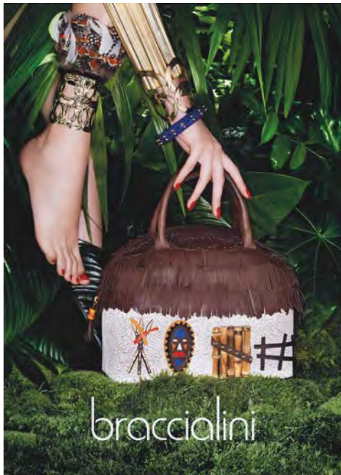
Braccialini handbag. 「Braccialini」手袋。