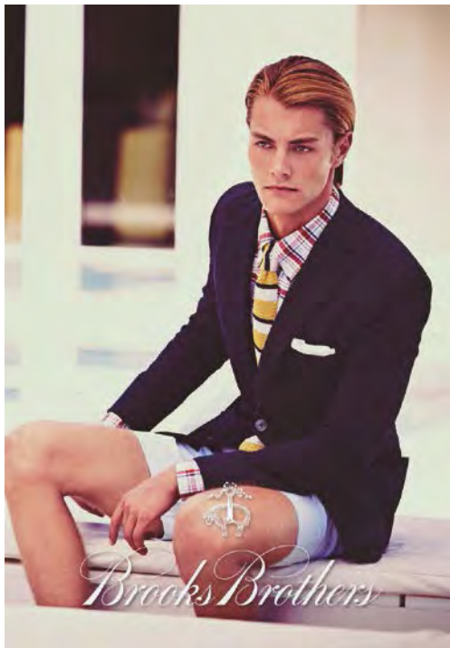
Menswear by Brooks Brothers. 「Brooks Brothers」 男士服裝。