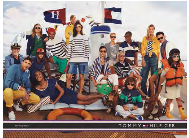
Fashionwear by Tommy Hilfiger. 「Tommy Hilfiger」時裝。

本集團於去年之重大零售投資包括在「The Mira Mall」開設了佔地五千七百平方呎之「Tommy Hilfiger」新旗艦店、於港威商場開設了佔地四千一百平方呎之另一間「Tommy Hilfiger」店，以及於新城市廣場開設了一間佔地六千六百平方呎之「Tommy Hilfiger」雙層店。本集團於香港之百貨店鋪及化妝品業務，包括位於太古廣場及置地廣場之「Harvey Nichols」店、位於朗豪坊之「西武」店，以及「Beauty Bazaar」店，該等店鋪均有強健及超逾預期之表現。本集團將繼續投資於此等有潛力之業務。