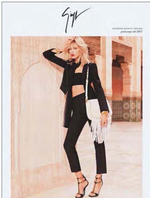
Giuseppe Zanotti Design shoes and leathersgoods. 「Giuseppe Zanotti Design」鞋履及皮具。

在東南亞地區，本集團於台灣台北市三越A9店開設了第二間「勞力士」(Rolex)店，以及於台北101購物中心開設了一間佔地三千八百平方呎之「Tod's」新旗艦店。在台灣，本集團憑藉其擁有遍佈該地主要零售點之八十四間零售店鋪網絡，本集團定能在此優勢下進一步獲取該地顧客之消費。在新加坡，本集團於威士馬廣場開設了一間佔地一千六百平方呎之「迪生鐘錶珠寶」(Dickson Watch & Jewellery)雙層新店，使本集團於新加坡及馬來西亞之零售網絡增加至二十四間店鋪。