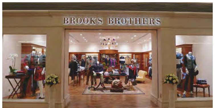
Brooks Brothers boutique at Chongqing International Financial Centre, Chongqing, China. 位於中國重慶市重慶國際金融中心的 「Brooks Brothers」精品店。