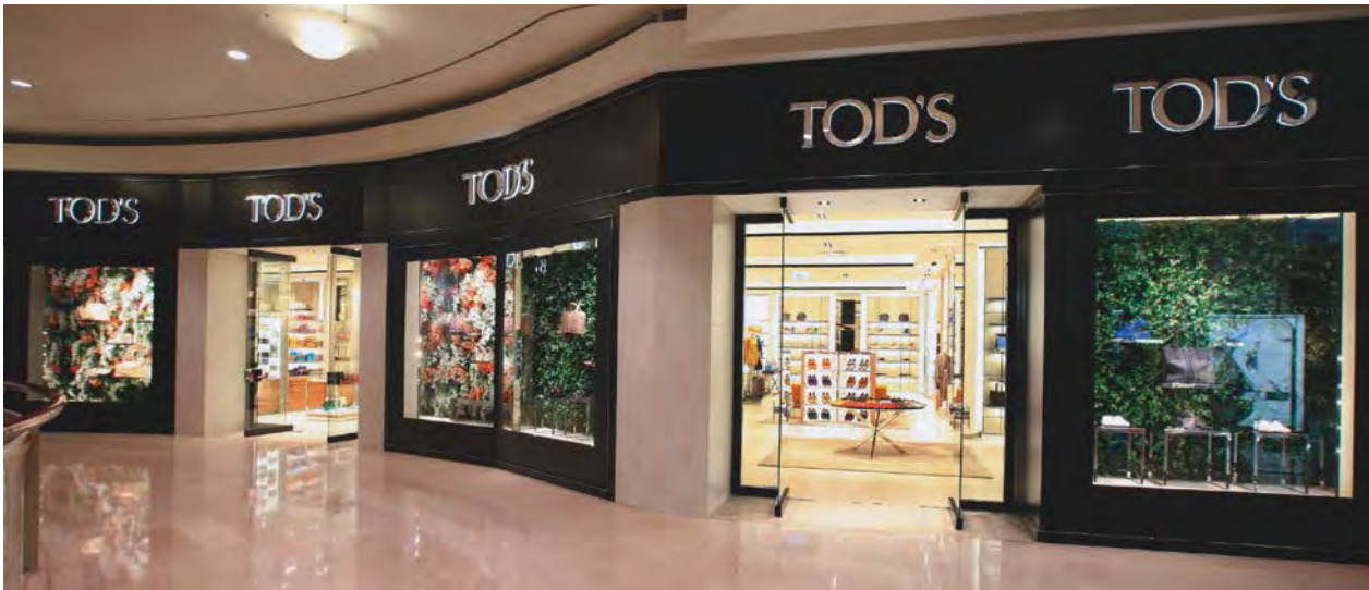
Tod's boutique at Taipei 101 Mall, Taipei, Taiwan. 位於台灣台北市台北101購物中心的 「Tod's」精品店。