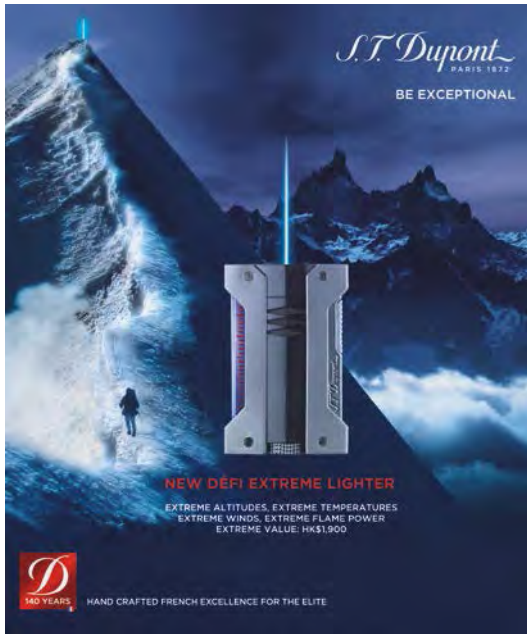
New S.T. Dupont 'Défi Extreme' lighter. 全新的「都彭」 「Défi Extreme」 打火機。