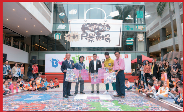
提升後的良景廣場開幕