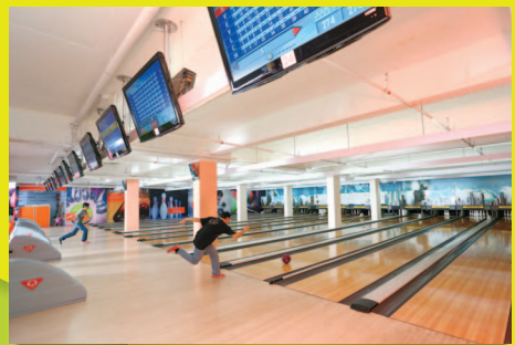
新增保齡球場點綴了社區生活