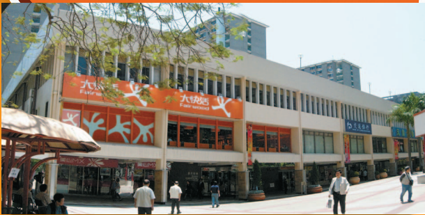
提升前為鄰近學校學生提供的餐飲選擇有限