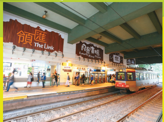
廣場出口直達輕鐵站