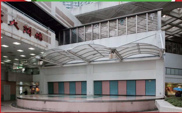
資產提升前的良景廣場