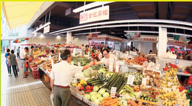
擁有全新面貌及設施的現代街市