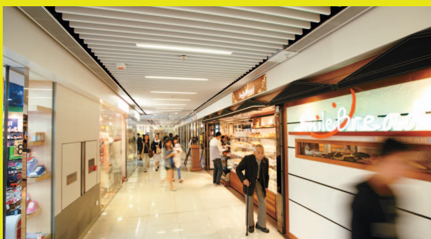
改善後的公用地方環境