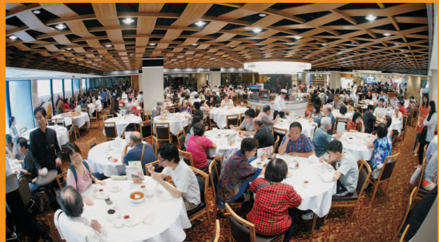
新引入的中式酒樓優化餐飲選擇