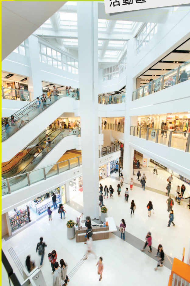
翻新後的中庭利用天窗自然採光