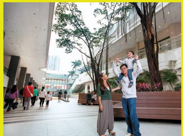
新中央露天庭園提升環境氣氛