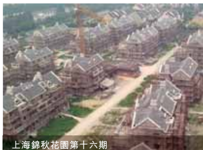
上海錦秋花園第十六期

本集團之上海錦秋花園為城鎮開發項目，已建成及售出約4,000個住宅單位。該發展項目為多元化住宅組合，包括低層住宅、高層住宅及獨立洋房。其中一期項目(即「The Royal Crest」)包括288個低層住宅單位(建築面積約270,000平方呎)，已於年度推出並於二零一三年三月三十一日全部預售。預售總額約為港幣593,000,000元。該發展項目預計於二零一四年財政年度落成。目前，本集團正興建另外1,000個住宅單位及130間洋房(合共建築面積約1,200,000平方呎)，預計將分別於二零一四年及二零一五年財政年度落成。