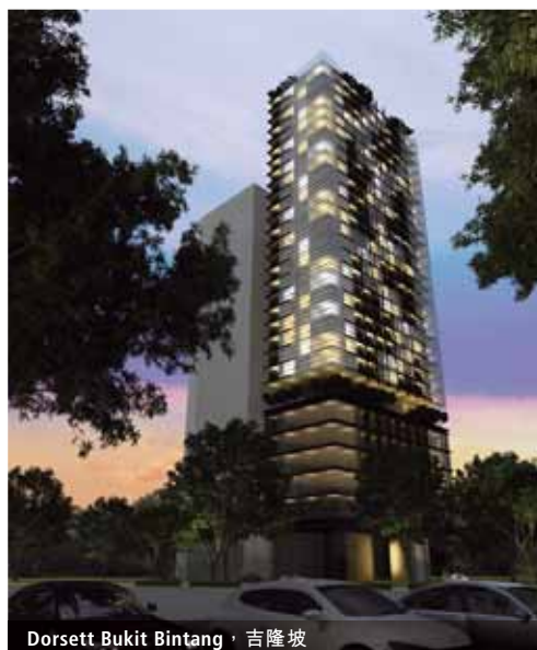
Dorsett Bukit Bintang，吉隆坡

Dorsett Place Waterfront Subang為帝盛與Mayland Valiant各自擁有50%權益的合營企業項目。該發展項目毗鄰位於吉隆坡的Grand Dorsett Subang，由兩棟17層高的公寓大樓組成，擁有約1,989間酒店套房，並設有可提供1,329個停車位的停車場。該發展項目的總建築淨面積約為1,000,000平方呎，於二零一三年三月三十一日的預售額為約港幣678,000,000元，佔該發展項目的總銷售額約30%。