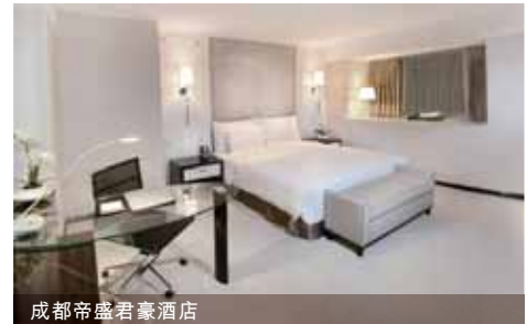
成都帝盛君豪酒店

為配合本集團「華人足跡」策略，於二零一二年十月，本集團透過以代價約14,100,000英鎊(相當於約港幣178,000,000元)收購位於倫敦地下鐵Circle Line及Metropolitan Line交匯站的Aldgate站現為辦公大樓之物業，繼續於英國選定策略地區擴展其酒店版圖。本集團有意將該物業重建命名為「Dorsett City, London」的酒店。