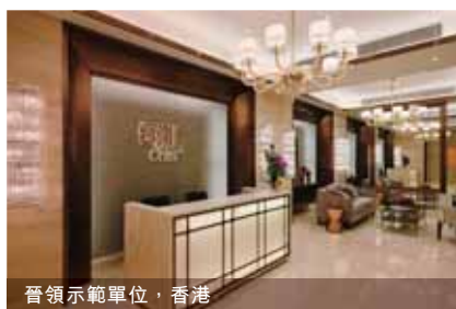
晉領示範單位, 香港