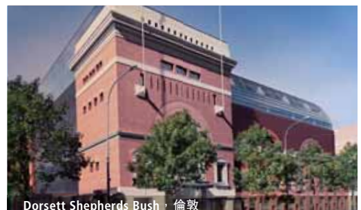
Dorsett Shepherds Bush，倫敦