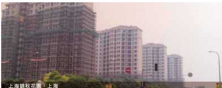
上海錦秋花園，上海

緊接於二零一三年四月成功完成人民幣850,000,000元之5年期債券發行，帝盛處於良好財務狀況可於其發展項目添加新房間量。其正在積極尋找新機遇並以選擇性及審慎的方式開發新項目。帝盛預計將繼續為本集團業績的重要貢獻者。