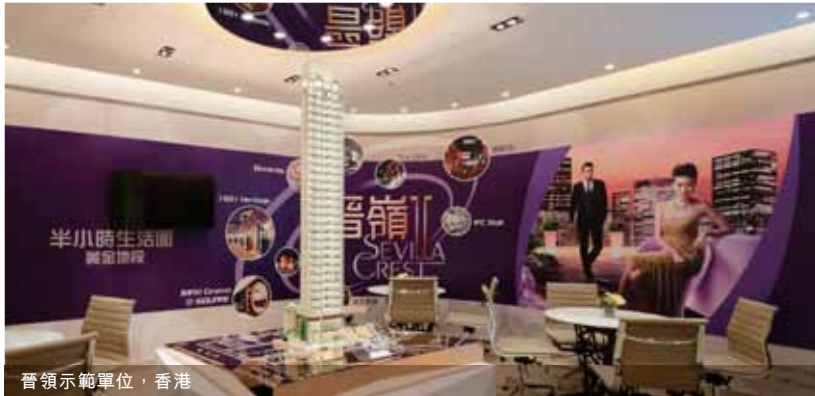
晉嶺示範單位，香港