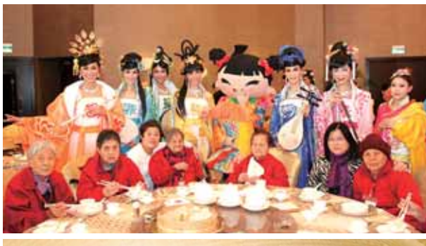
與120名來自澳門明愛屬下六間安老及復康院舍的長者舉行迎春午宴。