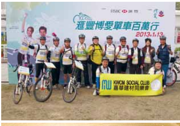
建築材料業務參與「滙豐博愛單車百萬行2013」。

建築材料業務連續十年榮獲香港社會服務聯會頒授「商界展關懷」標誌，表揚其長期服務香港社區作出的努力。