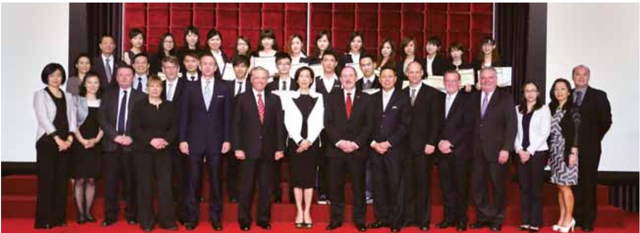
銀娛管理層連同各院校代表出席感謝狀頒授典禮，向實習生送上祝賀。