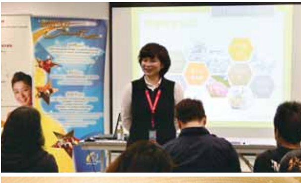
邀請了澳門聖公會樂天倫賭博輔導暨健康家庭服務中心的專業人士為員工主講《問題賭博認識及處理》研討會。