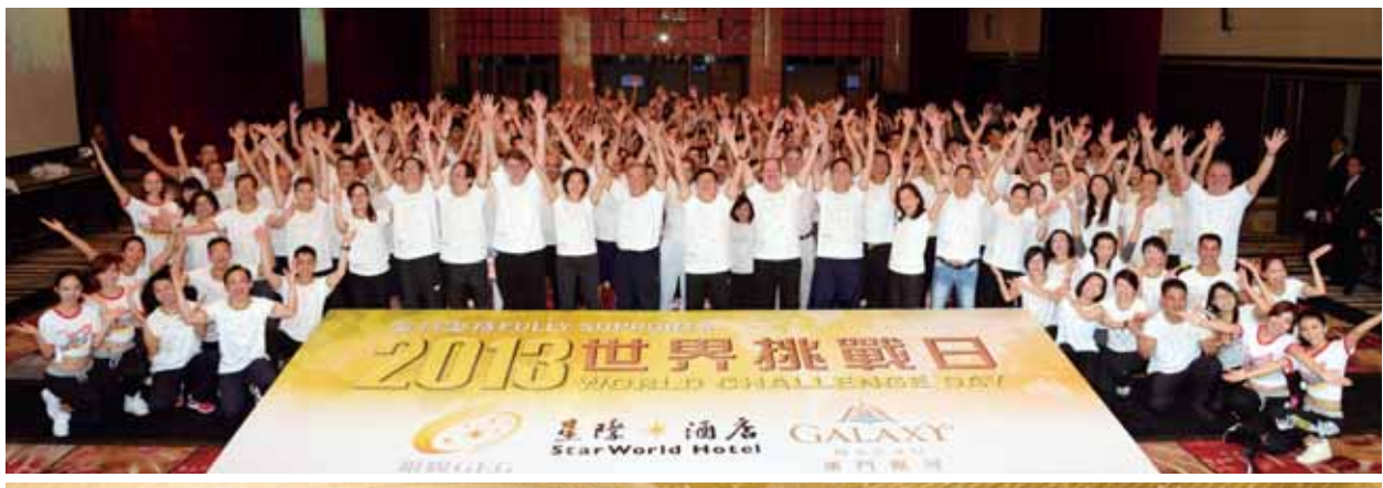
逾200名銀娛員工參與「2013世界挑戰日」活動。