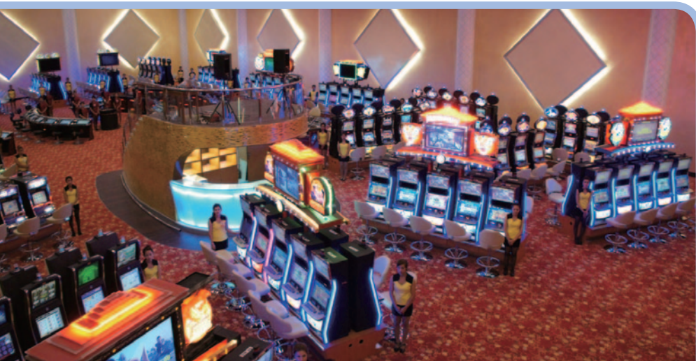
EGT旗下的Dreamworld Club於2013年5月在柬埔寨正式開業

博彩市場。EGT的博彩籌碼及飾板籌碼於回顧期間錄得1,600,000美元的收益。憑藉更先進及多元化的產品項目、良好的客戶關係及精簡的營運架構，EGT的博彩產品將對其長期盈利作出顯著貢獻。