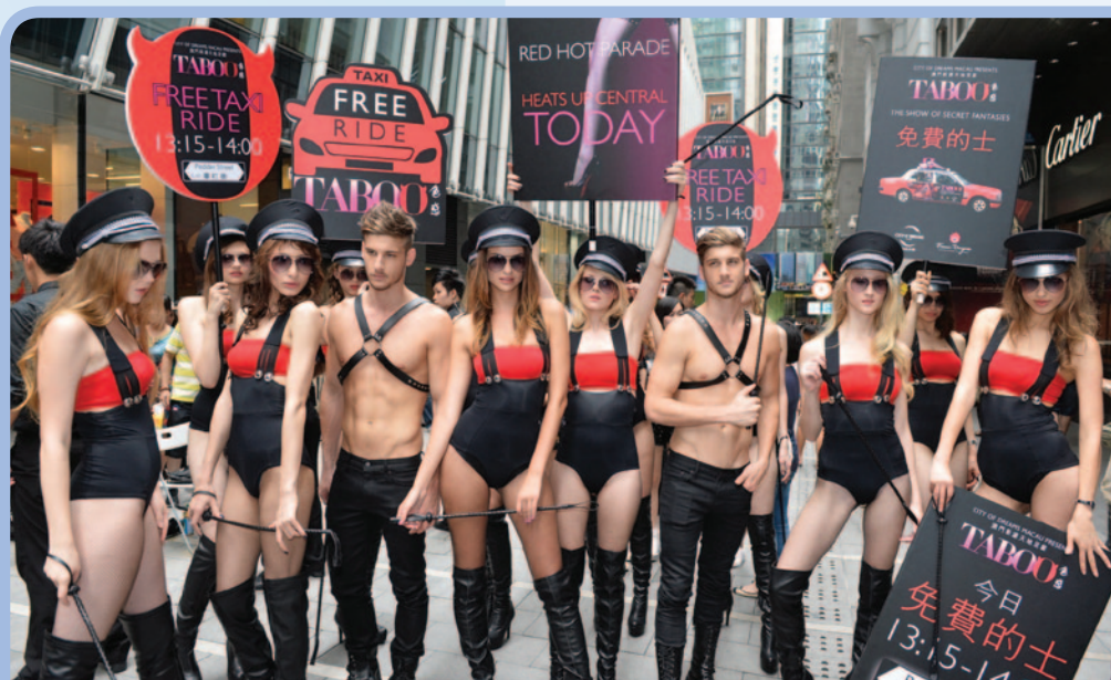
新濠天地與佛朗哥·德拉戈攜手呈獻加入嶄新元素的華麗聲色匯演《TABOO色惑》

新濠一直努力不懈地評估將其業務版圖拓展至澳門以外地區各個商機，冀望將其成功經驗延伸至其他亞洲及歐亞市場。EGT旗下位於鄰近泰國邊境的波別市的Dreamworld Club於二零一三年五月開業，深受客戶歡迎。另外，新濠對新濠博亞娛樂的馬尼拉綜合度假村發展項目充滿信心。該項目正按計劃地順利進行，預計於二零一四年中開業後，將成為亞洲其中一項最引人注目的消閒娛樂設施。新濠將延續新濠天地的經營理念，並充分利用集團推出迎合亞洲文化、口味和喜好的超凡娛樂體驗的豐富經驗，力求將最出色的多元化娛樂元素帶到馬尼拉。