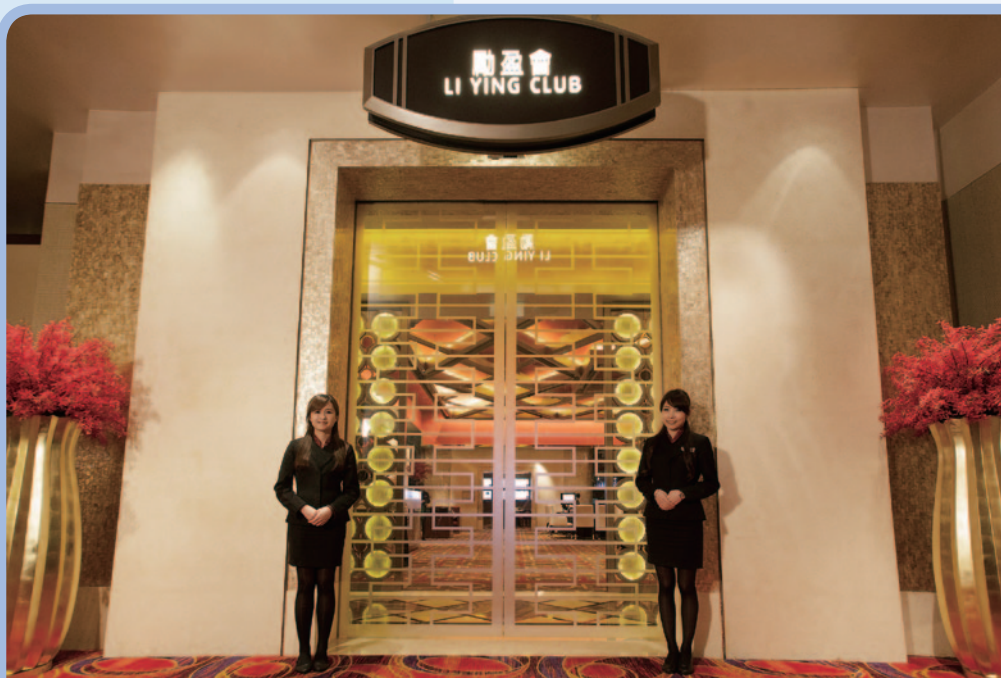
貴賓廳設有世界級博彩設施，提供非一般的個人化尊享服務