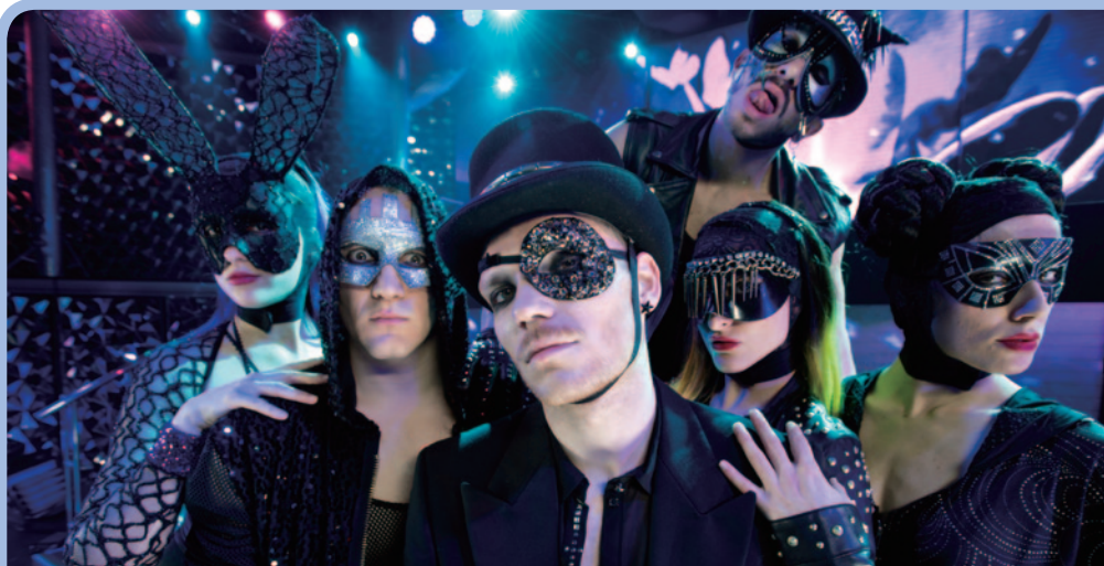
話題之作《TABOO色惑》在新濠天地載譽上演

加其屬意的慈善活動。新濠對社區的支持亦廣獲各界嘉許，並於「義工運動」計劃中獲頒發二零一二年企業義務工作嘉許銅狀。