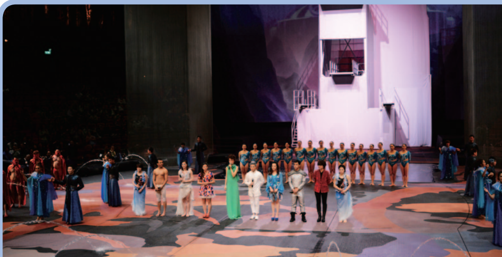
大型綜合匯演《非凡之旅》邀請到中國奧運金牌跳水隊、北京花樣游泳隊和著名流行歌手同台獻技