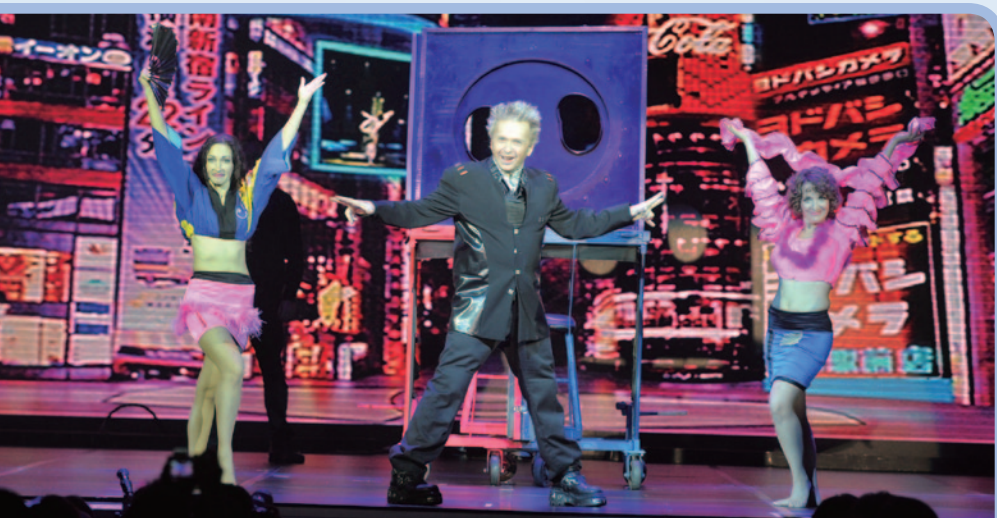
澳門新濠天地獨家呈獻魔術大師法蘭茲·哈拉瑞在澳門的盛大演出

本集團亦不斷開拓在不同新興市場的增長商機，以提升股東價值及商業前景。新濠將伙拍凱升控股有限公司(「凱升」)投資於太平洋沿海岸參歲的一個娛樂場項目，共同開拓潛力豐厚的俄羅斯博彩市場。此綜合娛樂場度假村項目預期將於二零一四年九月或前後開業。管理層深信，這些新發展項目將有助本集團把其在澳門呈獻的嶄新世界級娛樂體驗，延伸至其他亞洲市場，實踐為股東創造最高的長線回報的策略。