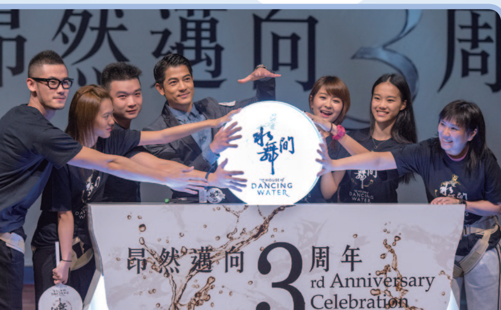
澳門地標式娛樂鉅著《水舞間》昂然邁向三周年，至今已成功吸引超過二百萬名觀眾慕名觀賞

隨著澳門有更多博彩及非博彩設施的發展，包括預期路氹區內新建綜合度假村的供應，以及亞洲區內其他博彩市場最近以至未來的擴張，澳門博彩市場的競爭已變得更加激烈。然而，旅客對亞洲市場的殷切需求及更完善的運輸和基礎設施，將為新濠的持續增長增添強大動力。與此同時，新濠亦積極提高業務的整體表現。本集團一直致力其優化博彩桌效益及盈利能力，推動收益持續增長，此策略於二零一三年首六個月已取得顯著成果。新濠將繼續鞏固其旗艦項目新濠天地作為雄踞澳門的高注碼及高端市場的娛樂場的地位，以及保持其在中場收益的領先優勢。