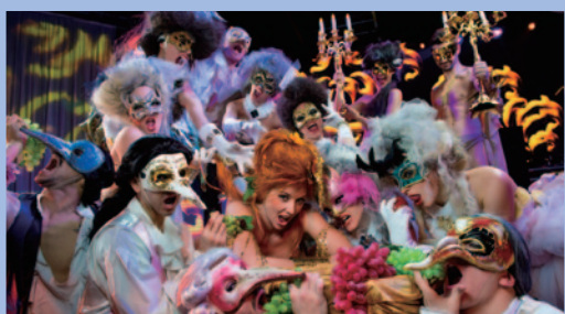
新濠博亞娛樂旗下位於澳門路氹城的旗艦綜合娛樂度假村新濠天地致力為澳門提供獨一無二的世界級娛樂體驗，包括《水舞間》及《TABOO色惑》