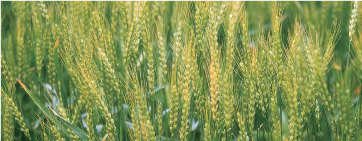
小麥訂單農業種植基地

本公司是中國最大的小麥加工商之一，銷售產品包括普通麵粉和專用麵粉、乾麵及麵包等產品，產品主要以「香雪」和「福臨門」品牌銷售。