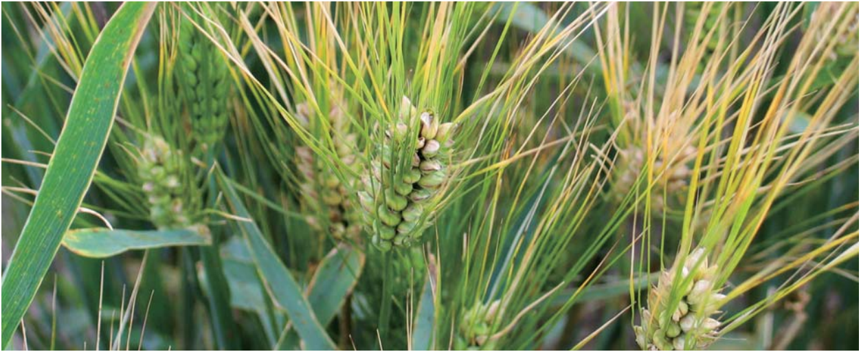
內蒙古呼倫貝爾大麥產地

本公司是中國領先的啤酒原料供應商，從事麥芽生產及銷售。本公司的麥芽主要內銷及出口至東南亞地區。