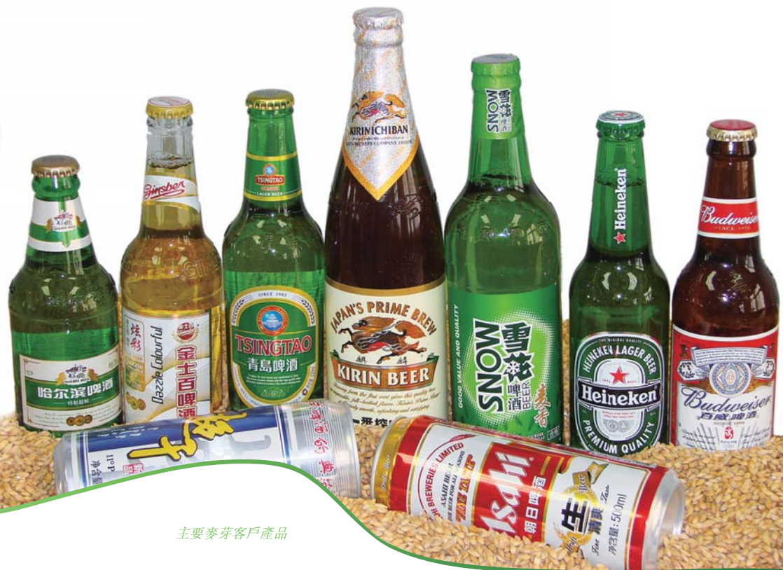
主要麥芽客戶產品

展望下半年，夏季是啤酒消費旺季，隨著各啤酒生產商的庫存逐步消化，將為麥芽帶來新的需求。本公司將加強對行情判斷，提升原料的掌控能力，確保穩定供貨，同時積極研發和創新，提高產品附加值，優化產品結構，提升客戶服務水平，鞏固及擴大市場份額。