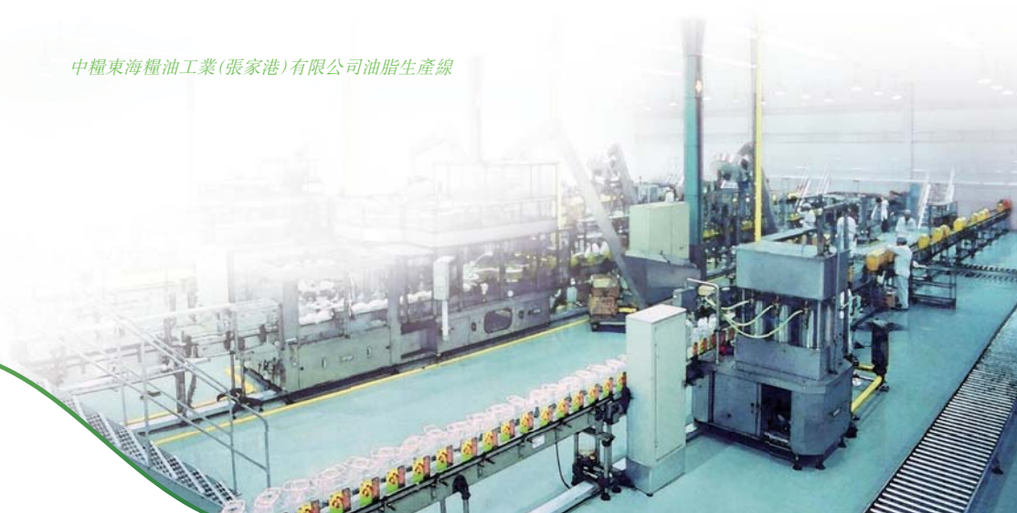
中糧東海糧油工業(張家港)有限公司油脂生產線

展望下半年，預計中國經濟增速溫和回升，城鎮化拉動內需消費增長為必然趨勢，同時下半年是植物油及油籽粕的傳統消費旺季，這些因素均將有利於產品銷售。考慮到生豬存欄水平較高導致的剛性需求仍在，而且肉雞需求隨禽流感影響的消退正快速反彈，加之水產養殖行業的快速發展，油籽粕類產品需求仍有增長空間。然而，全球經濟環境仍存波動風險，國內油籽加工行業競爭依然激烈，本公司將密切關注市場行情，運用套期保值，秉持自身在採購、加工、銷售、風險控制各環節中的高效管控，保證油籽加工業務的有序、平穩經營。同時積極優化產品結構、推廣品牌形象、深化渠道建設，通過研發提高產品的競爭能力，持續鞏固行業領先地位。