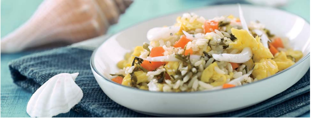
「福临门」大米產品烹調的健康米飯

異，積極發揮從事國際貿易的經驗和優勢，以較具競爭力的成本進口了國際優質大米，補充了業務需求。銷售方面，本公司積極順應大米消費趨勢的變化，迎合包裝米市場的快速增長，繼續加強小包裝米業務開發力度。通過聚焦「福临门」品牌推廣，優化產品結構，提升高利潤空間產品的銷售佔比，以拉動包裝大米產品的溢價能力和市場地位。根據AC尼爾森2013年1-6月對全國大賣場小包裝米的市場調研，本公司的大米產品市場佔有率約為14%，銷量份額穩居全國前列。同時，憑藉工廠區域平台及進口米渠道的優勢，本公司繼續鞏固和開發大型餐飲、食品加工及酒類釀造等客戶，豐富銷售渠道，並積極研製新產品，有針對性的提升產品競爭力以更好的滿足客戶需求。