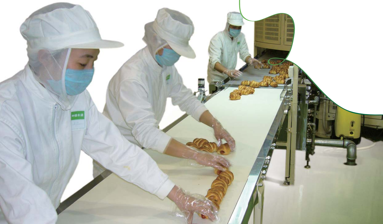
中糧豐通(北京)食品有限公司麵包生產線

展望未來，乾麵行業將快速發展，麵粉市場規模亦會穩定增長。下半年，本公司將更加緊貼市場動向，提升銷售效率，促使新增產能快速釋放，實現規模經營效益。同時繼續發揮麵粉與下游產業的資源分享優勢，加大對乾麵及麵包產品的投入，持續創新產品，以滿足消費者不斷升級的需求，鞏固及擴大市場領先地位。