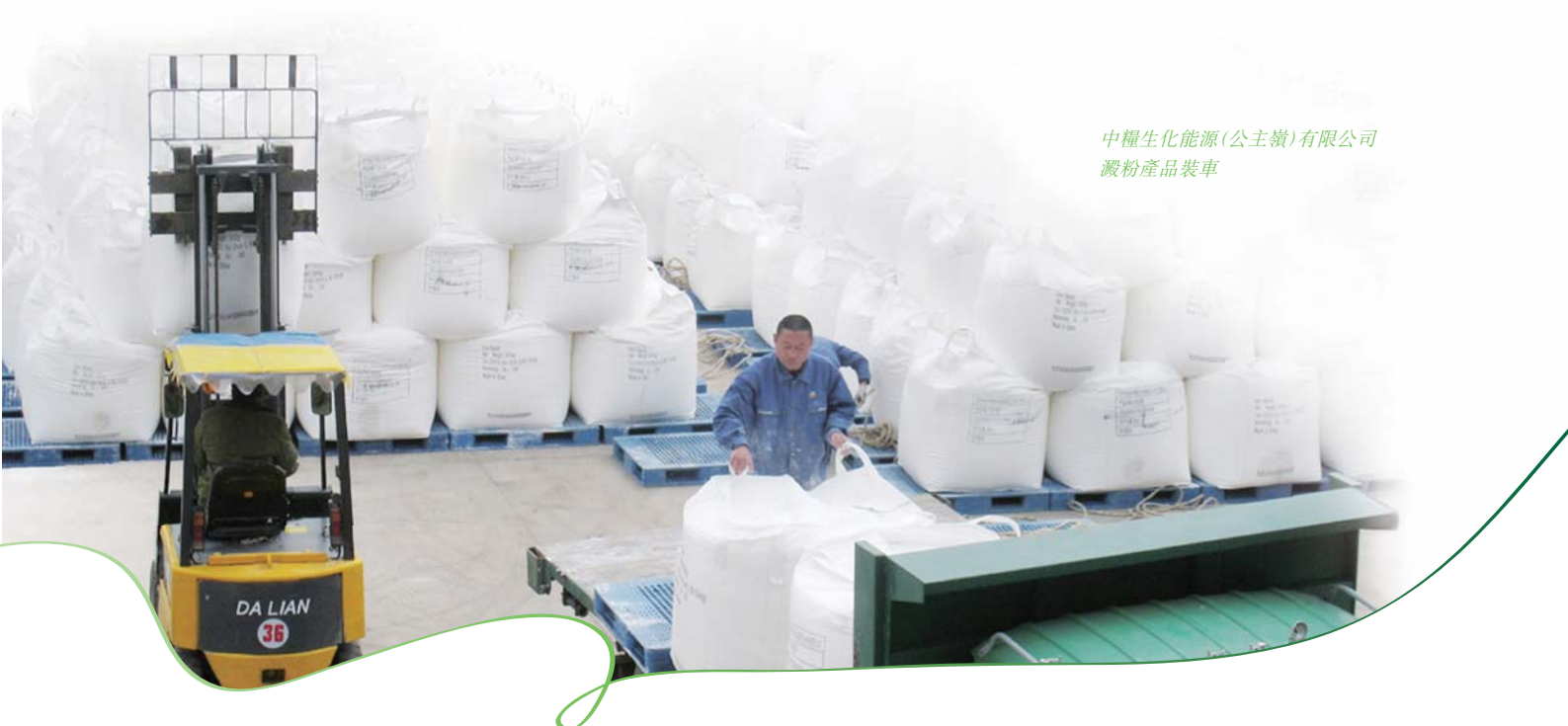
中糧生化能源(公主嶺)有限公司 澱粉產品裝車

展望下半年，本公司將透過全面推進降本增效的工作，致力節能降耗，嚴控銷售及財務費用，同時積極開拓市場及客戶資源，提升業務的盈利能力和市場地位。此外，本公司將持續進行技術研發，為市場提供更高品質的產品，並根據國家對非糧燃料乙醇的推進指引，積極參與有關項目的建設，為推動可再生綠色能源做出貢獻。