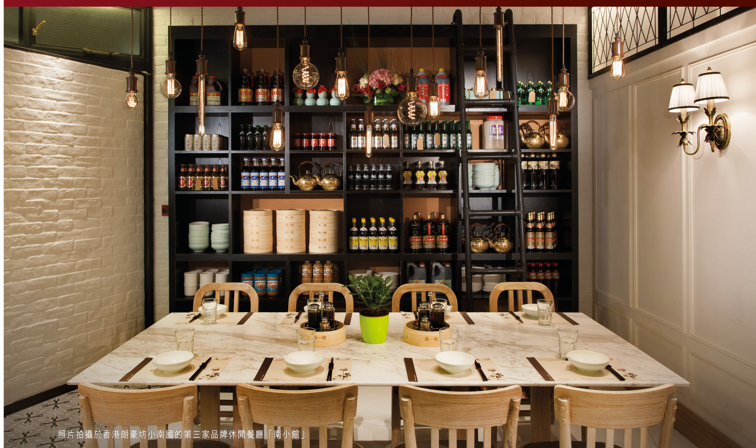
照片拍攝於香港朗豪坊小南國的第三家品牌休閒餐廳「南小館」

Xiao Nan Guo Restaurants Holdings Limited 小南國餐飲控股有限公司