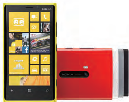
NOKIA Lumia 920