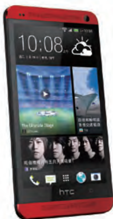
HTC New One

回顧年內，本集團增加為期5至10年之長期借貸，以把握美國國債收益率處於歷史低位之機遇。該等借貸使本集團於日後可靈活地以低廉融資之成本對頻譜及網絡基建進行投資。