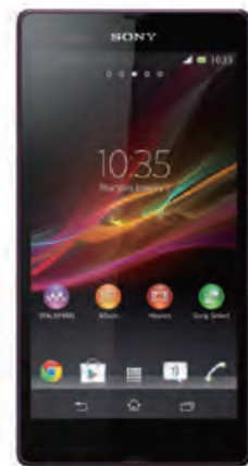
SONY Xperia Z