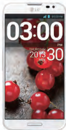
LG OptimusG Pro

本集團受規定須安排銀行為其開立履約保證及信用證。本集團以銀行存款作為該等工具之部分或全部抵押品，以減低發行成本。