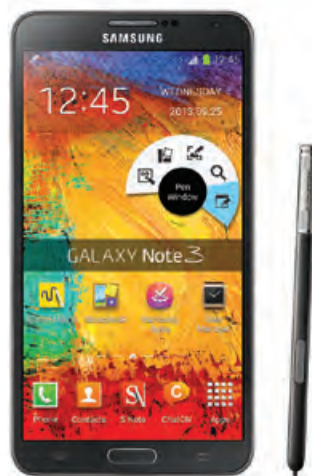
SAMSUNG GALAXY Note 3