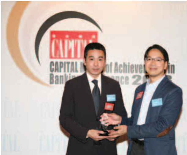
資本卓越銀行及金融大獎2013

儘管投資者對首次公開招股的投資意欲偏軟，本集團的企業融資分部收入上升至11,200,000港元(二零一二年：11,100,000港元)，佔總收入之2.6%(二零一二年：4.9%)。於二零一三年八月，本集團成功保薦伽瑪物流集團於聯交所創業板上市。