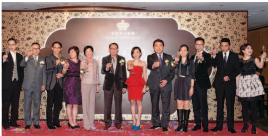
2013年英皇證券集團春茗

於本年度本集團表現出色，各分部之收入均錄得增長。於本年度，本集團的收入大幅增加94.3%至434,800,000港元(二零一二年：223,800,000港元)。該增加乃主要由於貸款分部及配售與包銷分部的收入大幅增加所致。本公司擁有人應佔之本年度溢利增加至155,700,000港元(二零一二年：63,400,000港元)。若撇除一項應收貸款之撥備8,000,000港元(二零一二年：12,000,000港元)，本集團經調整之純利顯著增加117.1%至163,700,000港元(二零一二年：75,400,000港元)，經調整之純利率為37.7%(二零一二年：33.7%)。經調整之每股基本盈利為6.3港仙(二零一二年：2.9港仙)。本集團建議派發末期股息每股1.30港仙(二零一二年：0.38港仙)。連同中期股息每股0.50港仙，本年度的每股派息總額為1.80港仙(二零一二年：0.76港仙)。