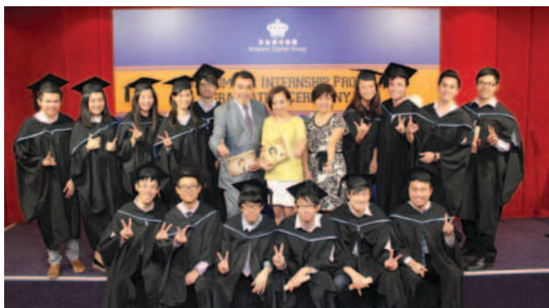
2013年大學生暑期實習計劃