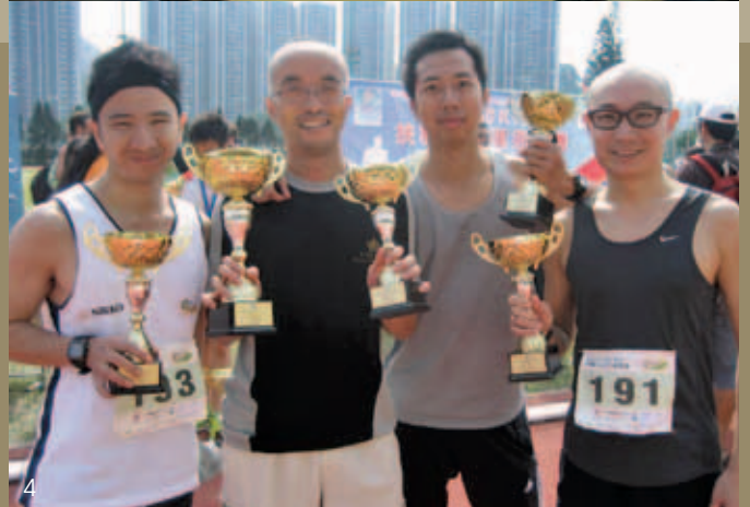
1) & 2) 哈爾濱義工之旅 3) 協康會港島賣旗日 4) 扶輪社十公里挑戰賽2012