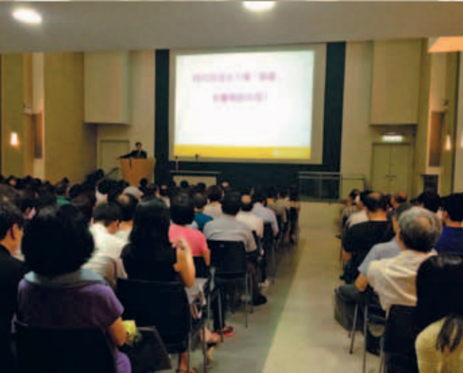
與香港交易所聯辦之股票期權講座