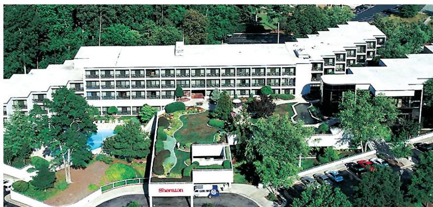
Sheraton Chapel Hill, Chapel Hill, NC, USA

Source為酒店提供採購服務，致力降低酒店之經營費用。Source為酒店從業員訂立大量全國賬戶協議，滿足餐飲、房間管理、工程及能源、行政、裝修與傢俬及設備等特定範疇所需，以節省成本。