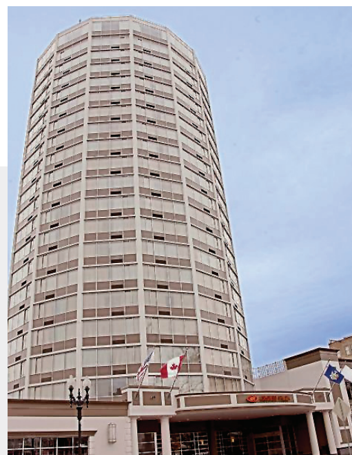
Crowne Plaza Syracuse Hotel, Syracuse, NY, USA

於本集團之共同經營業務 Sheraton Chapel Hill Hotel 再融資後，本集團從借貸獲取所得款項淨額 32,800,000 港元。於二零一三年財政年度支付之銀行利息總額為 900,000 港元。本集團從該次再融資活動獲得約 44,600,000 港元之現金回報並存放於銀行存款，到期日為三個月以上，以賺取更高利息。