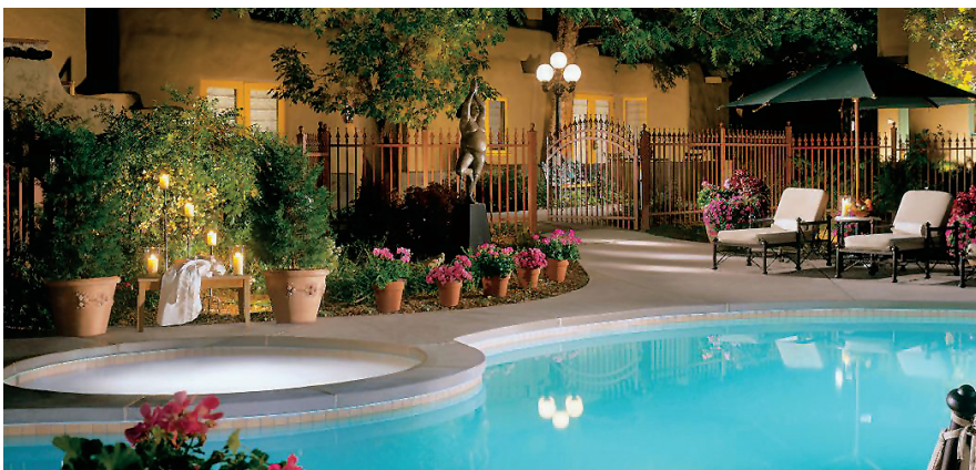
La Posada de Santa Fe Resort & Spa, Santa Fe, NM, USA

Sceptre 是酒店業訂房連接、網上渠道推廣及收益／渠道管理諮詢服務之翹楚。Sceptre 透過全球分銷系統(GDS)、互聯網及物業直接資源等多種電子渠道及藉著其龐大市場推廣渠道之效益提升客戶酒店之知名度，有助酒店增加收益及對品牌之認知，從