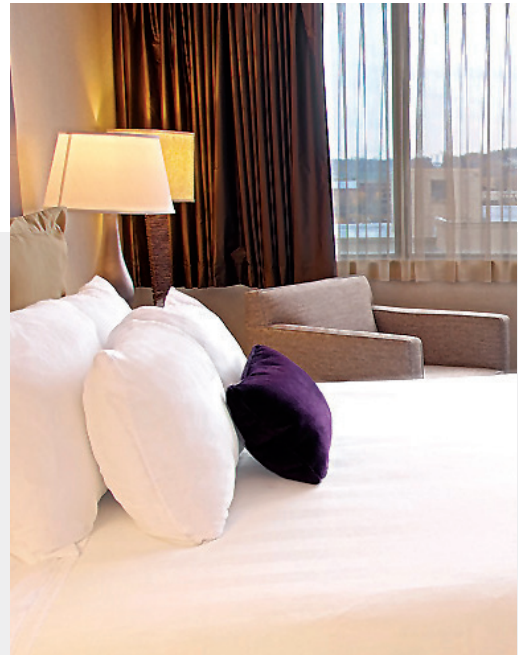
Crowne Plaza Syracuse Hotel, Syracuse, NY, USA

本集團之酒店管理部門Richfield Hospitality, Inc(「RHI」)錄得較高之管理費33,000,000港元，較二零一二年財政年度之30,400,000港元增加2,600,000港元(或8.6%)。憑藉良好成本控制及措施，RHI貢獻較低之除稅前虧損為1,000,000港元，而二零一二年財政年度則錄得5,400,000港元虧損。