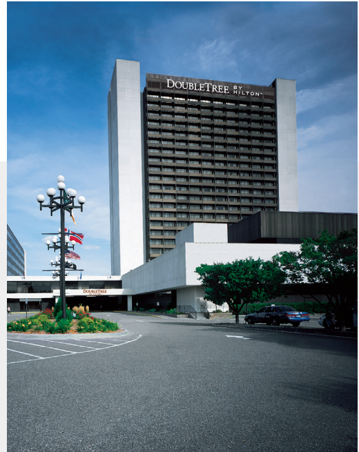
DoubleTree by Hilton Bloomington, Bloomington, MN, USA

整體而言，已動用現金淨額為33,000,000港元，連同有利之匯兌收益3,300,000港元，令本集團之現金及現金等價物總額由二零一二年十二月三十一日之376,400,000港元減少至二零一三年十二月三十一日之346,700,000港元。