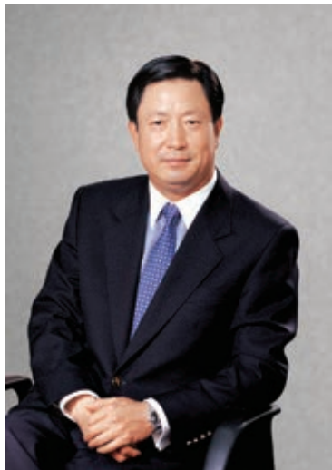
遠東宏信有限公司