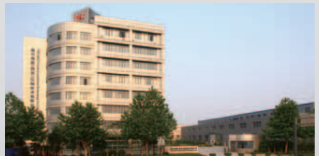
中國西安第二工廠