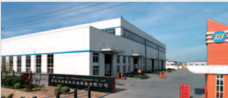
中國青島第二工廠