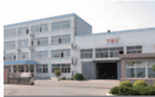
中國青島第一工廠