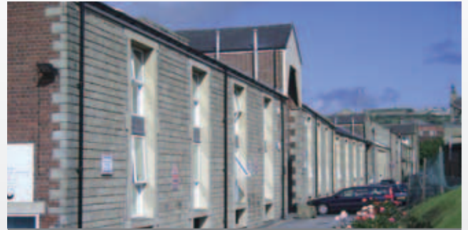
英國希普利辦事處