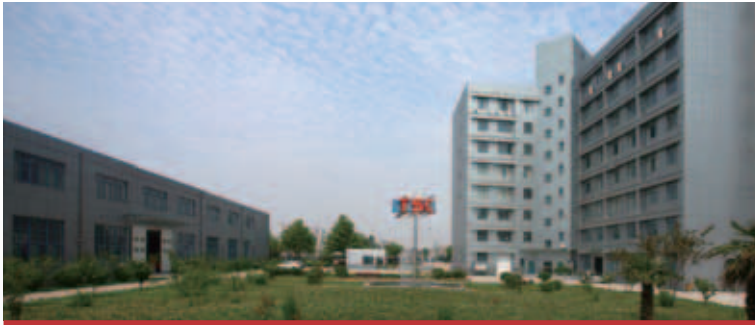
中國西安第一工廠