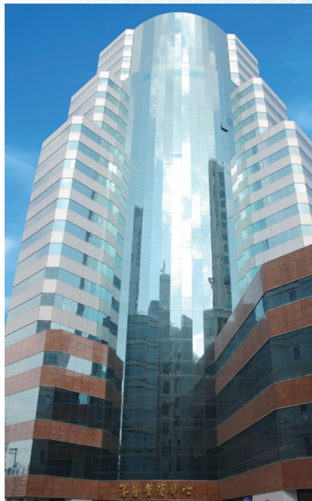
上海港陸黃埔中心