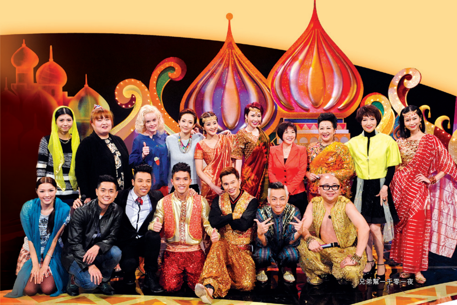
兄弟幫一千零一夜