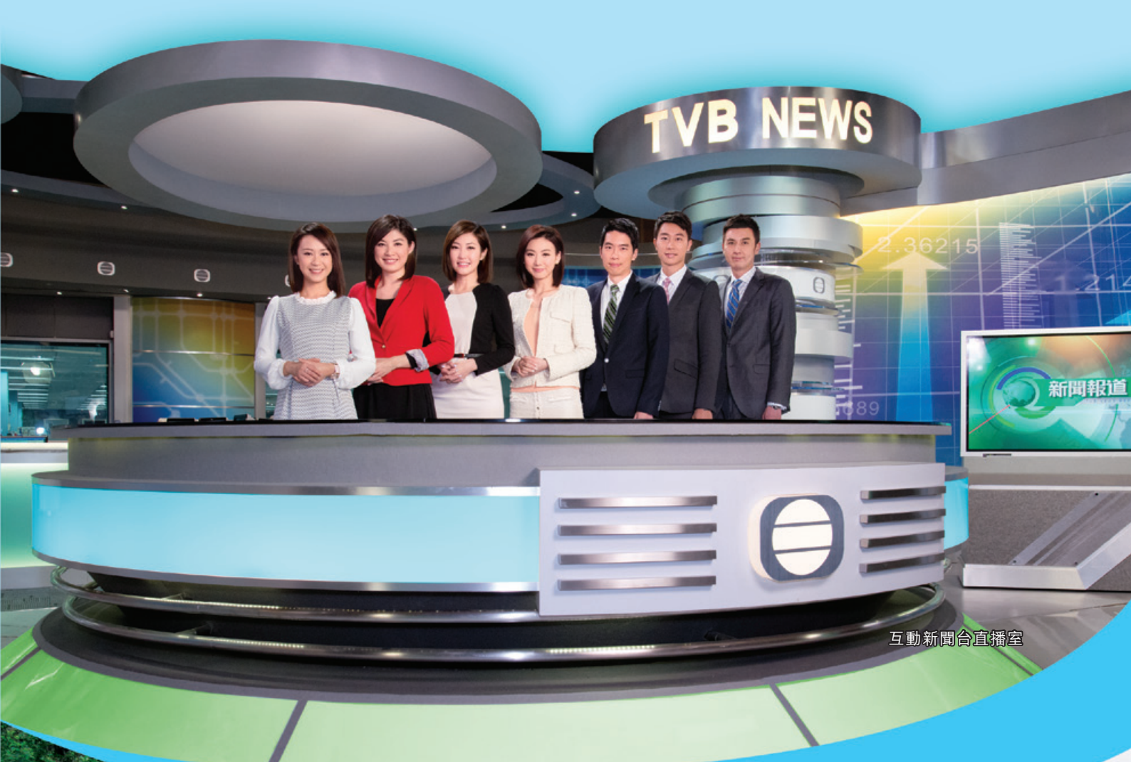
互動新聞台直播室