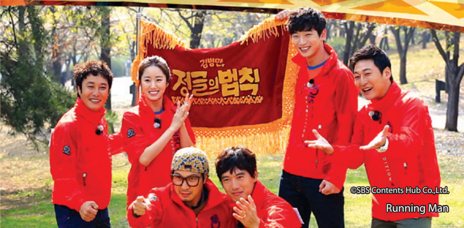
Running Man