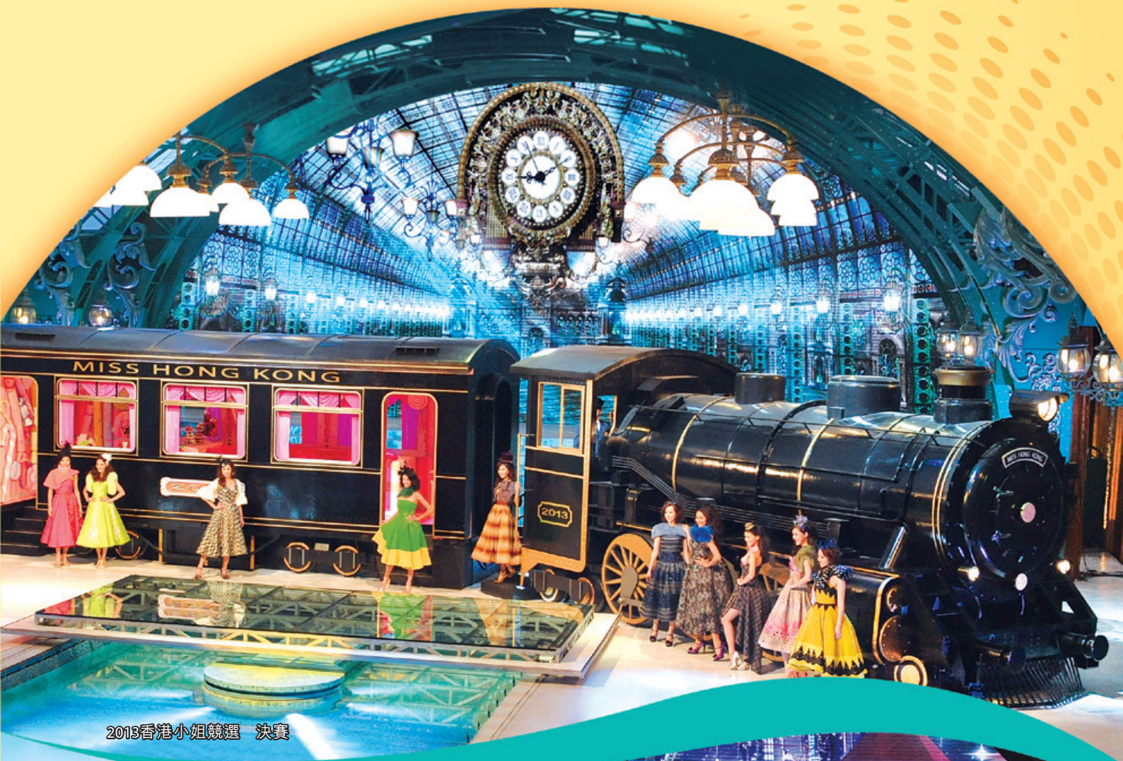
2013香港小姐競選 決賽