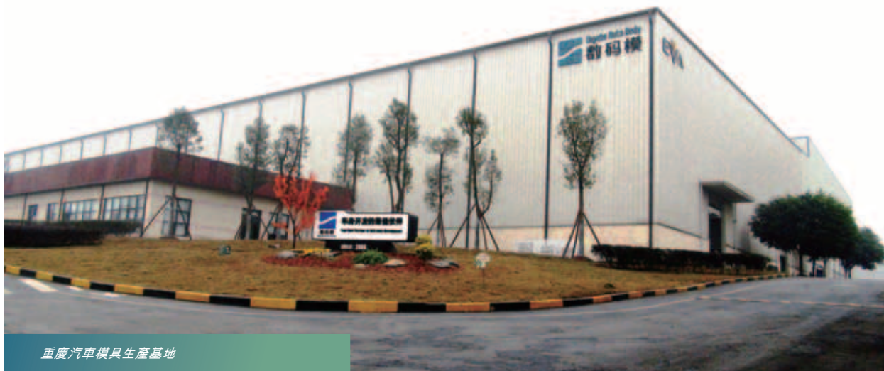
重慶汽車模具生產基地

多元化的產品，以針對高增長的中國消費市場(特別是龐大的汽車市場)。作為此擴張計劃的重要里程碑之一，本集團在武漢的新生產基地於二零一三年底竣工。該生產基地將向位於武漢及其周邊城市的汽車製造商提供零部件生產及焊接服務。本集團過往的汽車業務主要來自生產模具，故武漢生產基地的落成標誌著本集團的一項突破。由於生產零部件較供應模具更具規模，因此武漢新生產基地的落成將大幅加強本集團在持續增長的中國汽車市場中獲取訂單的能力。