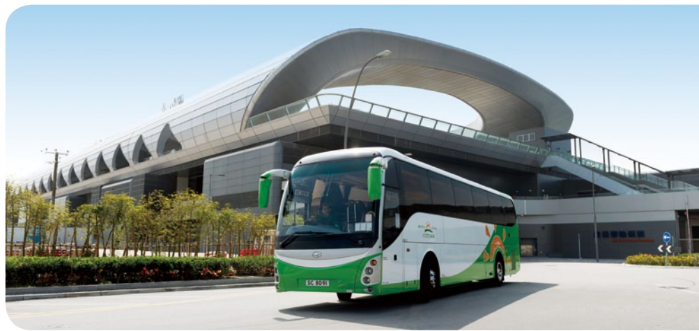
陽光巴士為各類顧客提供質素超卓及物有所值的服務