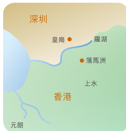
● 新港巴的巴士總站

即使載客量下降，但由於中港兩地的社會及經濟聯繫日趨緊密，加上內地更多主要城市的居民會符合資格參加自由行計劃來港旅遊，旅客人數可望增長，故預料會帶動跨境巴士服務需求上升。新港巴已準備就緒，透過提供方便及優質的服務，使其穿梭巴士服務繼續成為跨境旅客的首選交通工具。