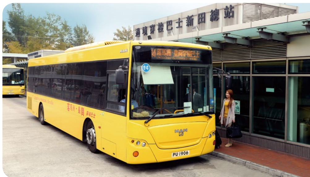
新港巴的穿梭巴士服務深受過境旅客及上班族歡迎