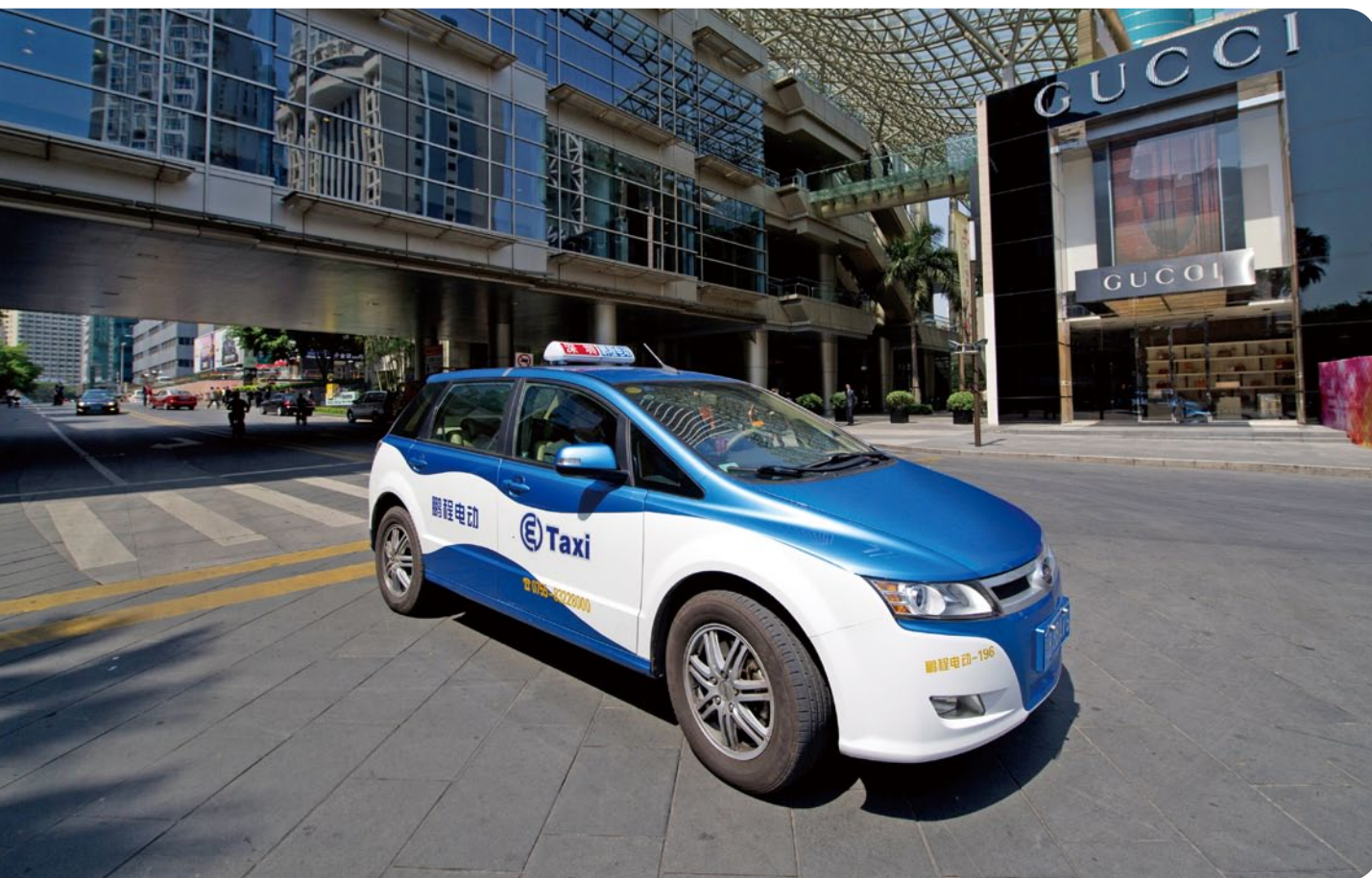
深圳巴士集團實踐環保，在深圳經營一支電動計程車車隊

深圳巴士集團於深圳市的運輸服務、交通設計及支援服務均取得 ISO 9001:2000 認證。