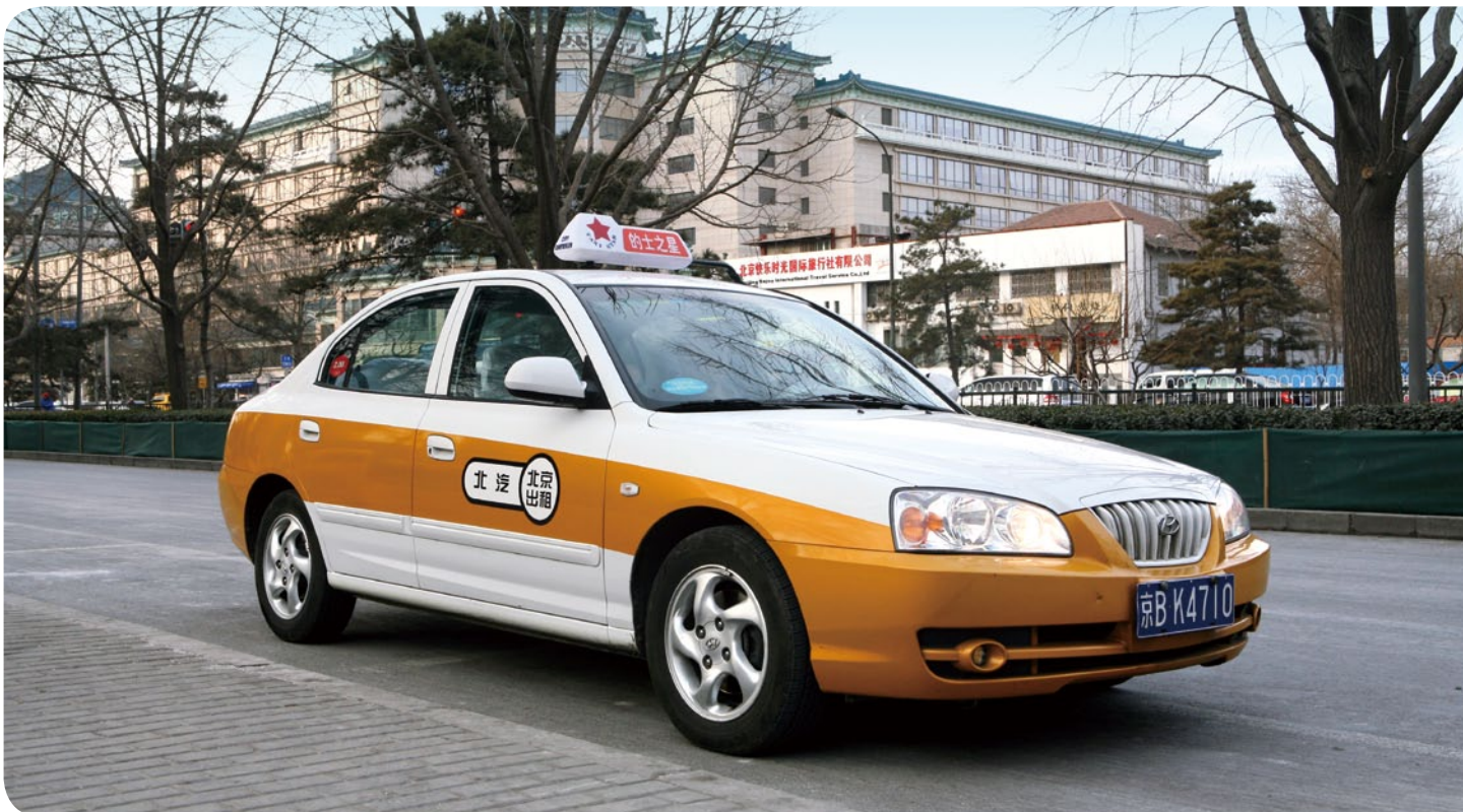
北汽九龍是北京規模最大的計程車公司之一

受惠於北京的商務旅客以及當地舉辦的各項盛事、會議和展覽活動，北汽福斯特具備優勢從中把握與日俱增的商機。於2013年12月31日，北汽福斯特擁有1,170部車輛提供包車服務，主要在北京和天津。中國內地日趨富裕和國際化，有利北汽福斯特在北京和其他內地城市尋覓新的市場機遇。