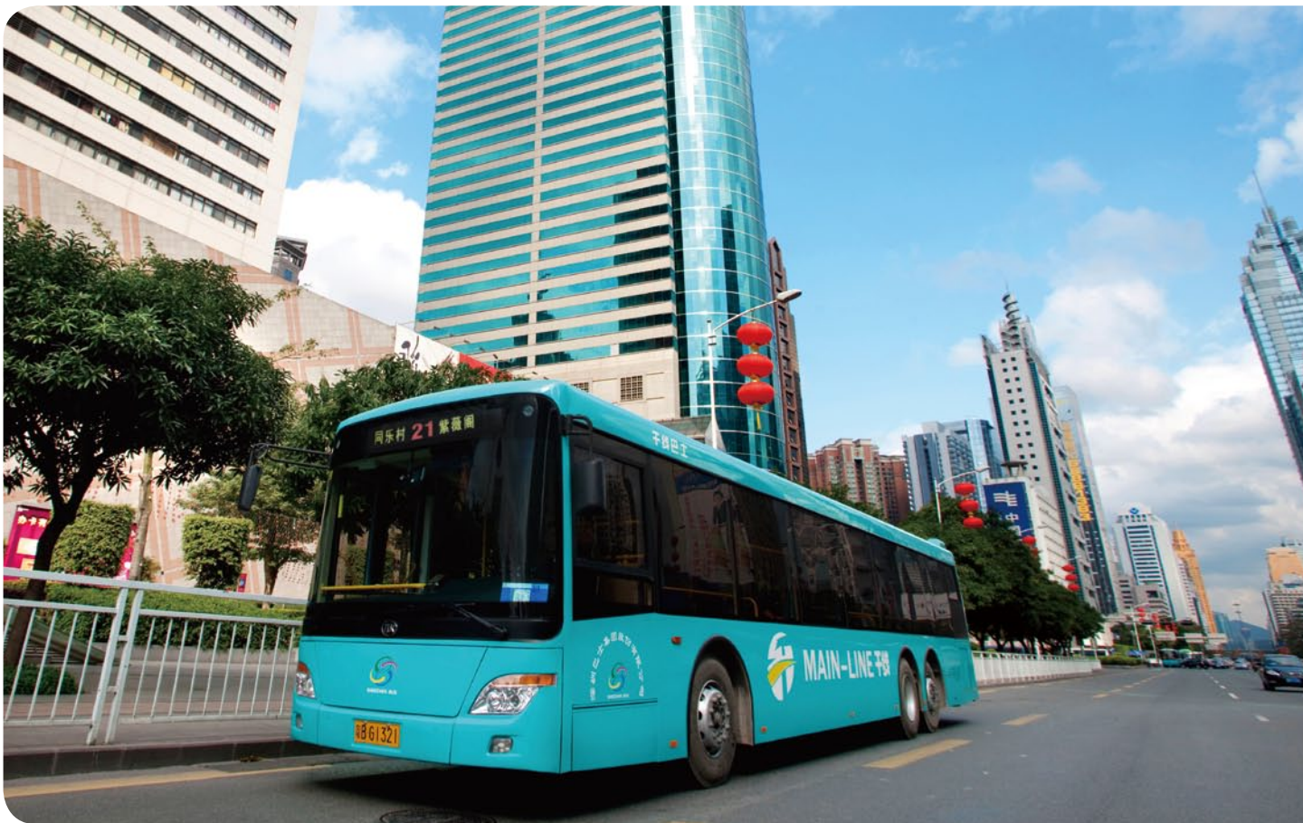
深圳巴士集團透過其270條路線網絡為乘客服務

共運輸市場的競爭力，深圳巴士集團採取各項措施，包括策略性的巴士網絡重組、重新編排設有售票員的巴士路線等，從而在不降低服務質素的情況下提高生產力。此外，深圳巴士集團還推行嚴謹的財政預算監控措施，以減輕營運成本不斷上漲的影響。於2013年，深圳巴士集團開辦更多接駁巴士路線以連接住宅區與地下鐵路站，並把巴士路線網絡擴展至鄰近地區。