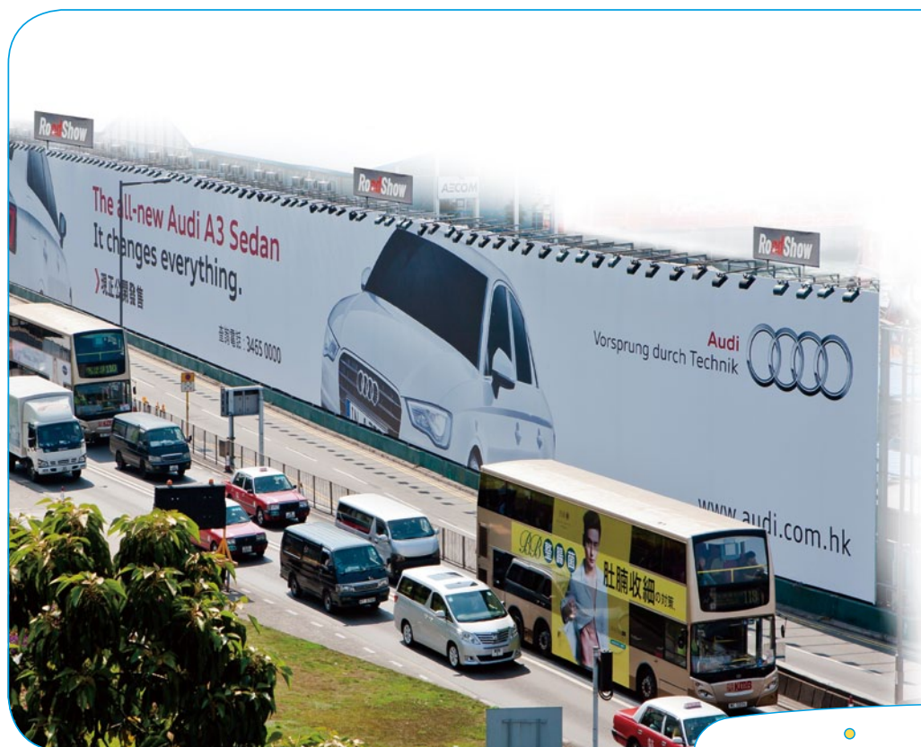
路訊通在香港海底隧道入口的廣告牌，是一個威力強大的廣告平台