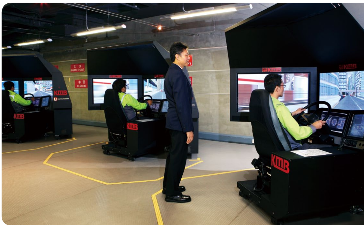
九巴的巴士模擬駕駛室模擬真實的路面環境，協助車長提升駕駛技巧

九巴及龍運利用有系統的表現評估機制來監察車長表現，確保把服務保持在最高的水平。若車長的表現未能符合這些高標準，我們會提供改進培訓，並由表現管理小組協助車長認識自己的長處和短處。集團的非專營巴士車長也受相若的表現評估措施監察。表現出色的車長則獲頒授獎金及獎狀以作表揚。