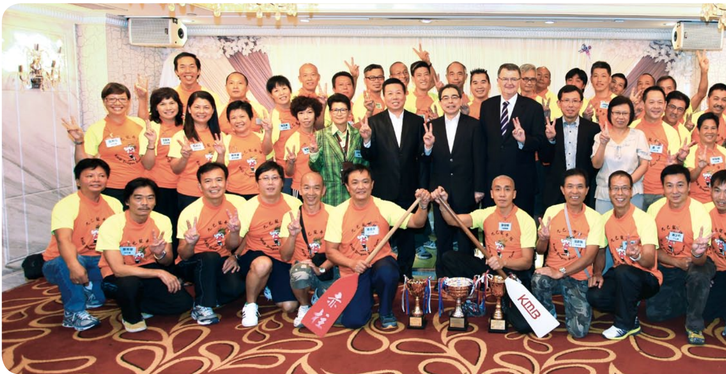
九巴推廣工作生活平衡，鼓勵員工參與康體活動

我們根據員工調查結果，把多間員工飯堂翻新成為自助食堂，讓前線員工用膳及休息。我們亦在休息室