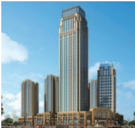
■ 位於天津市之綜合發展項目構思圖