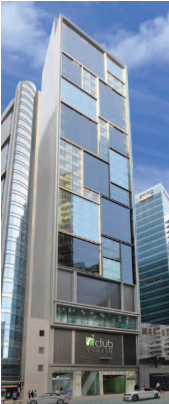
■ 位於北角麥連街 14 至 20 號之新酒店發展項目接近竣工