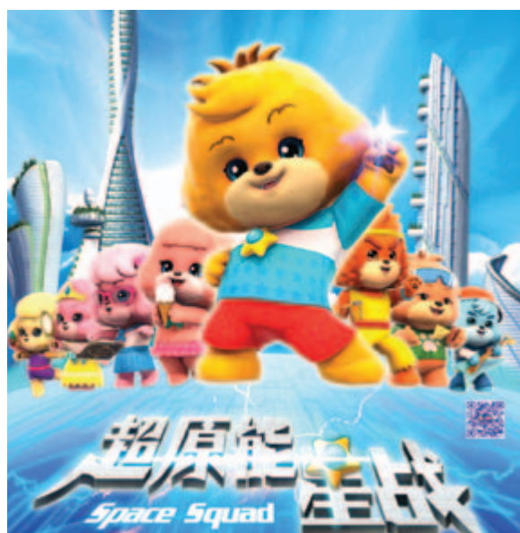
■ 益智3D電視動畫系列《寶狄與好友之超原能星戰》現正在中國中央電視台少兒頻道 (CCTV14) 及在逾一百家電視台黃金時段其他兒童頻道熱播。這部108集的動畫運用世界級動畫技術精心打造了超過500個豐富場景及250多個角色人物，重新締造中國兒童原創動畫之標準。