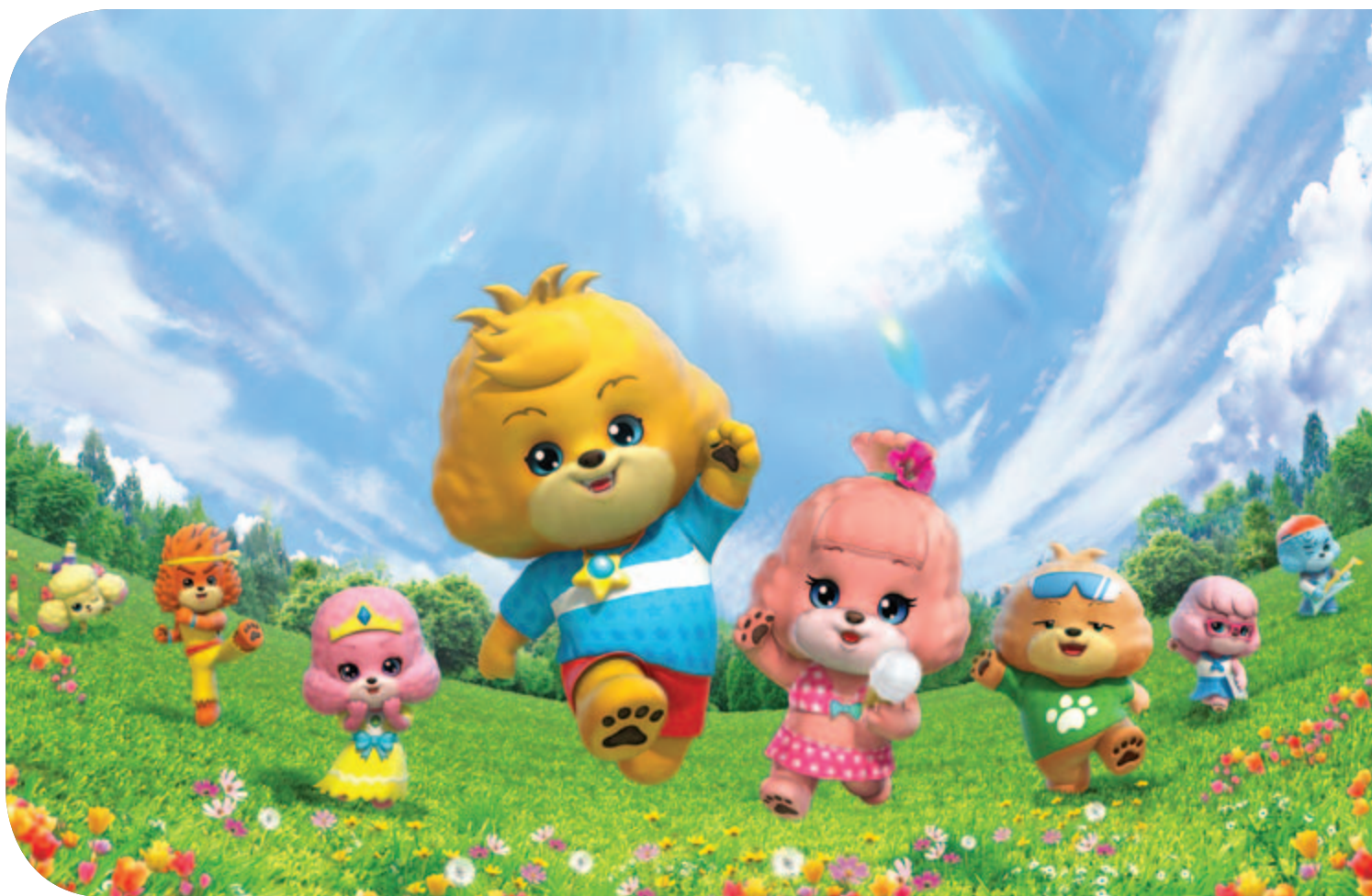
■ 「Bodhi and Friends 寶狄與好友」之3D電視動畫系列及多媒體平台旨在透過教育、娛樂及科技培育孩子仁、智、勇的美德。「寶狄與好友」有助啟迪兒童之多元智慧和正面道德價值觀。