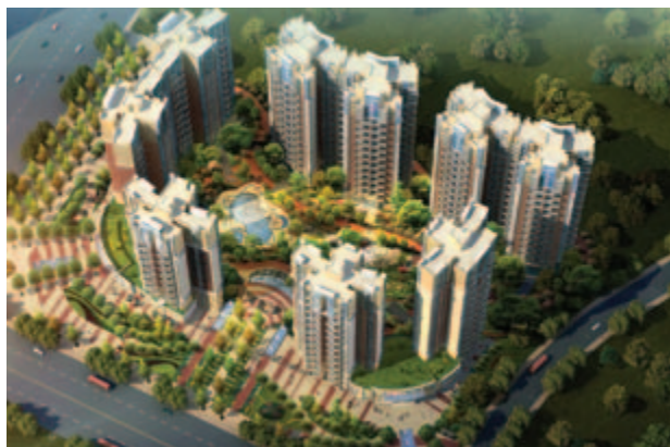
■ 綜合發展項目之住宅大樓構思圖