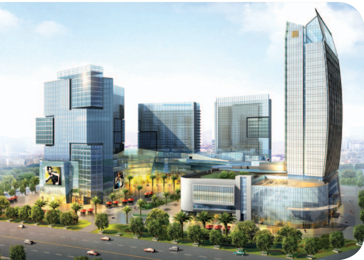
■ 位於四川成都新都區之綜合發展項目之五星級酒店富豪新都酒店及商業大樓構思圖