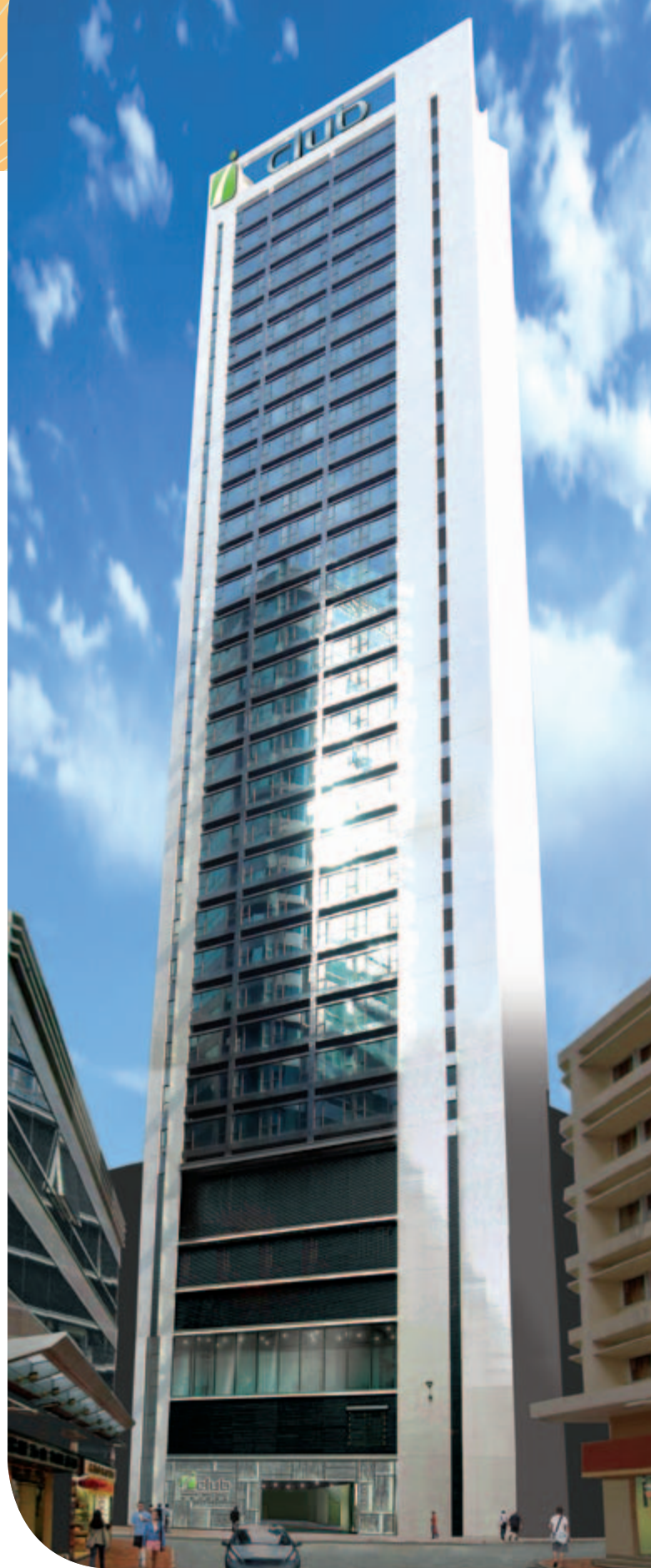
■ 位於上環文咸東街 132 至 140 號、將命名為「富薈上環酒店」之新酒店已於二零一四年一月落成