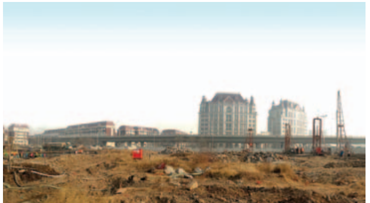
■ 位於天津市之發展地盤