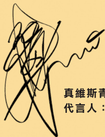
真维斯青春系列 代言人：喬任梁