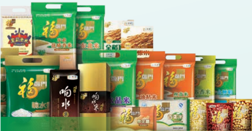
「福临门」品牌 系列大米產品