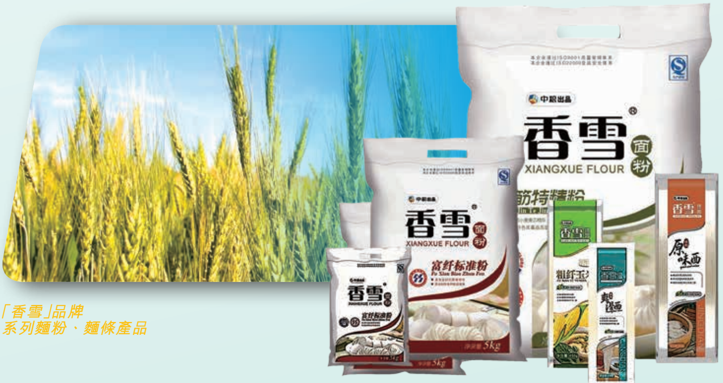
「香雪」品牌 系列麵粉、麵條產品

期內，本公司依托成熟的技術優勢，提高銷售服務意識和客戶服務能力，鞏固與現有大客戶的戰略合作夥伴關係，保持專用粉業務行業領先地位。同時，加大資源投入，強化經銷商網路和現代渠道建設，確保新產能繼續穩步釋放，銷售規模及市場份額保持穩步增長，麵粉及乾麵銷量分別按年上升10.7%及15.8%，收入按年增長13.4%至41.896億港元。但在需求低迷、行業競爭加劇