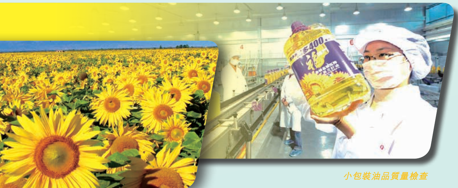
小包裝油品質量檢查

油籽加工業務上半年錄得收入267.692億港元，同比增加14.7%。本公司為了維護客戶合作關係，保證穩定供貨，油籽粕銷量從同期低水平明顯恢復73.5%至328.0萬噸。期內大豆壓榨行業相關市場走勢複雜，行業經營形式更加嚴峻，上半年油籽加工業務錄得虧損。