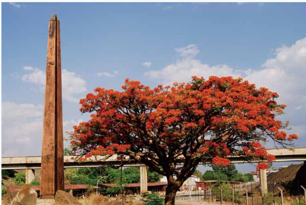
盧安夏銅礦發現紀念碑

截至2014年6月30日止6個月期間，本公司或其任何附屬公司概無購買、贖回或出售的任何上市證券。