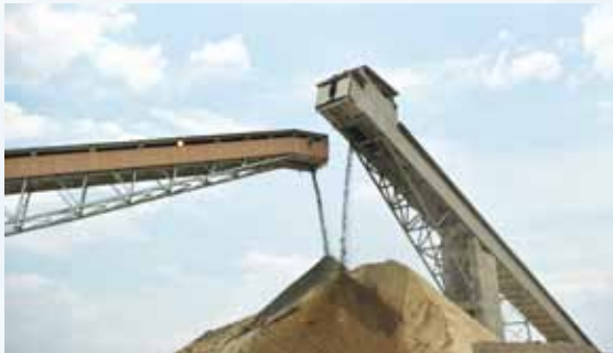
謙比希銅礦主礦體與西礦體礦石皮帶