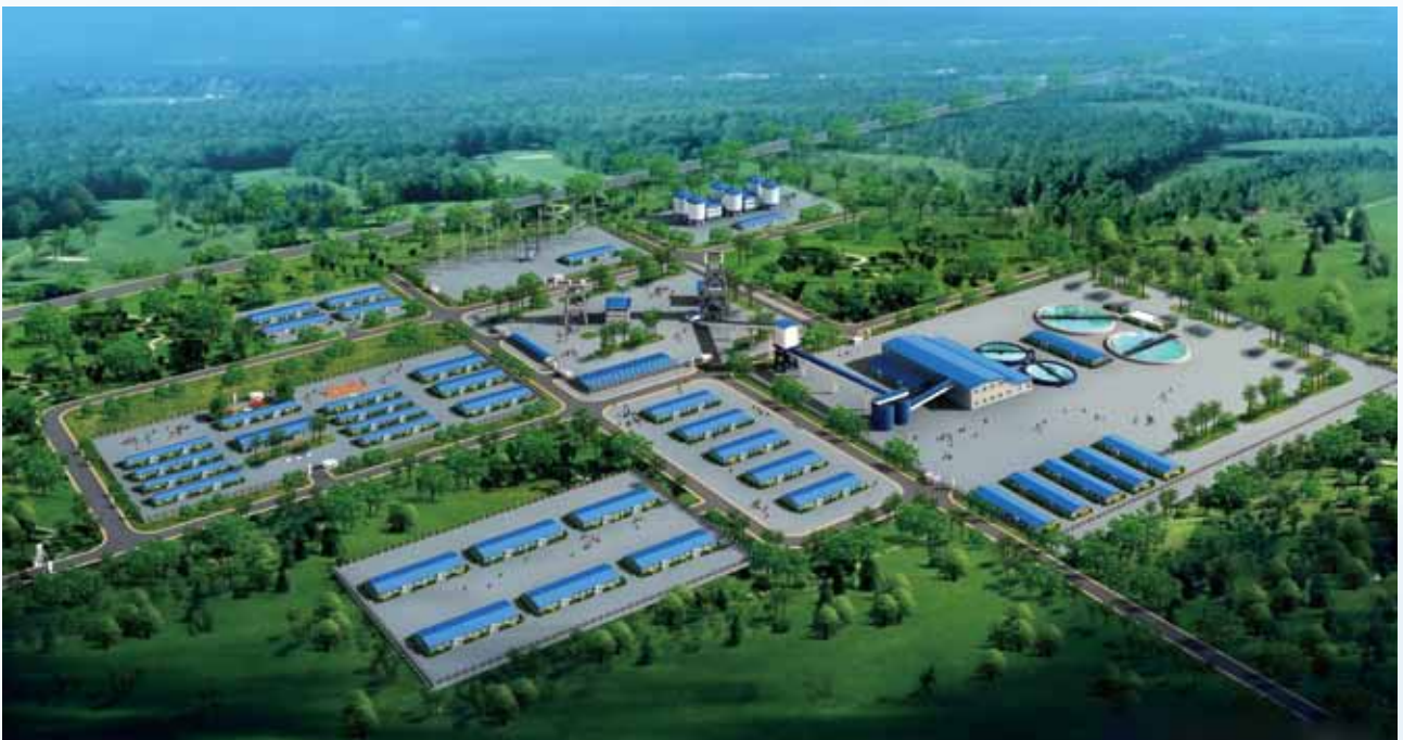
謙比希銅礦東南礦體採選工程鳥瞰圖

本集團始終注重嚴格認真執行環保法規，通過不斷加大安全環保投入，提升安全環保管理水準；本集團高度重視各利益相關方的關切，實現合作共贏；本集團將繼續積極履行好企業社會責任，為社區經濟和社會發展做貢獻。