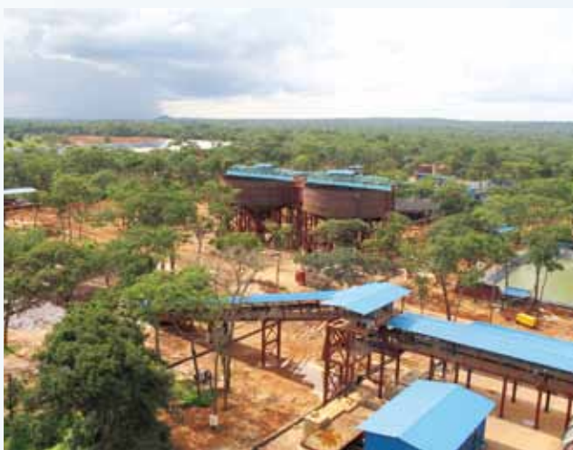
馬本德2萬噸濕法冶煉項目建成全景

此外，謙比希銅冶煉鈷回收項目的可研報告已通過評審，初步設計工作正在進行，本集團還正在開展中色盧安夏穆利亞希南露天礦開採和卡科索尾礦等新的資源項目開發工作，積極推進發展儲量項目以保證本公司的持續增長。