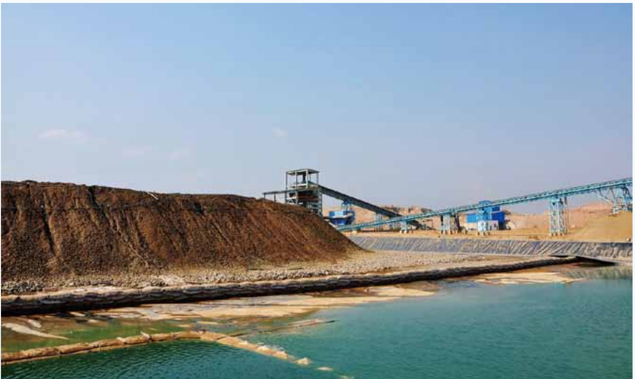
穆利亞希項目噴淋後浸出液

針對上述情況，本集團將繼續通過勘探開發和收購兼併等方式進一步增加銅、鈷儲量和資源量，推進重點項目的建設，擴大火法、濕法冶煉產能，同時繼續優化內部管理，嚴格成本控制，提高運營效率，以確保盈利能力。