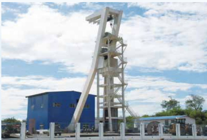
謙比希銅礦西礦體中央副井

於2014年6月30日，有關或然負債的詳情載於本中期業績報告的簡明綜合財務報表附註24。