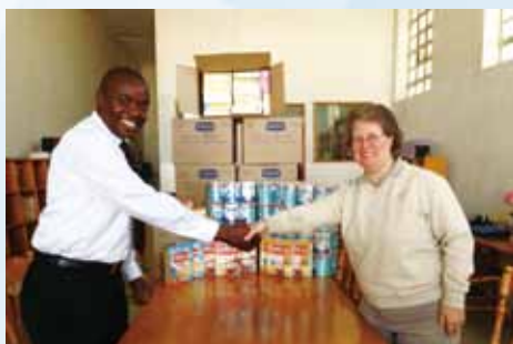
中色盧安夏向當地嬰幼兒捐贈食品