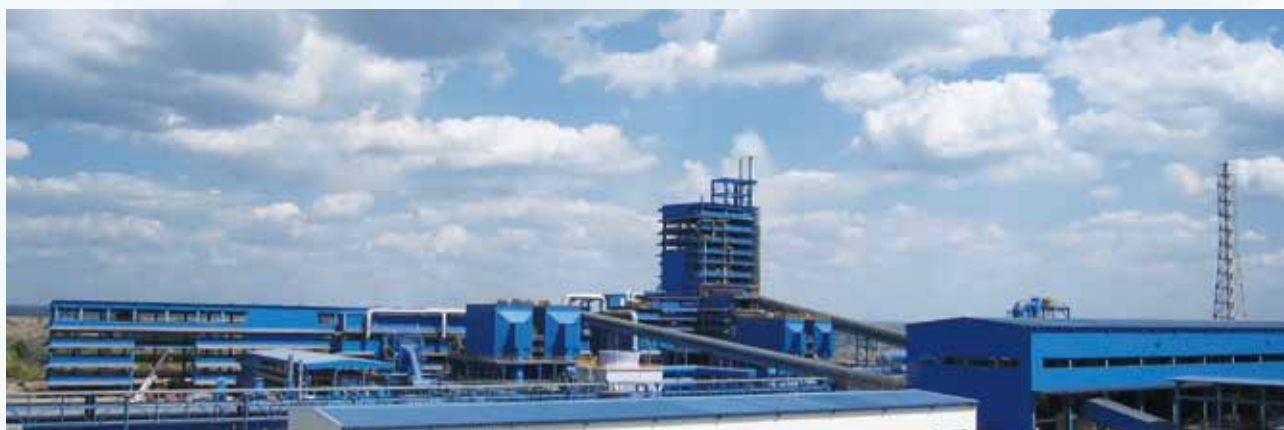
銅冶煉公司廠房全景