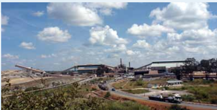
謙比希銅礦選礦廠全景

謙比希濕法穆旺巴希露天礦工程：完成剝離土方156.78萬立方米；地表工程：完成維修車間、宿舍區和辦公區建設，礦山運輸道路正在建設。