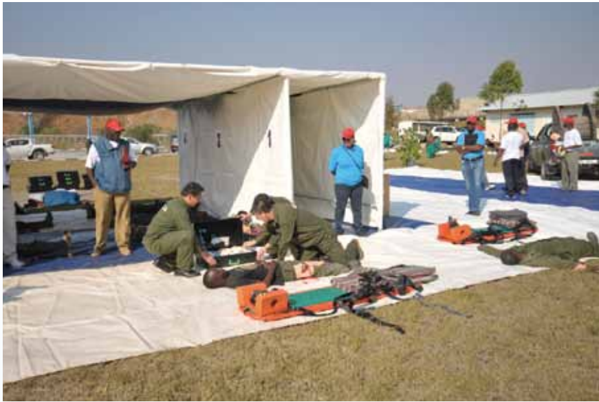
中色非礦領導班子參加礦山急救演練競賽

本集團截至2014年6月30日止共聘有僱員6,841人(2013年6月30日: 6,308人), 其中包括506名中國員工及6,335名贊比亞及剛果(金)員工。截至2014年6月30日止, 反映在簡明綜合損益表及其他全面收益表中之僱員總成本約為49.77百萬美元(2013年6月30日: 46.22百萬美元)。僱員總成本同比增多之原因為生產規模擴張導致僱員人數增加以及平均薪酬自然增長。