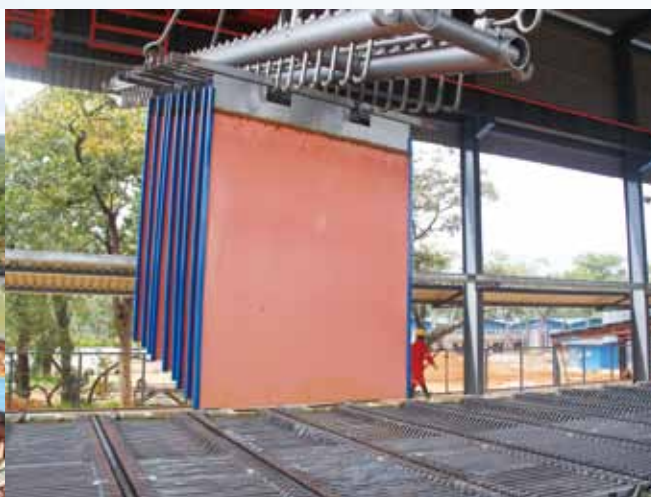
馬本德項目產出產出第一批陰極銅