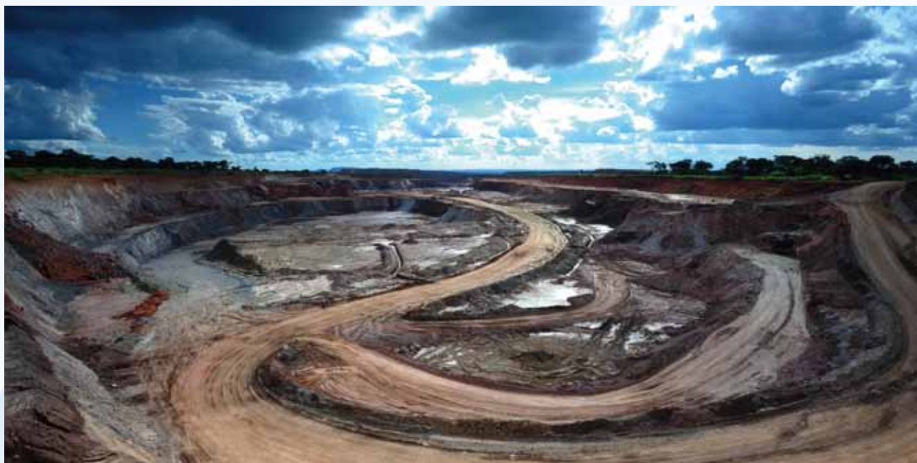
穆利亞希露天採礦場