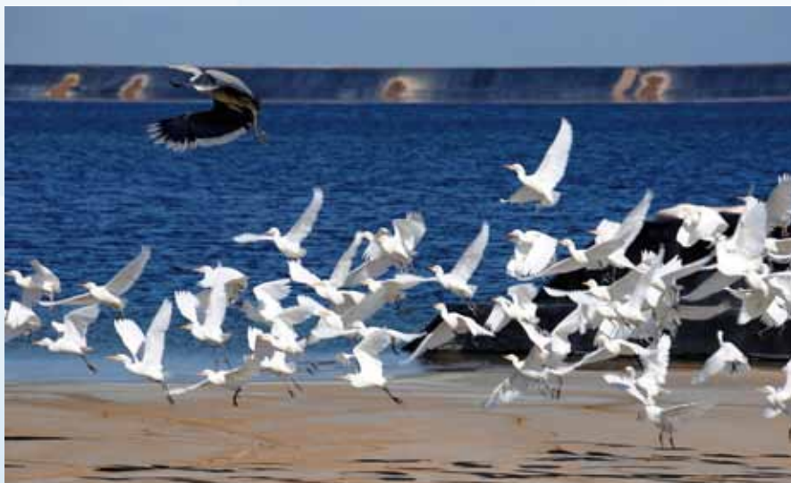
穆利亞希尾礦庫成為候鳥的樂園

2014年上半年，本集團通過貨幣資金和實物的形式積極參與了企業所在地市政建設、愛滋病與瘧疾防治、公共體育設施建設等社會公益事業，得到了當地政府和居民的高度讚賞，進一步樹立了上市公司良好的企業公民形象。