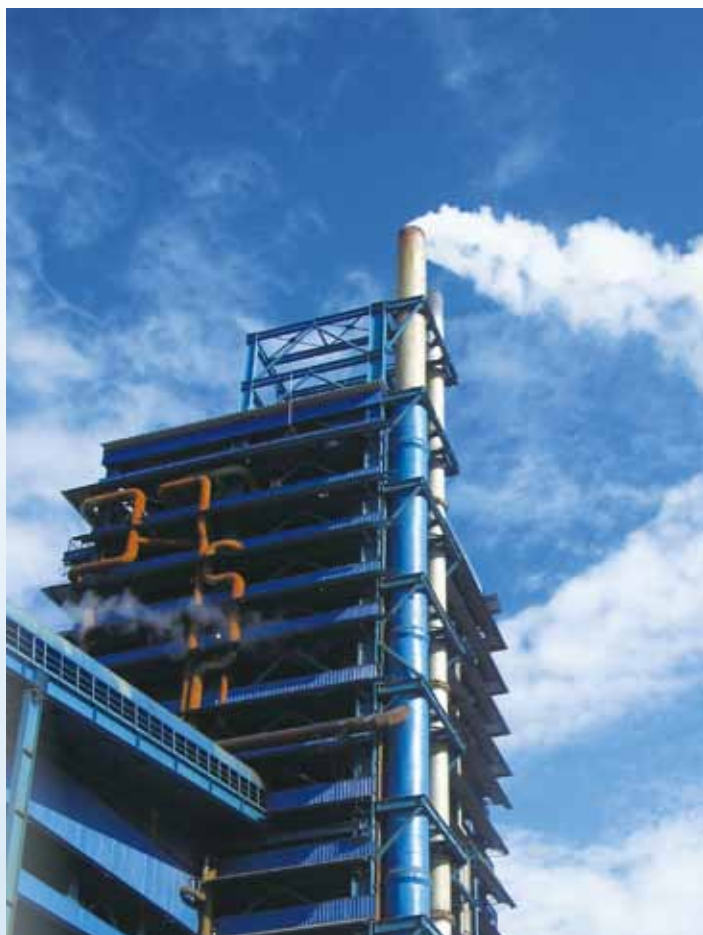
銅冶煉公司ISA爐廠房