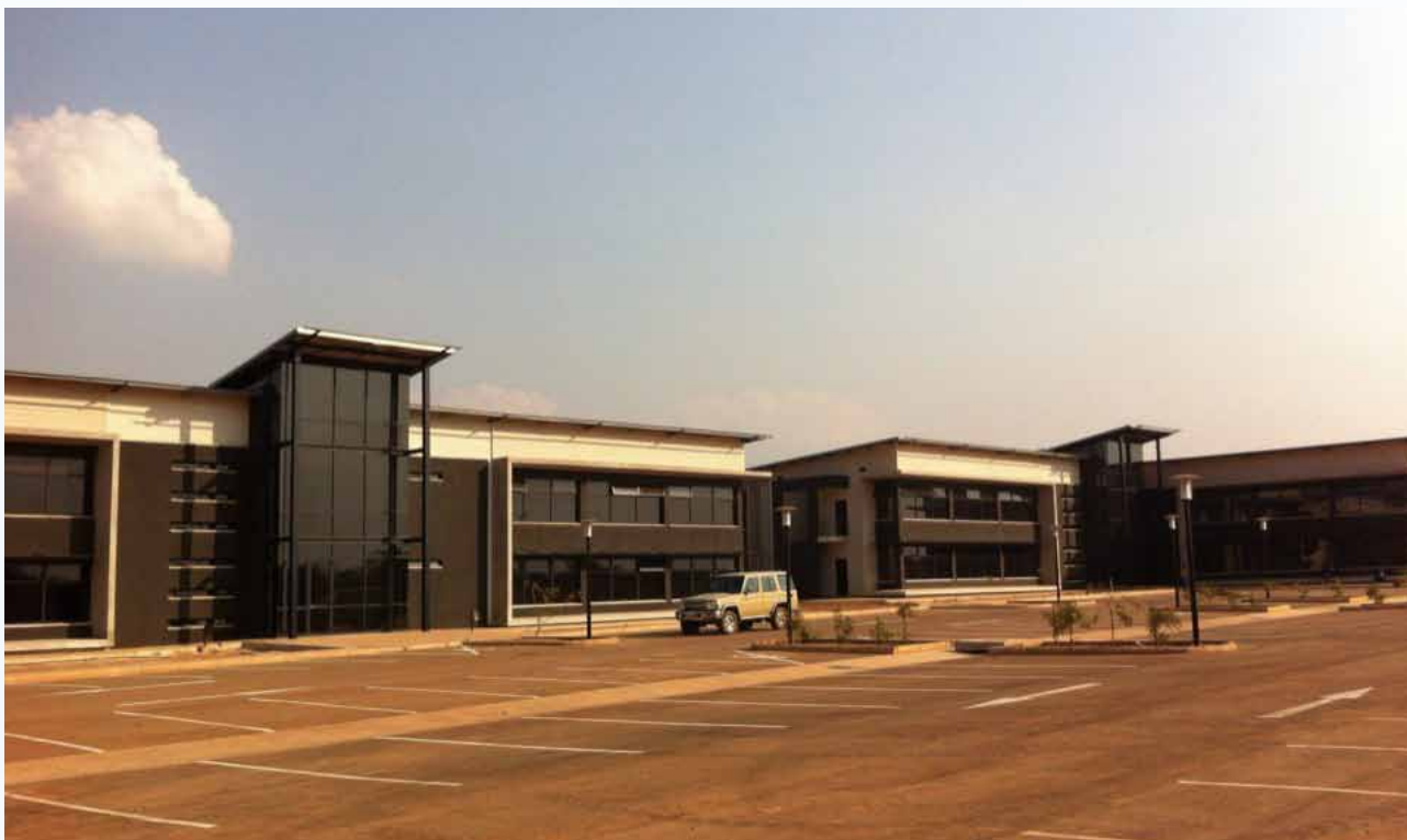
謙比希濕法冶煉剛果(金)盧本巴希辦公區

為使獨立董事對公司的經營方式、業務活動及發展情況有進一步的了解，管理層每月均向董事提供公司經營發展及合規層面的主要資料概況。2014年上半年，我們還組織了獨立董事進行贊比亞現場考察，並就獨立董事就其技能、專業知識方面提出的獨立、富建設性及有根據的意見進行了反饋。