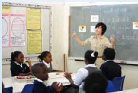
中色盧安夏信托學校志願者在教授中文