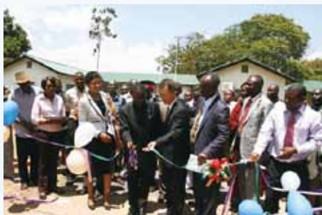
中色非洲礦業向當地市政廳捐贈平路工程車及建設圍牆

本集團嚴格遵守企業所在地的有關安全生產和勞動保護等法律法規，始終堅持「安全第一、預防為主」的安全生產方針，自集團至各附屬公司均牢固樹立「尊重生命、防範為先」的安全生產理念，通過落實安全生產主體責任、明確安全生產責任範圍，加強安全生產教育和風險防控，開展全範圍安全檢查及隱患排查治理工作，不斷健全完善應急預案，加強應急救援隊伍建設，安全生產工作管理水準得到切實提高。本集團高度重視安全環保設施的投資建設，高度重視員工的勞動防護用品的配備和使用管理。在每個礦山和工廠均建立了緊急救護隊並配備了完備的裝備，設立了醫療救護站。2014年上半年，根據當地環保與安全管理部門的資料，本集團所屬企業因工作關係而死亡的人數及比率、因工傷損失工作日數等各項安全指標在當地公司均處於良好的水準。