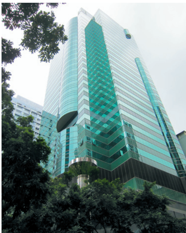
滙漢大廈（包括新近收購相連的福利商業中心）

期內，本集團成功收購毗鄰集團灣仔總部之商業樓宇，為租賃組合增加約80,000平方呎。該兩幢樓宇結構上彼此相連，因而可提供更大樓面面積。