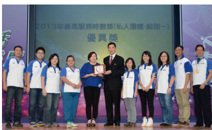
電訊盈科連續第13年榮獲社會福利署頒授義工最高服務時數獎。